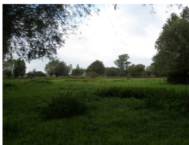
Entrée du hameau depuis Saint-Valery. IVR22_20068005434NUCA

IVR22_20068005676XAB