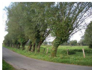
Alignement de saules têtards sur la route de Saint-Valery. IVR22_20068005435NUCA