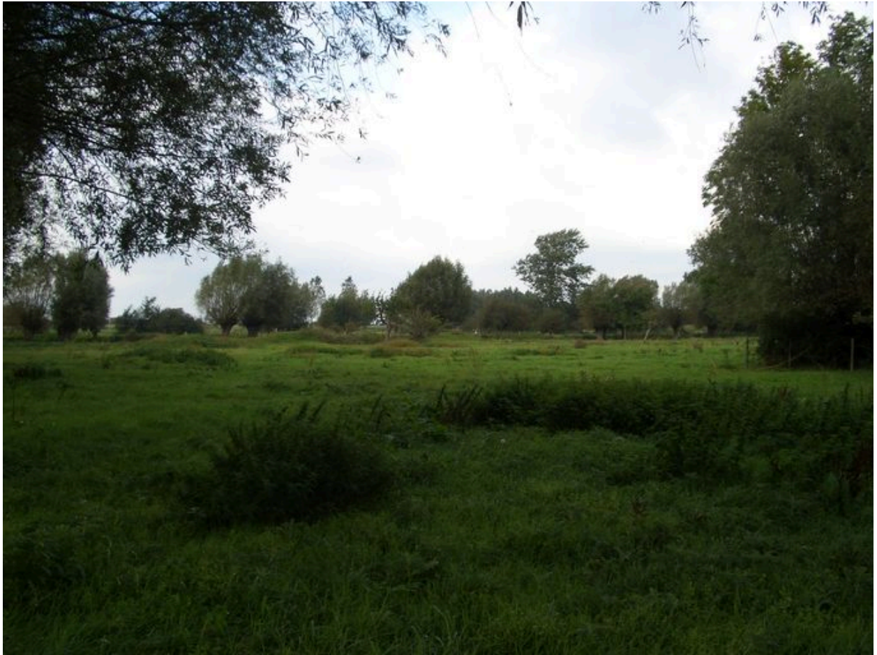
Entrée du hameau depuis Saint-Valery.