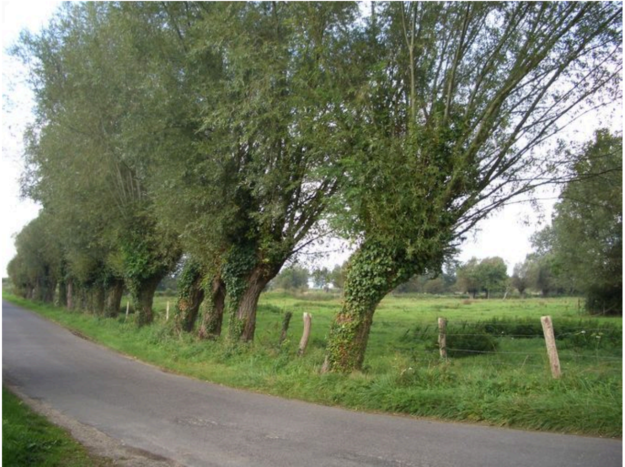
Alignement de saules têtards sur la route de Saint-Valery.