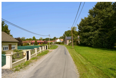
Vue de la rue Clabaut.