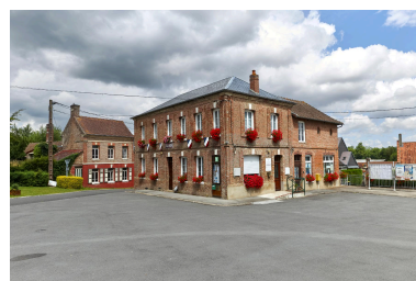
Mairie de Fontaine-sur-Somme, vue prise depuis le sud-est.