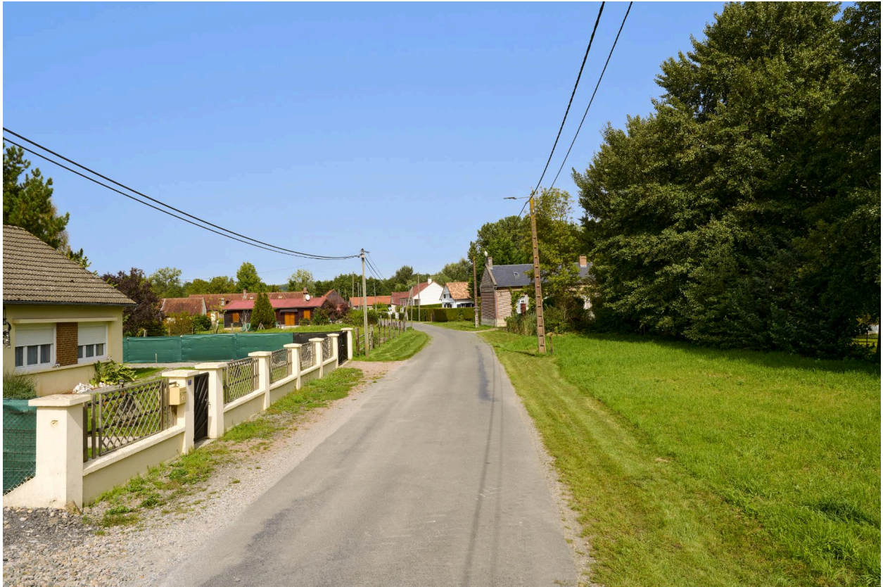
Vue de la rue Clabaut.