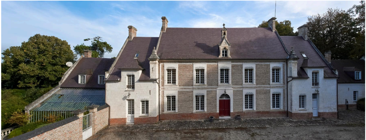
Château de Vieulaines, vue prise depuis le sud.