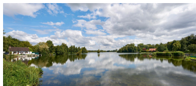
Étang de Vieulaines vu depuis la rue des Marais.