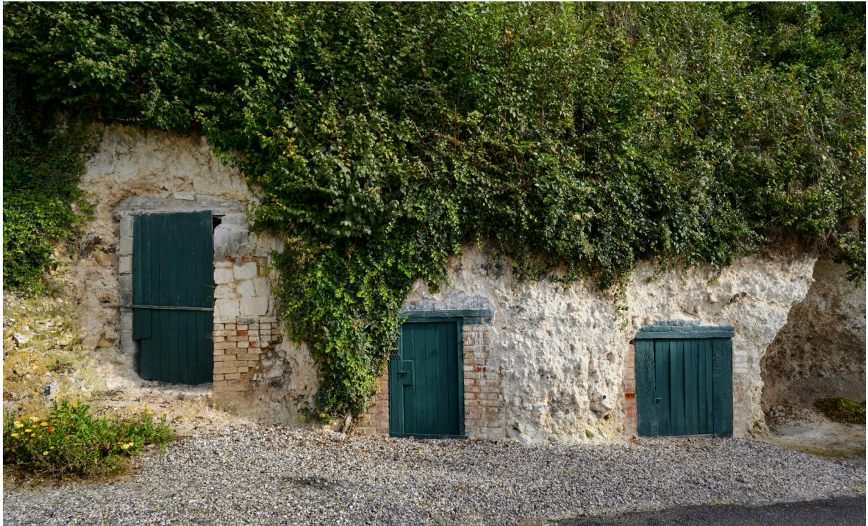
Entrées des anciennes carrières, rue de la Motte.