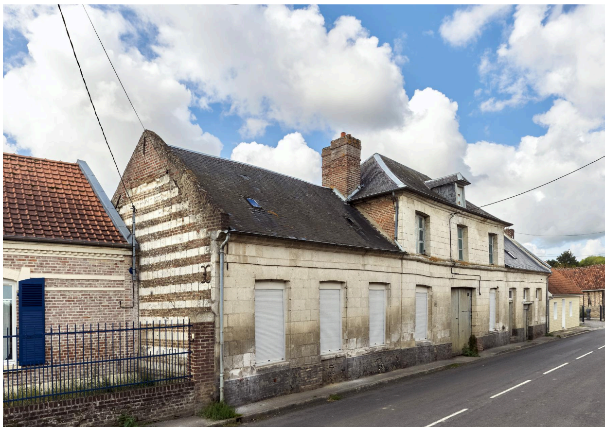
Ancienne école des filles, ancienne chambre communale, ancien presbytère, actuelle salle des fêtes. Vue prise depuis le nord-est.