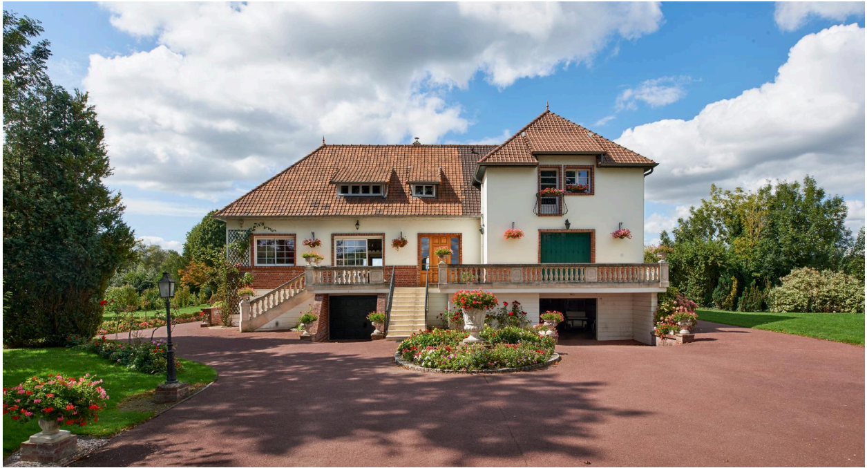
Exemple d'une maison de villégiature, dite la Tourbière, 1 rue du marais. Vue prise depuis l'est.