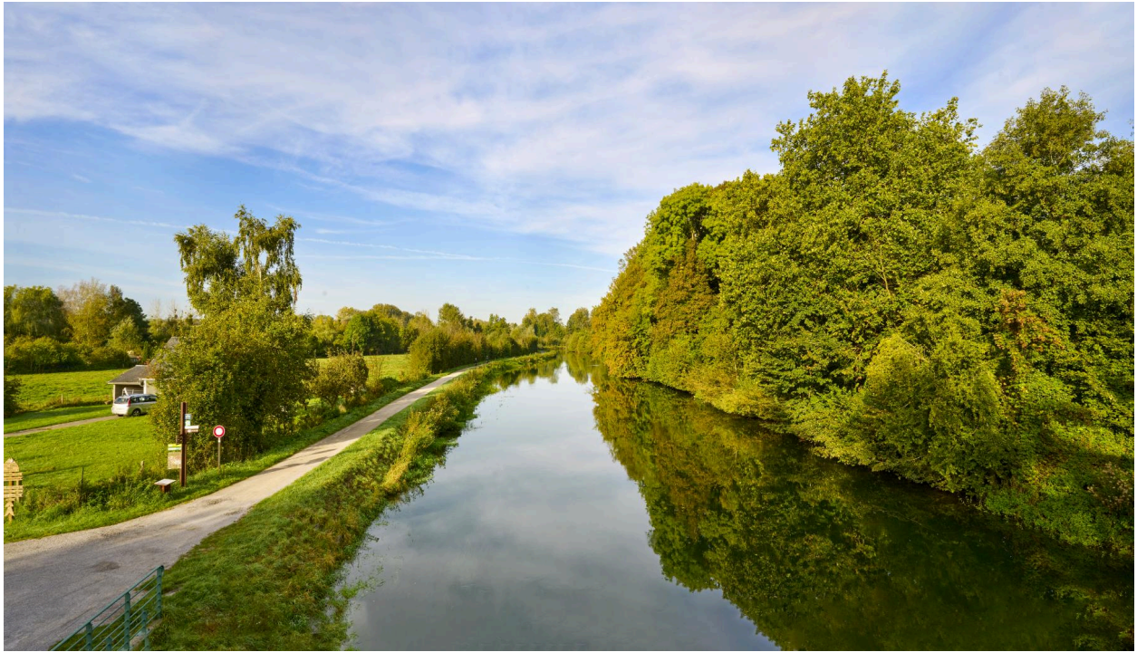
La Somme vue depuis le pont entre Fontaine-sur-Somme et Cocquerel.