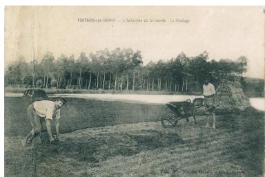
Fontaine-sur-Somme, l'industrie de la tourbe : le moulage, carte postale, [ca 1905] (coll. part.). IVR32_20238000288NUCA