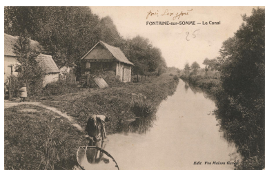
Fontaine-sur-Somme, le canal. Carte postale, [ca 1905]