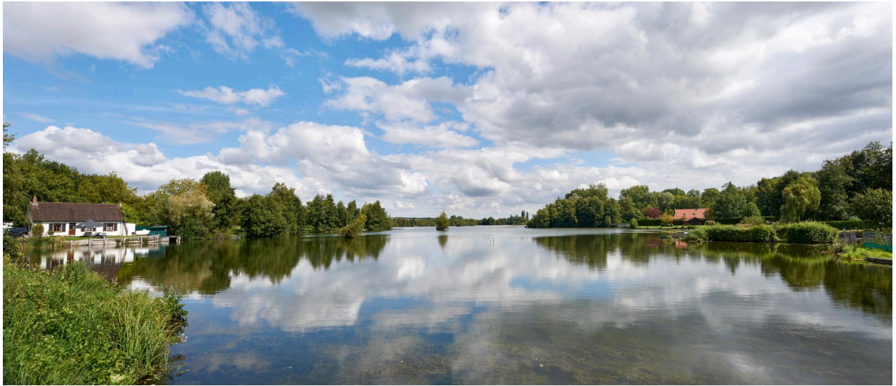
Étang de Vieulaines vu depuis la rue des Marais.