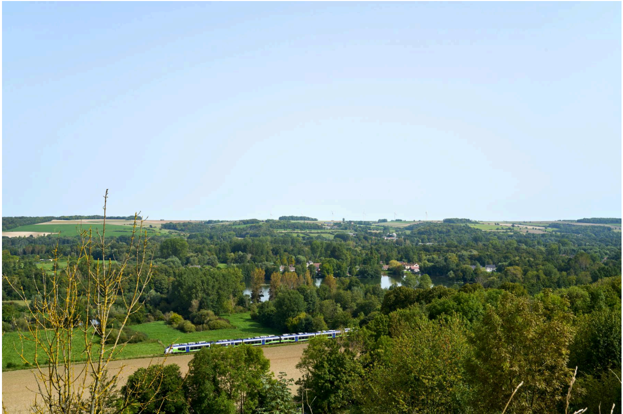
Vue des étangs de Fontaine-sur-Somme et de la voie ferrée prise depuis les coteaux.