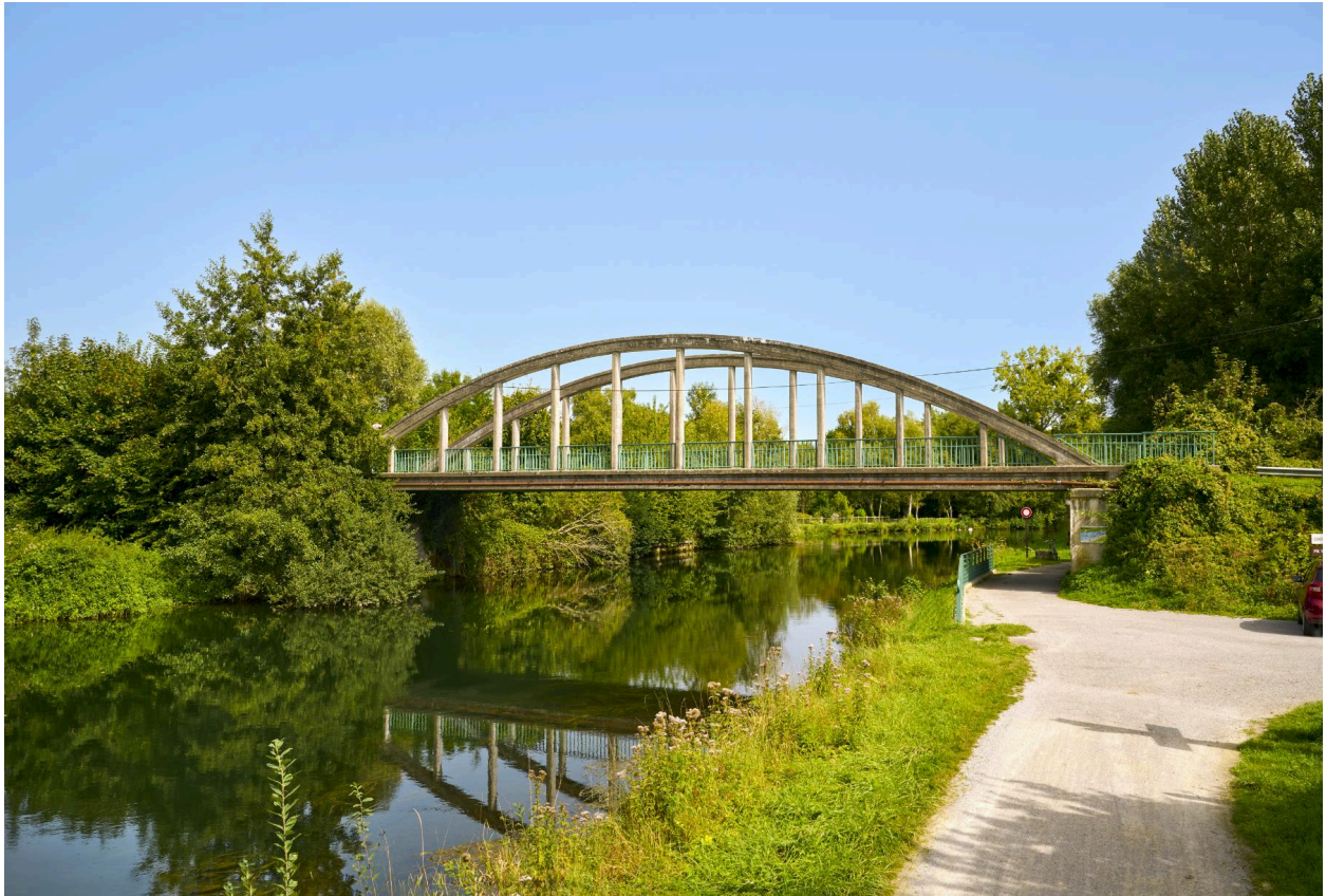
Pont entre Fontaine-sur-Somme et Cocquerel, vue prise depuis l'ouest.