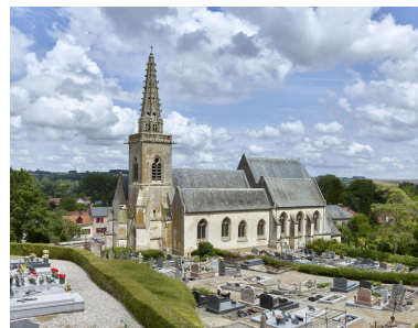
Église Saint-Riquier de Fontaine-sur-Somme, vue prise depuis le cimetière.

Vue des étangs de Fontaine-sur-Somme et de la voie ferrée prise depuis les coteaux.