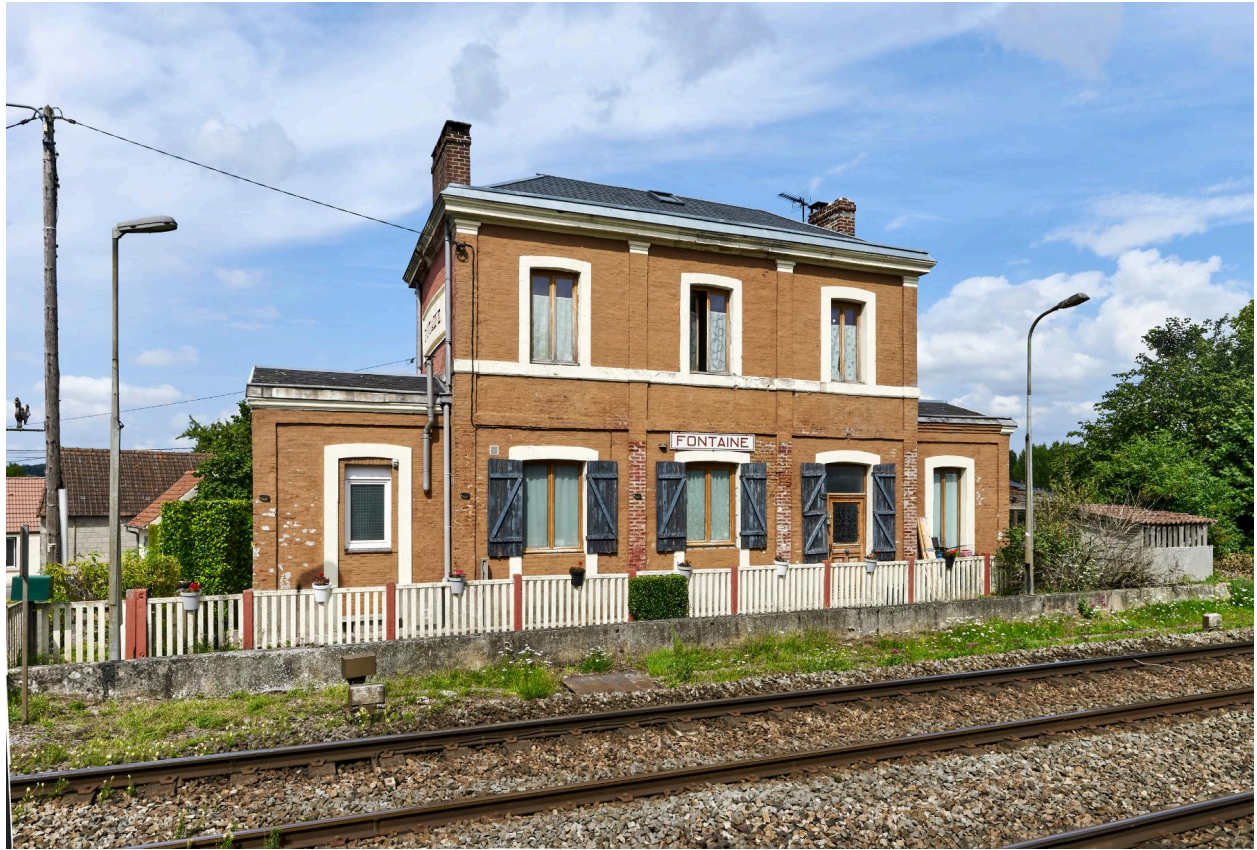
Ancienne gare de Fontaine-sur-Somme, vue prise depuis le sud.