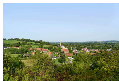
Vue est de la commune prise depuis le chemin neuf.