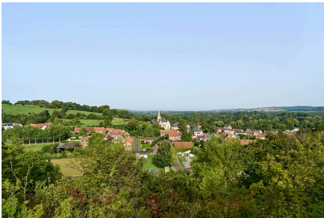
Vue est de la commune prise depuis le chemin neuf.