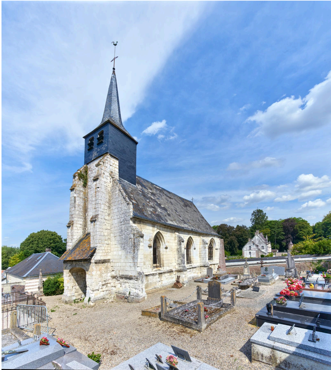
Église Notre-Dame de l'Assomption de Vieulaines, vue prise depuis le sud-ouest.