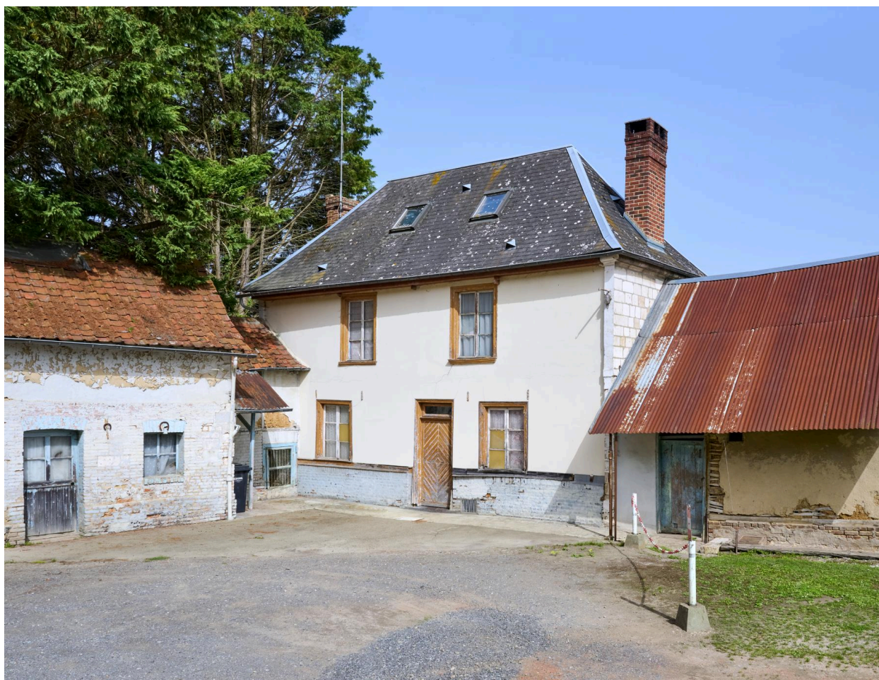
Exemple de maison en pan de bois à un étage, 22 rue de Haut. Vue prise depuis le sud.