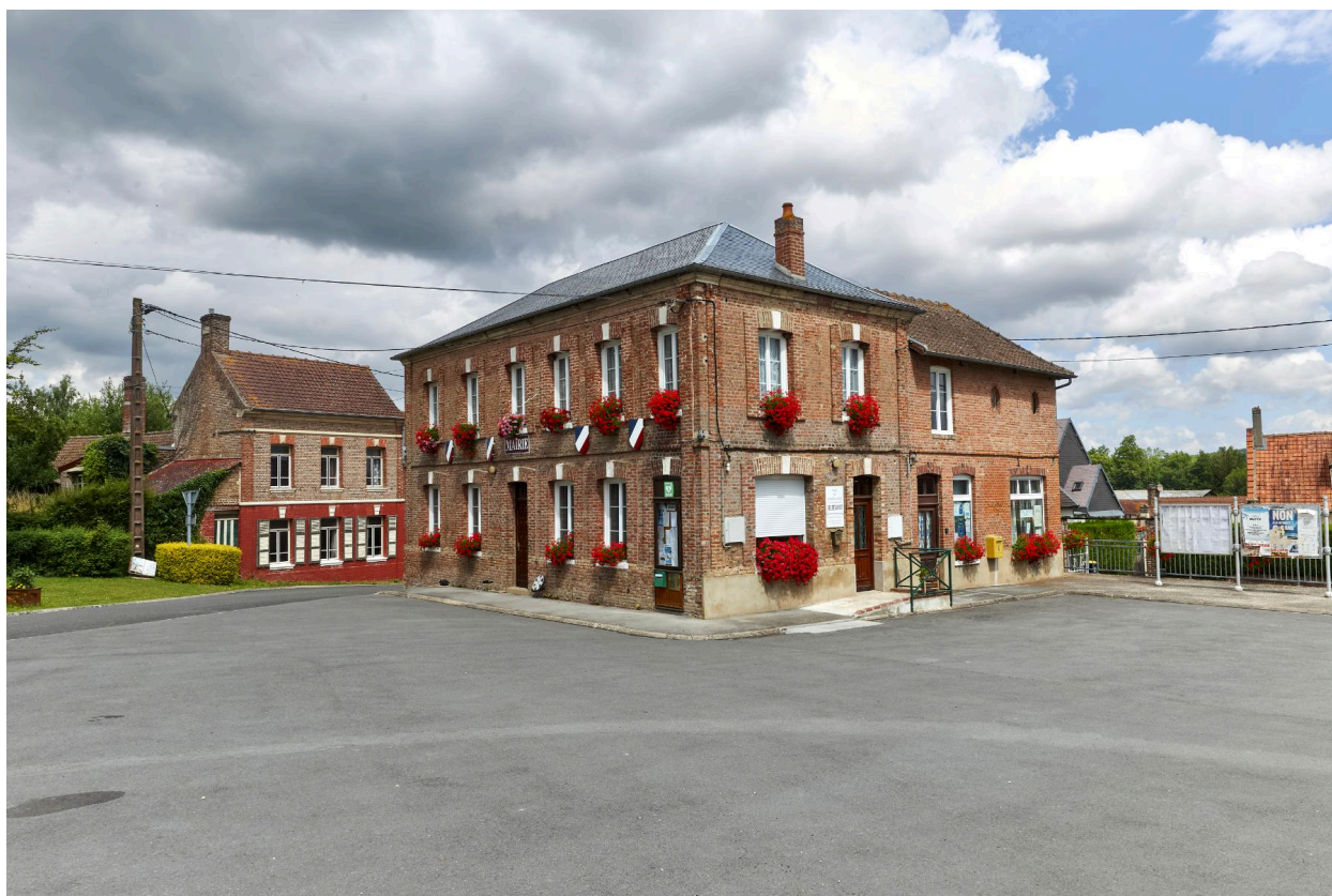
Mairie de Fontaine-sur-Somme, vue prise depuis le sud-est.