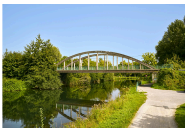
Pont entre Fontaine-sur-Somme et Cocquerel, vue prise depuis l'ouest.