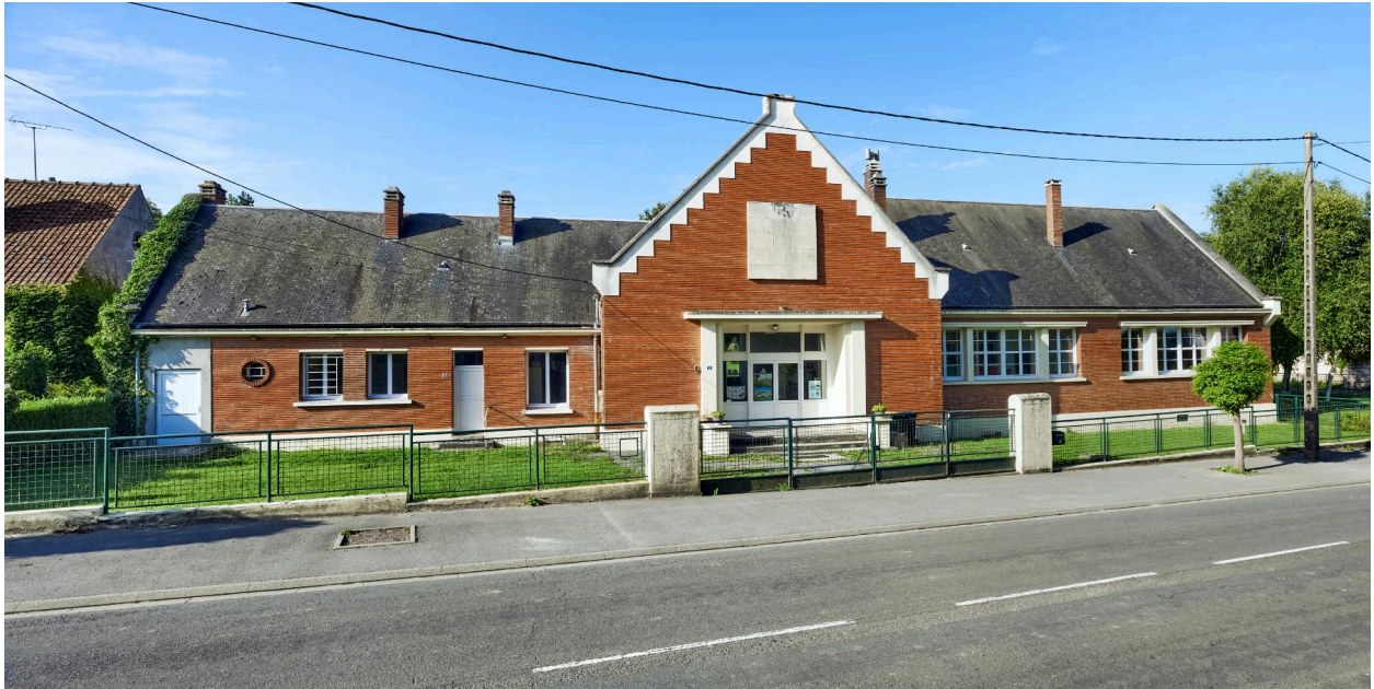
École de Fontaine-sur-Somme, vue prise depuis le nord.