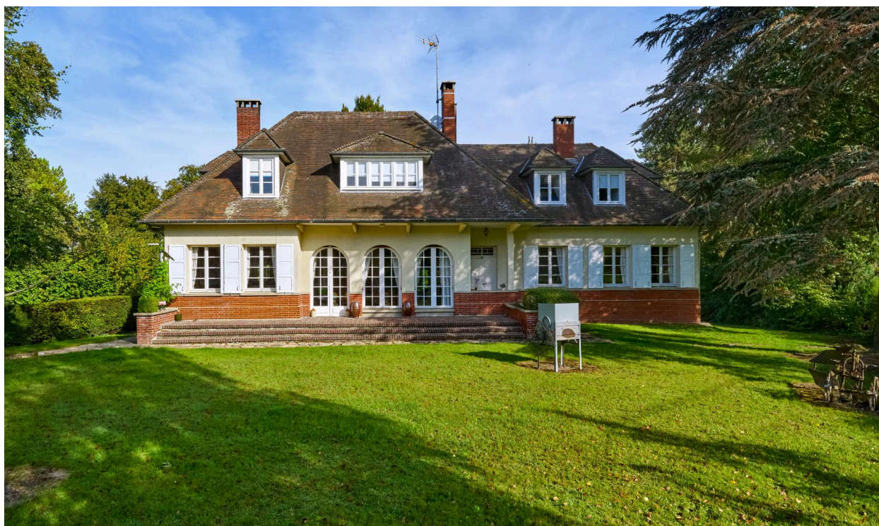
Exemple d'une maison de la Seconde Reconstruction, 9 rue de la carrière. Vue prise depuis le sud.