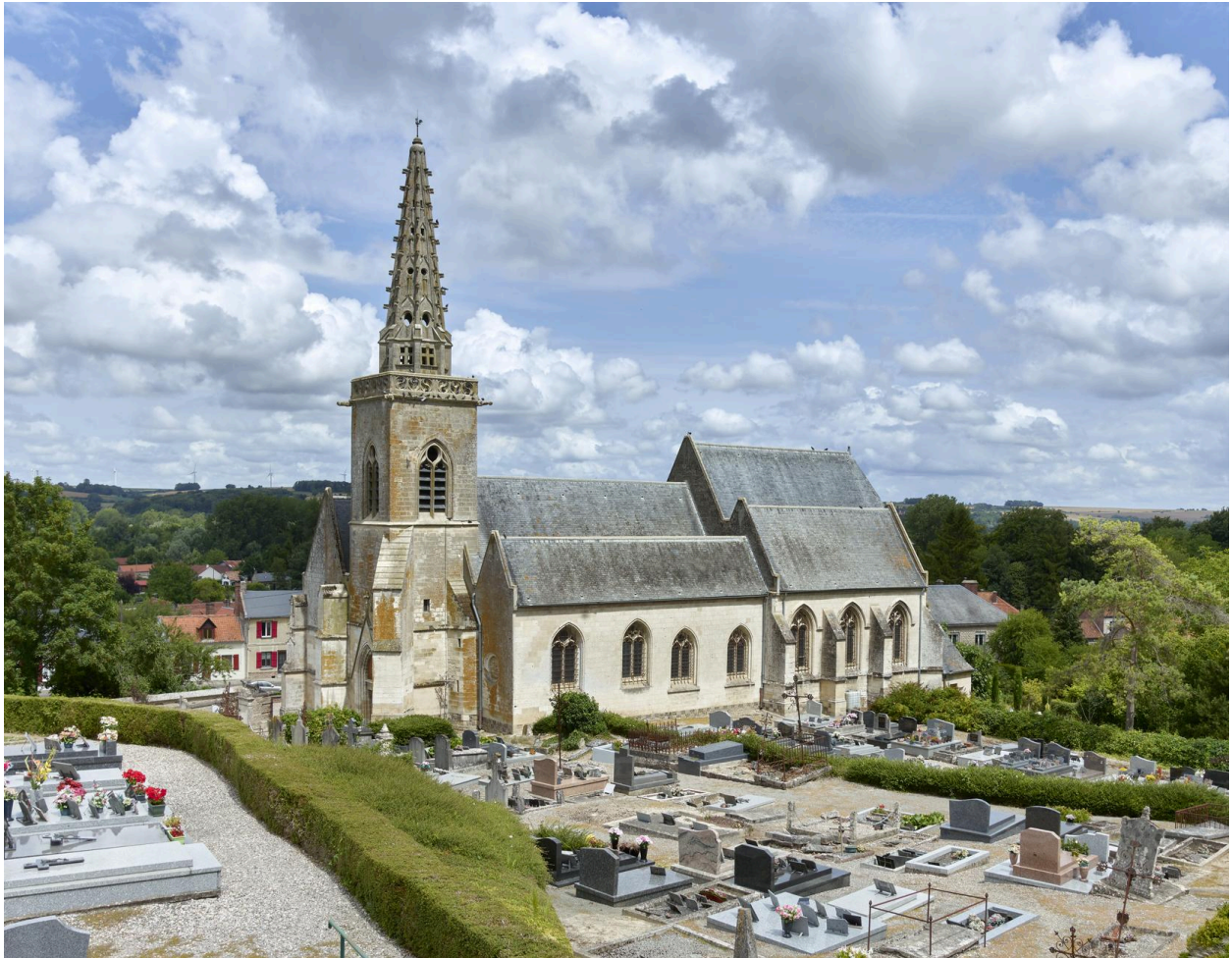
Église Saint-Riquier de Fontaine-sur-Somme, vue prise depuis le cimetière.