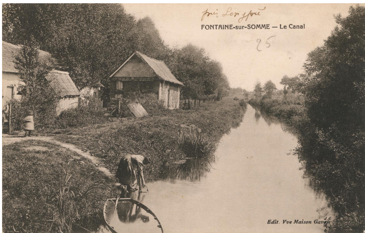
Fontaine-sur-Somme, le canal. Carte postale, [ca 1905] (coll. part.).