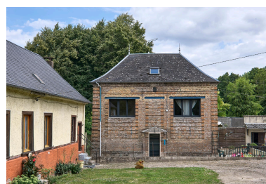
Ancienne école de Vieulaines, vue prise depuis l'ouest. IVR32_20238000468NUCA