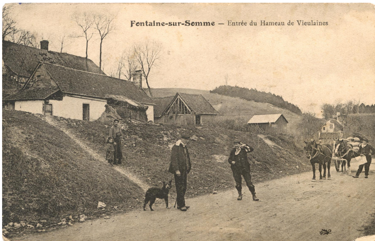
Fontaine-sur-Somme, entrée du hameau de Vieulaines, carte postale, [ca 1900].