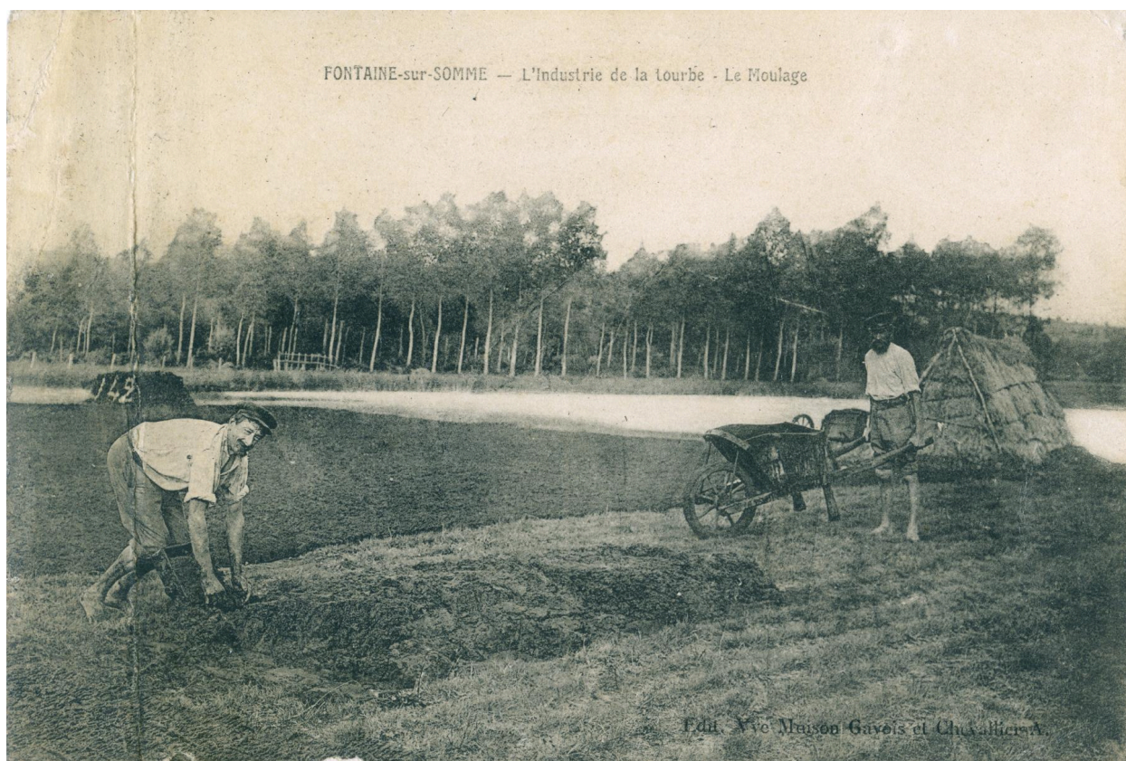
Fontaine-sur-Somme, l'industrie de la tourbe : le moulage, carte postale, [ca 1905].