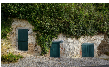
Entrées des anciennes carrières, rue de la Motte.