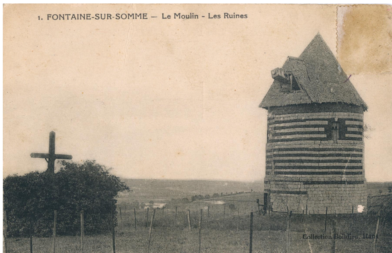
Fontaine-sur-Somme. Le moulin, les ruines, carte postale, Boildieu-Hans éditeur, [s.d.] (coll. part.).