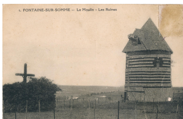
Fontaine-sur-Somme. Le moulin, les ruines, carte postale, Boildieu-Hans éditeur, [s.d.] (coll. part.). IVR32_20238000287NUCA