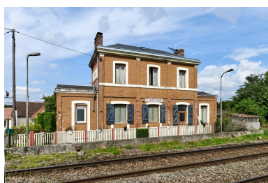
Ancienne gare de Fontaine-sur-Somme, vue prise depuis le sud. IVR32_20238000549NUCA