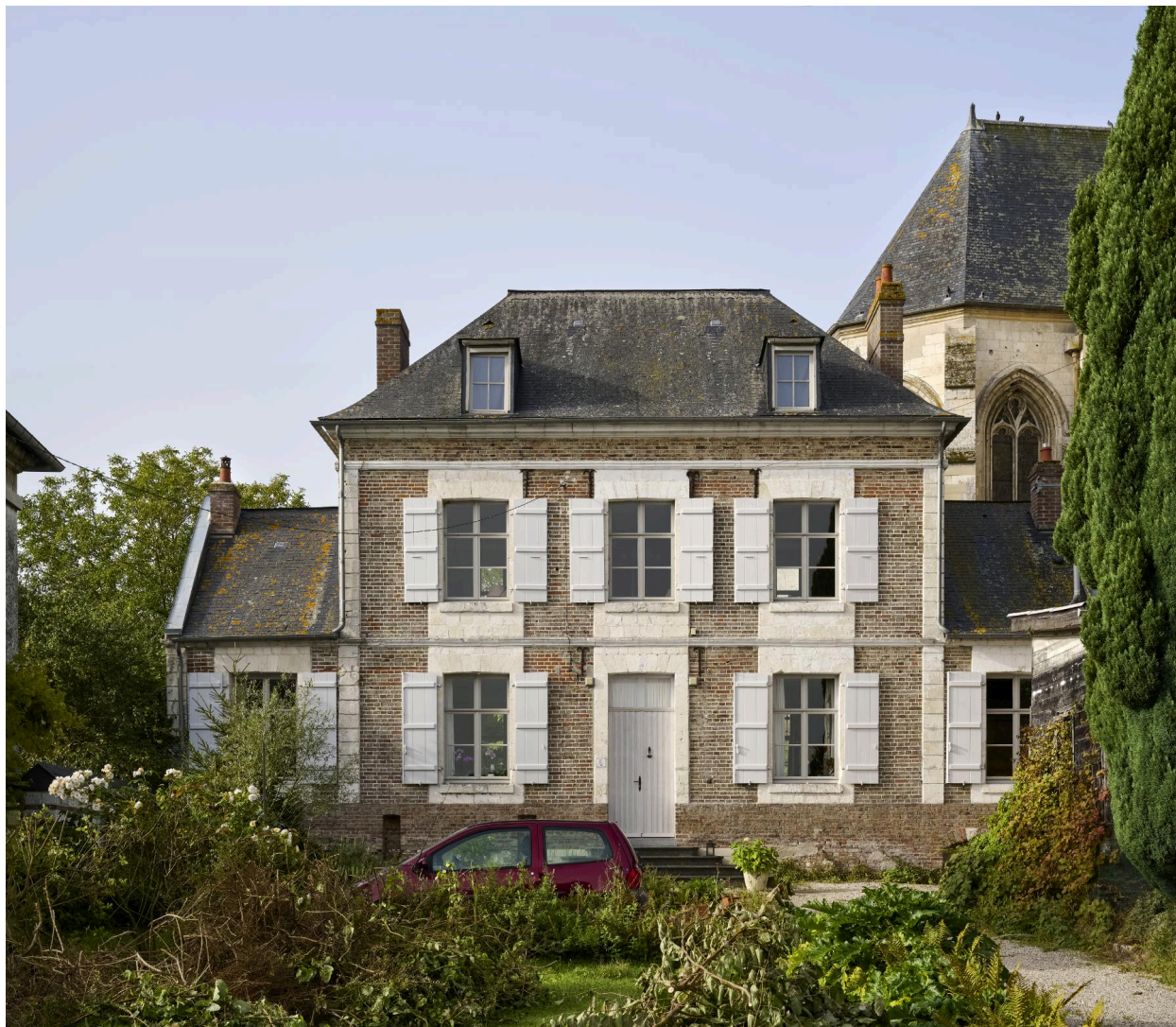
Exemple de maison bourgeoise XIXe siècle, 7 rue de Haut. Vue prise depuis le nord.