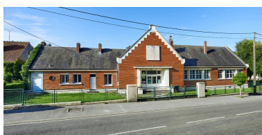
École de Fontaine-sur-Somme, vue prise depuis le nord. IVR32_20238000550NUCA