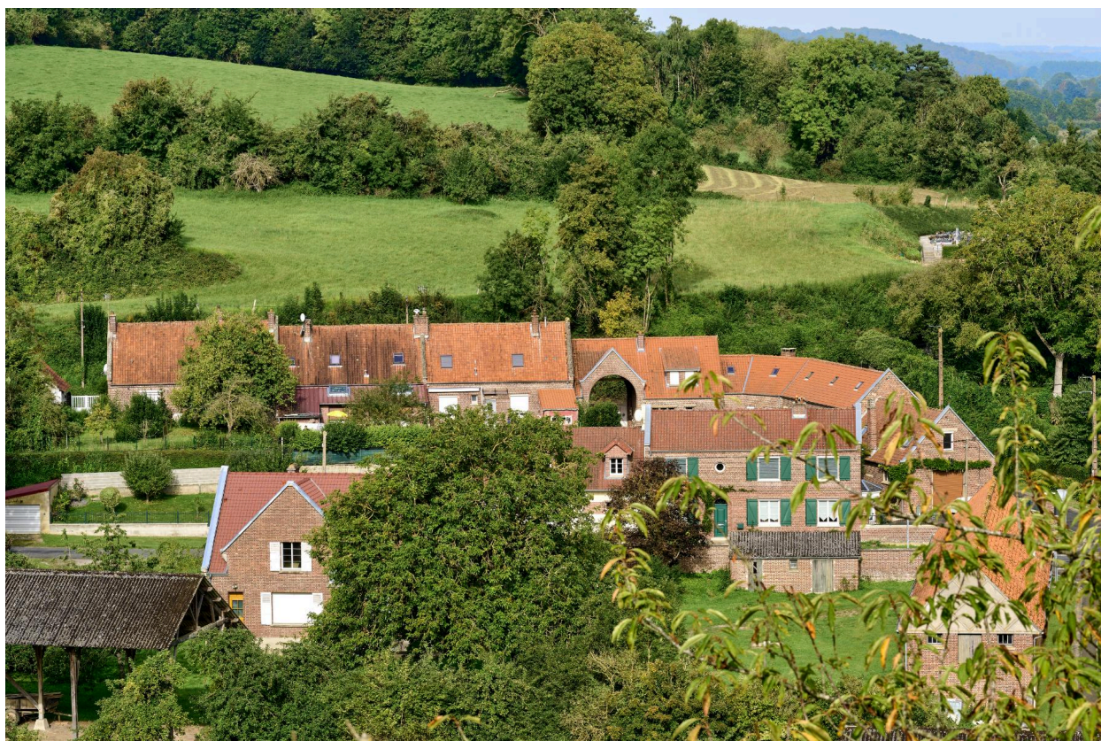
Édifice de la Seconde Reconstruction dans les rues de la Motte et de Sorel. Vue prise depuis le chemin Neuf.