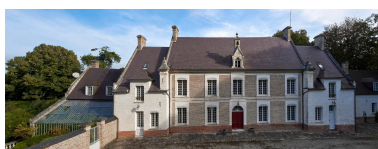
Château de Vieulaines, vue prise depuis le sud. IVR32_20238000492NUCA