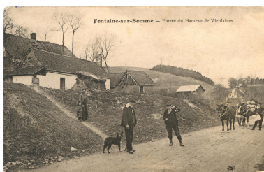
Fontaine-sur-Somme, entrée du hameau de Vieulaines, carte postale, [ca 1900] (coll. part.). IVR32_20238000291NUCA