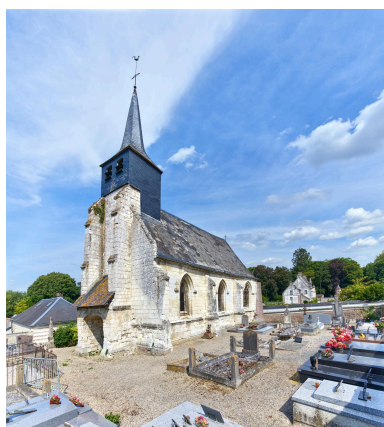
Église Notre-Dame de l'Assomption de Vieulaines, vue prise depuis le sud-ouest.