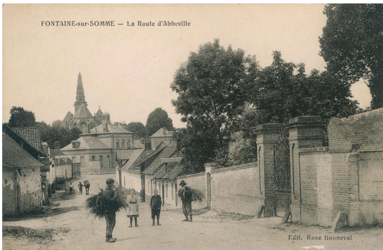
Fontaine-sur-Somme, la route d'Abbeville, carte postale, édit. Rose Bonneval, [ca 1910] (coll. part.).