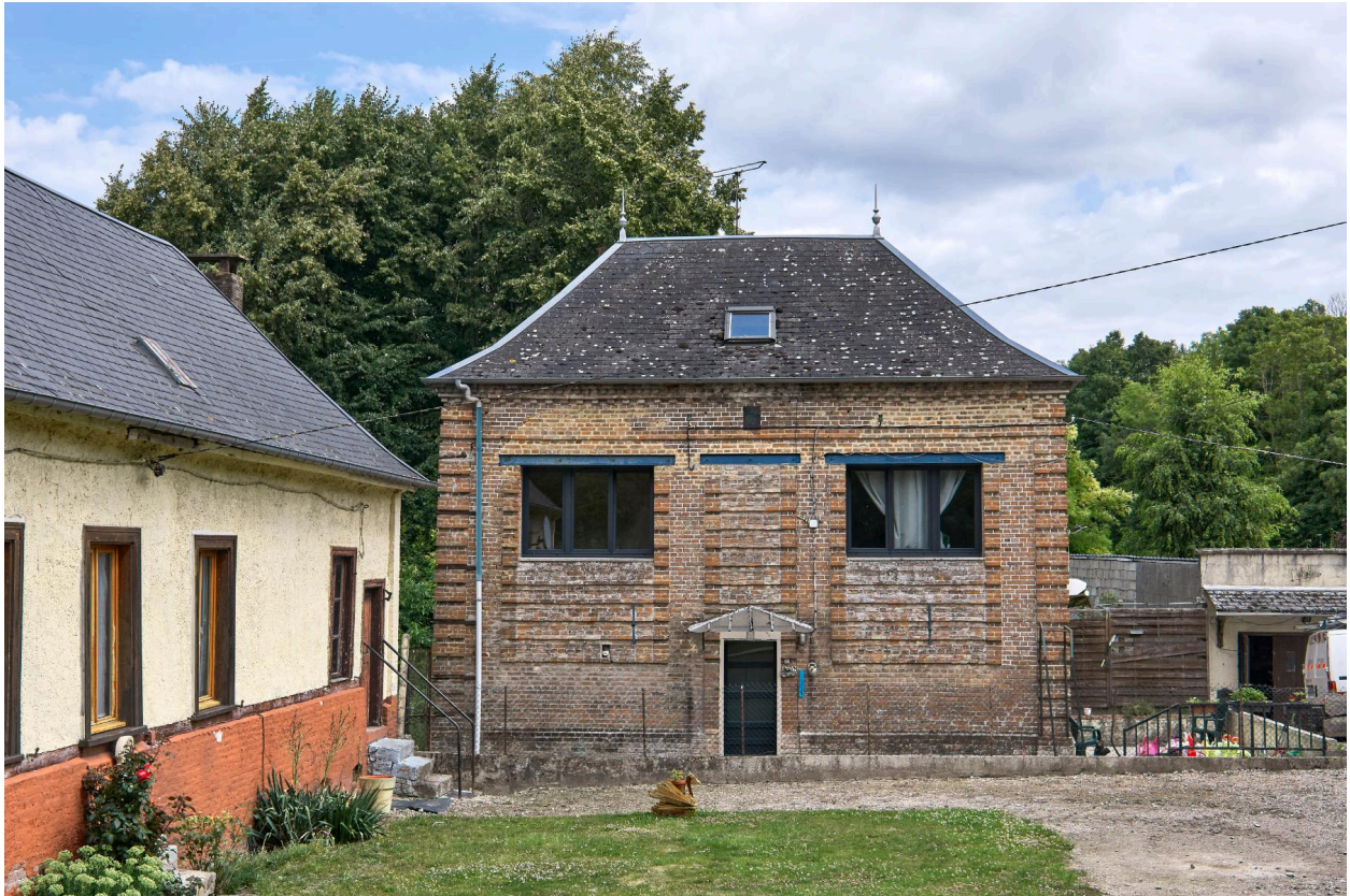
Ancienne école de Vieulaines, vue prise depuis l'ouest.