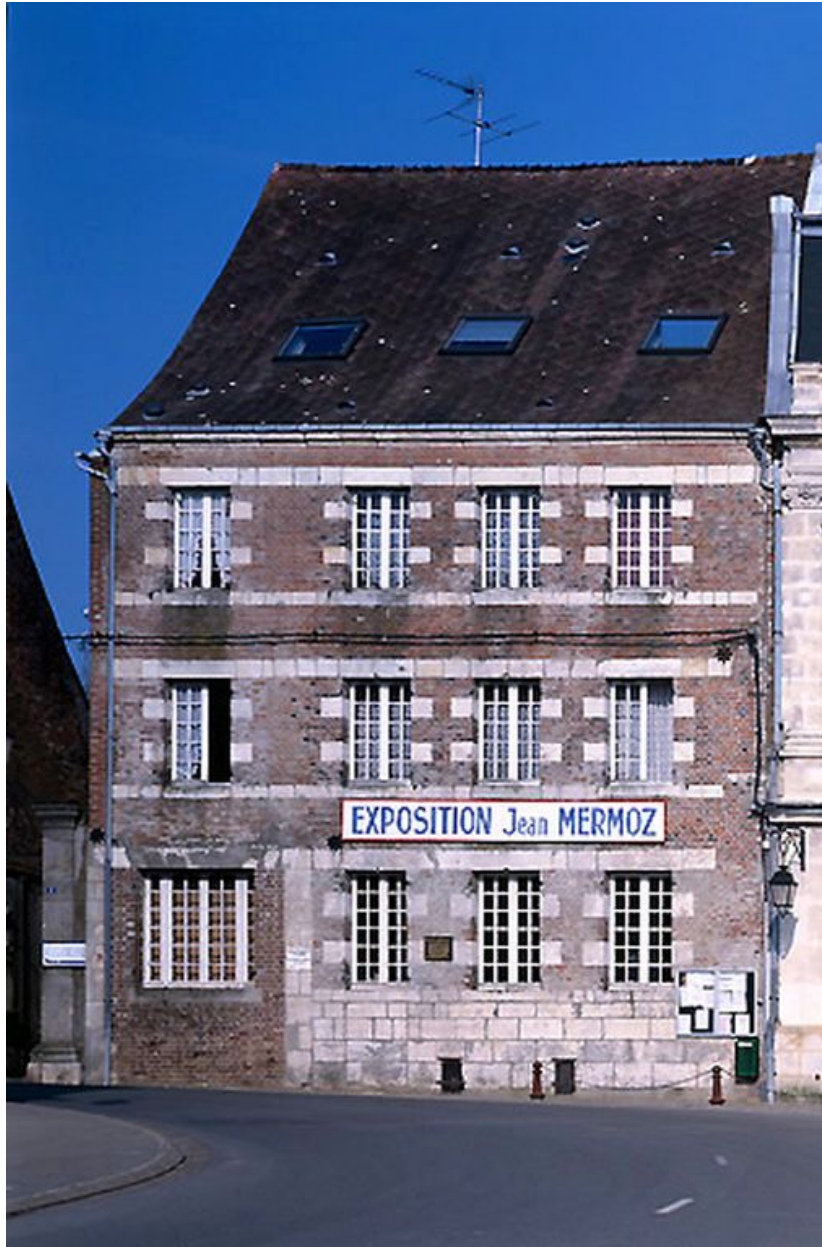
Elévation sur rue.