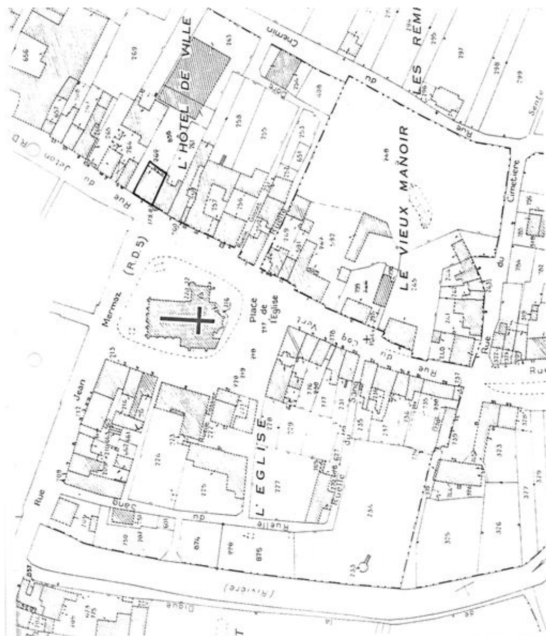
Plan de situation. Extrait du plan cadastral de 1986, section B.