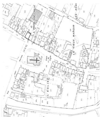
Plan de situation. Extrait du plan cadastral de 1986, section B.

IVR22_20080290204NUCA