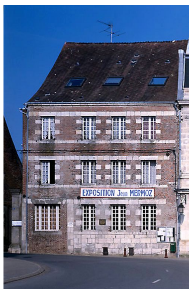
Elévation sur rue.

IVR22_20080290204NUCA