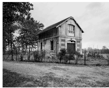
La conciergerie, vue depuis l'est. IVR22_19900201984V

Carte postale éditée entre les deux guerres, représentant la façade occidentale du château (AD Aisne : 18 Fi Coyolles). IVR22_19880201935XB