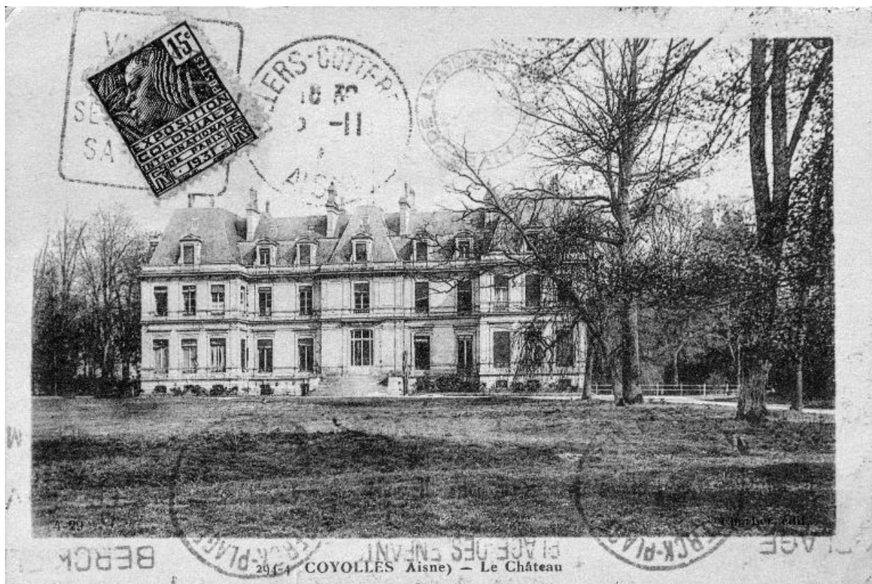
Carte postale éditée entre les deux guerres, représentant la façade occidentale du château (AD Aisne : 18 Fi Coyolles).