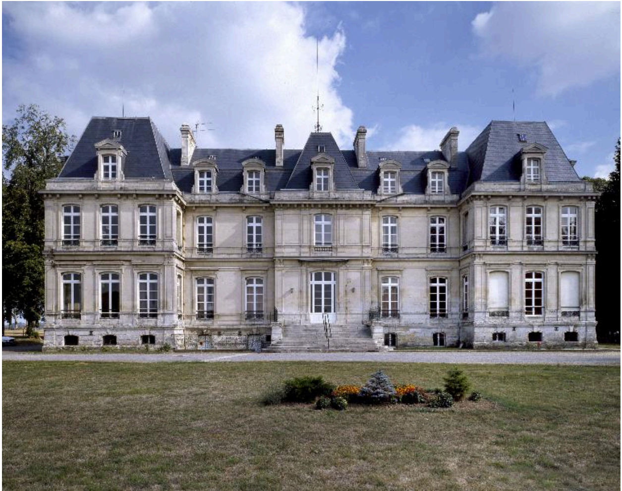
Vue de la façade occidentale.