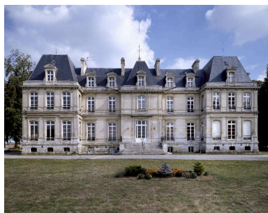
Vue de la façade occidentale.

Carte postale éditée au début du 20e siècle, montrant une vue ouest du château (coll. part.).