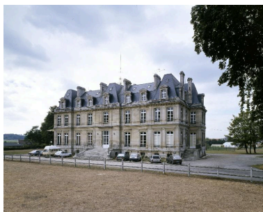
Vue de la façade orientale.

Carte postale éditée au début du 20e siècle, représentant une vue sud-est du château au milieu de son parc (coll. part.).