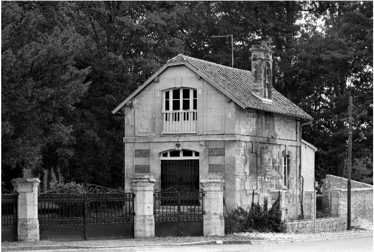
La conciergerie, vue depuis le nord.