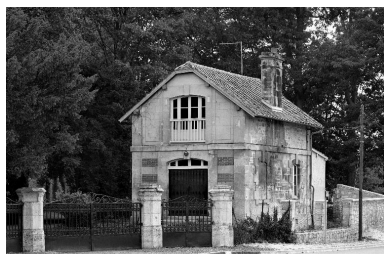
La conciergerie, vue depuis le nord. IVR22_19900201992X