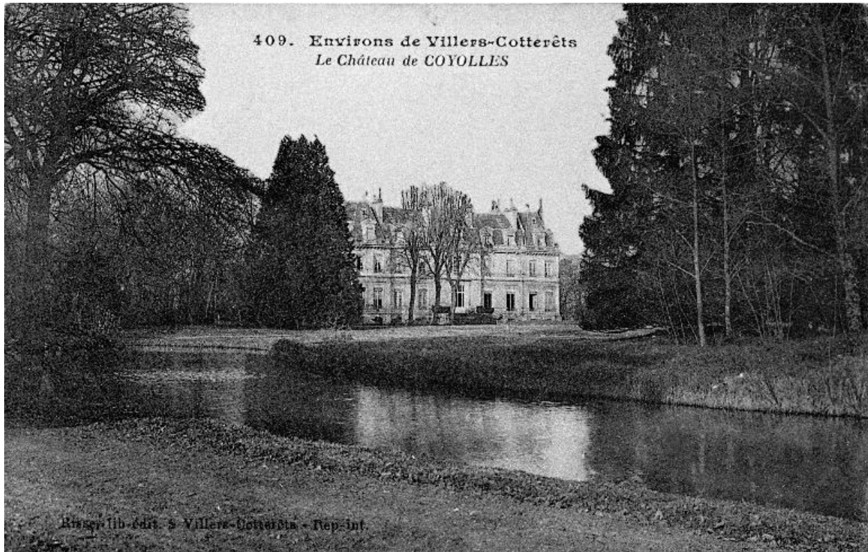
Carte postale éditée au début du 20e siècle, représentant une vue sud-est du château au milieu de son parc.