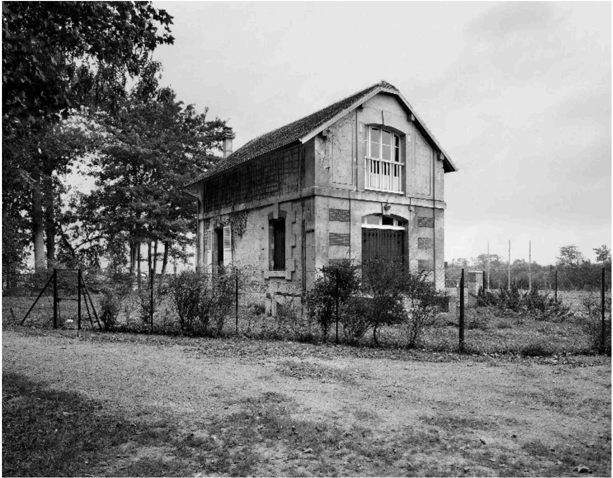
La conciergerie, vue depuis l'est.