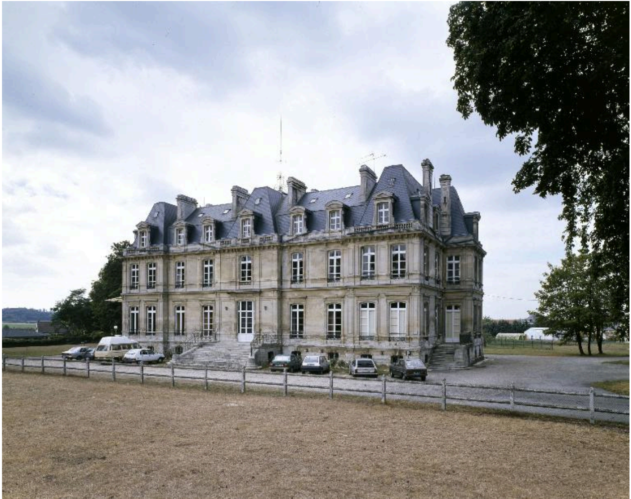
Vue de la façade orientale.