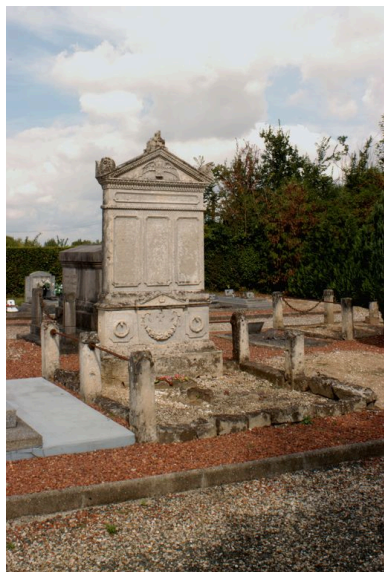
Vue générale. IVR22_20038000846NUCA