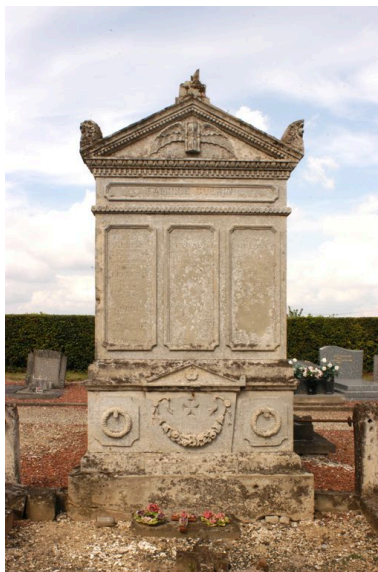
Vue de la stèle. IVR22_20038000847NUCA