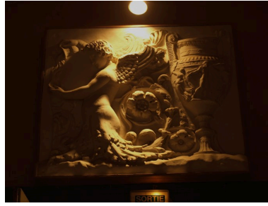
Vue générale IVR31_20106204465NUCA