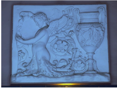
Vue générale IVR31_20106204464NUCA