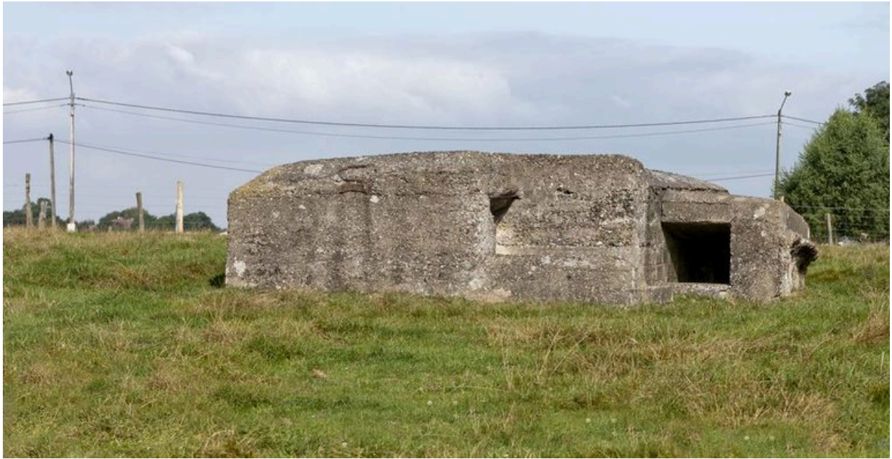
Vue vers le nord. En face l'ouverture du toboggan casematé