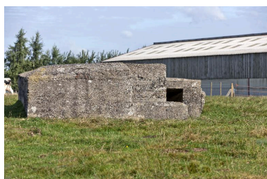
Vue longitudinale, vers le nord