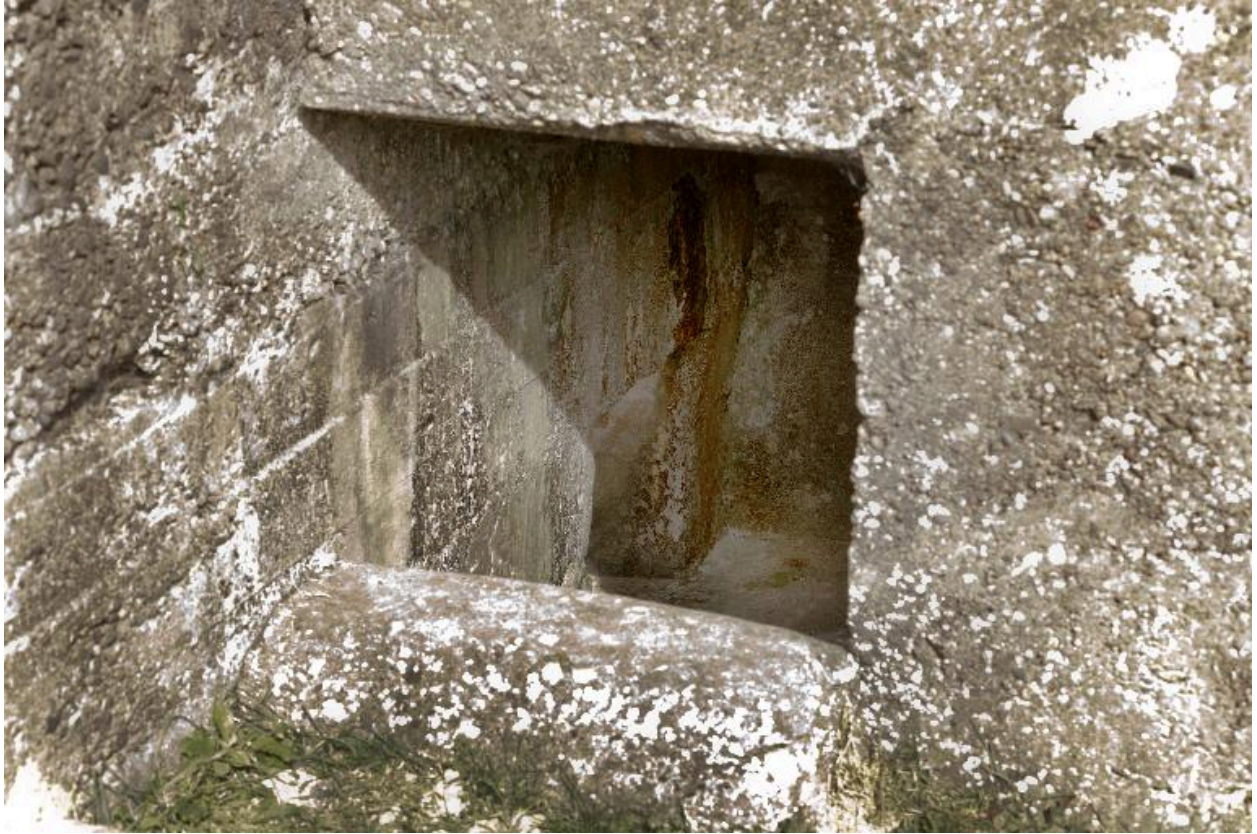
Elévation nord-est : Tobbogan