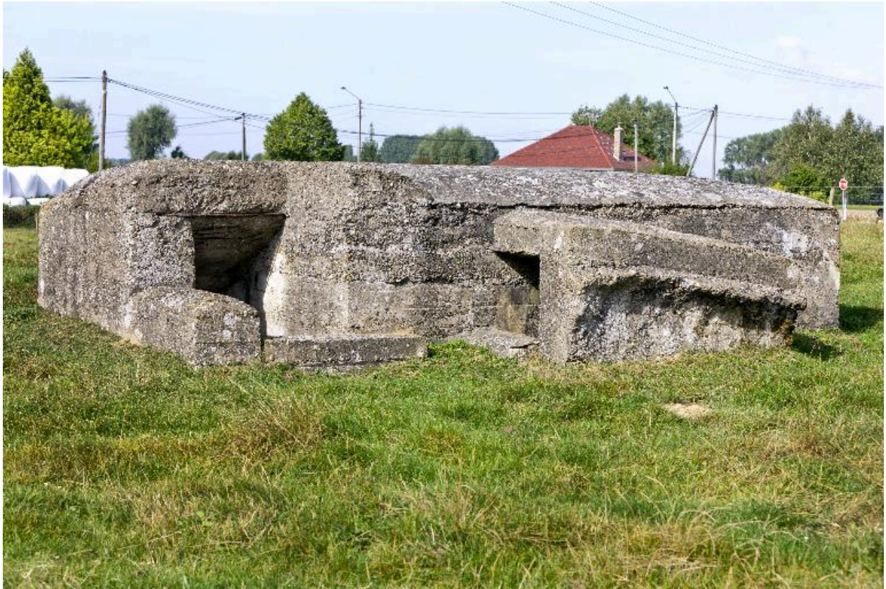
Vue vers le nord-ouest.