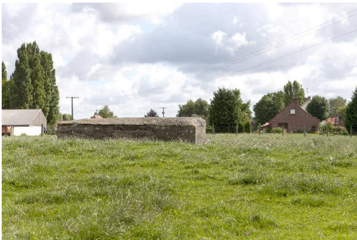
Vue vers l'est