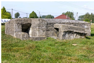
Vue vers le nord-ouest. IVR31_20145904606NUCA