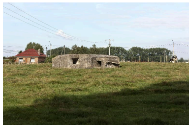
Vue générale vers le nord-ouest IVR31_20145904611NUCA