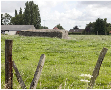
Vue vers l'est IVR31_20145904600NUCA