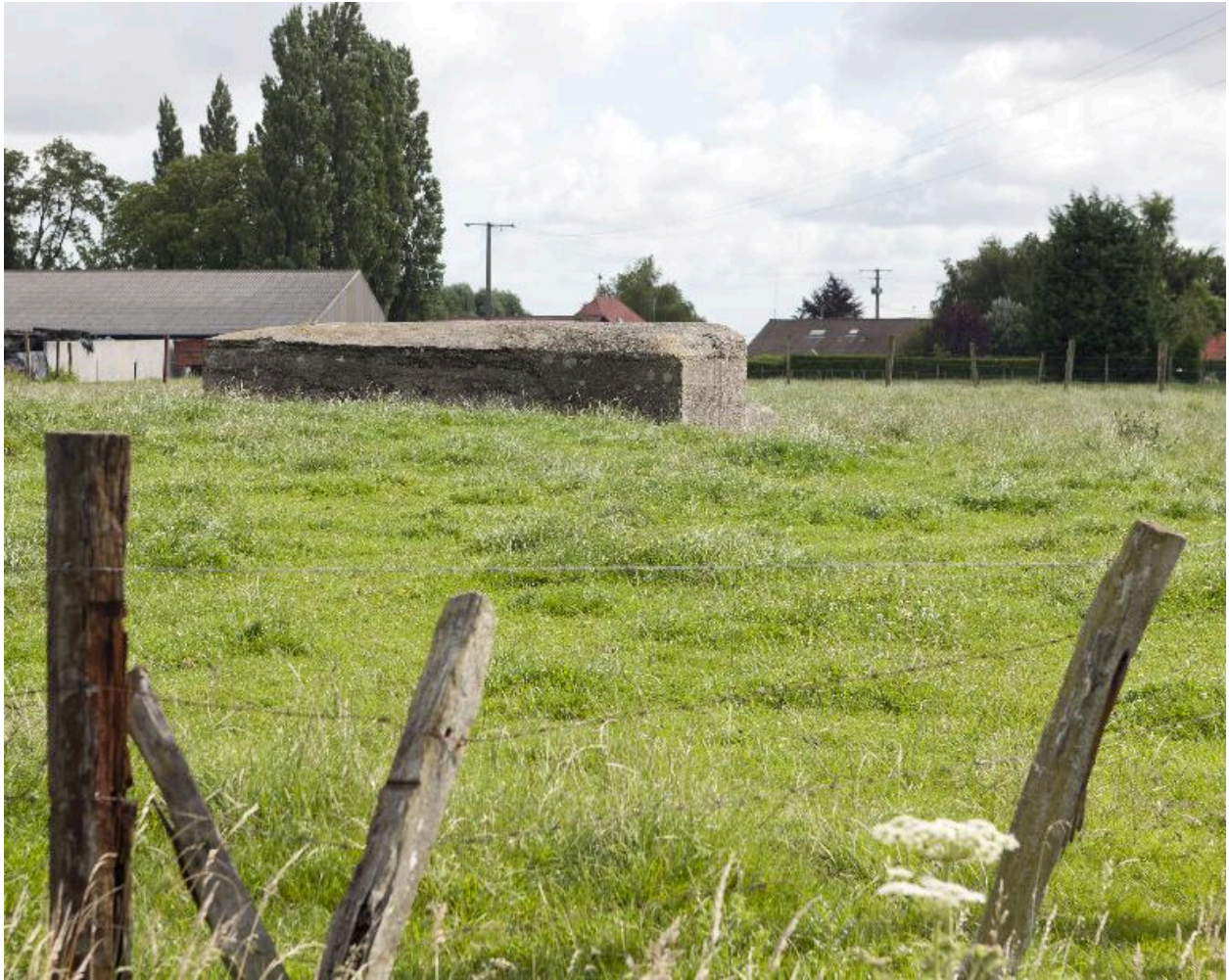
Vue vers l'est