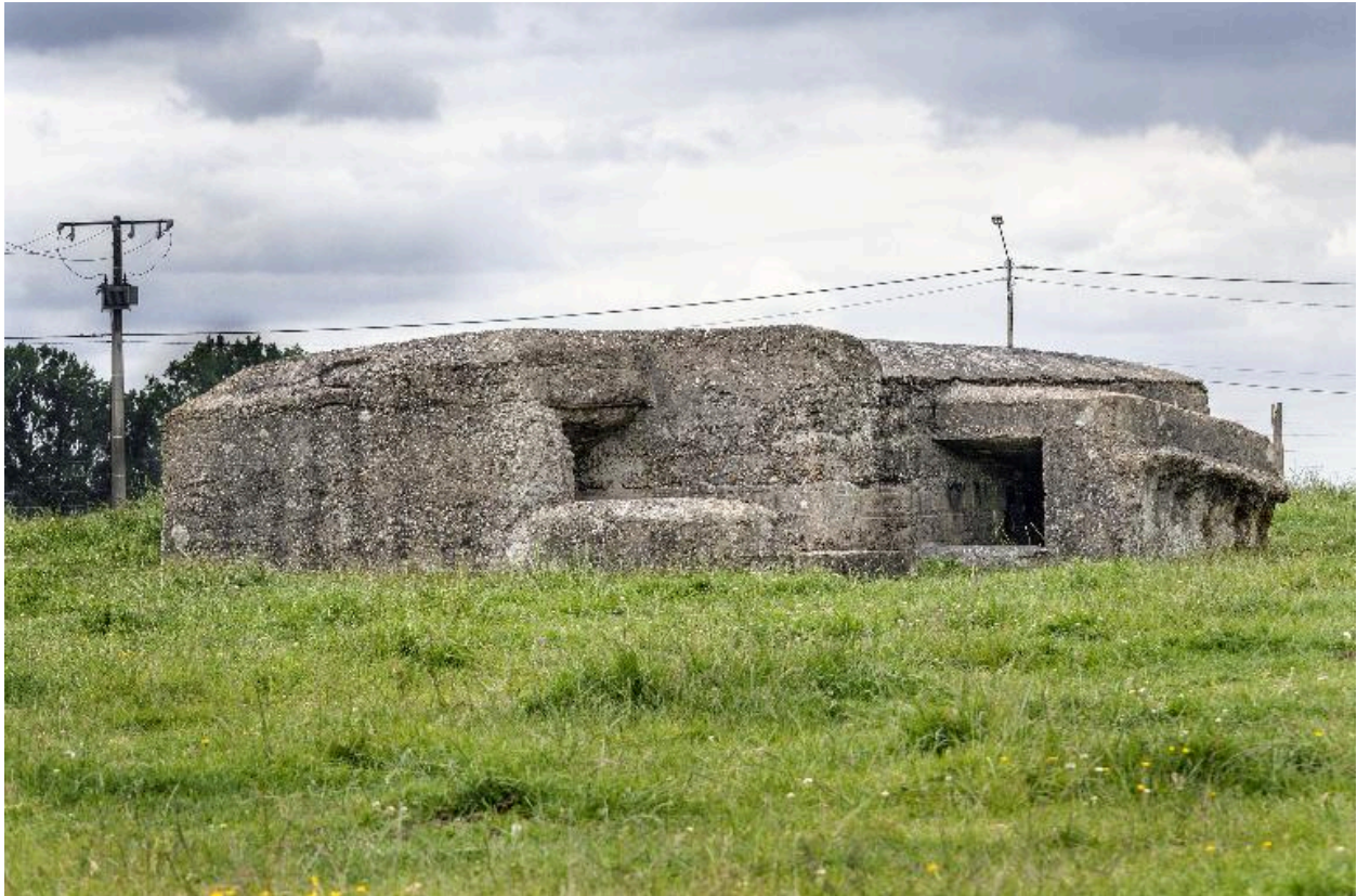
Vue vers le nord-est. Escalier d'entrée sur la partie gauche et toboggan pour la descente de caisses, sur la droite