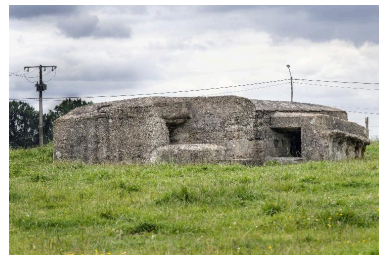
Vue vers le nord-est. Escalier d'entrée sur la partie gauche et toboggan pour la descente de caisses, sur la droite