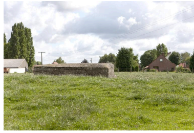
Vue vers l'est IVR31_20145904605NUCA