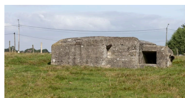
Vue vers le nord. En face l'ouverture du toboggan casematé