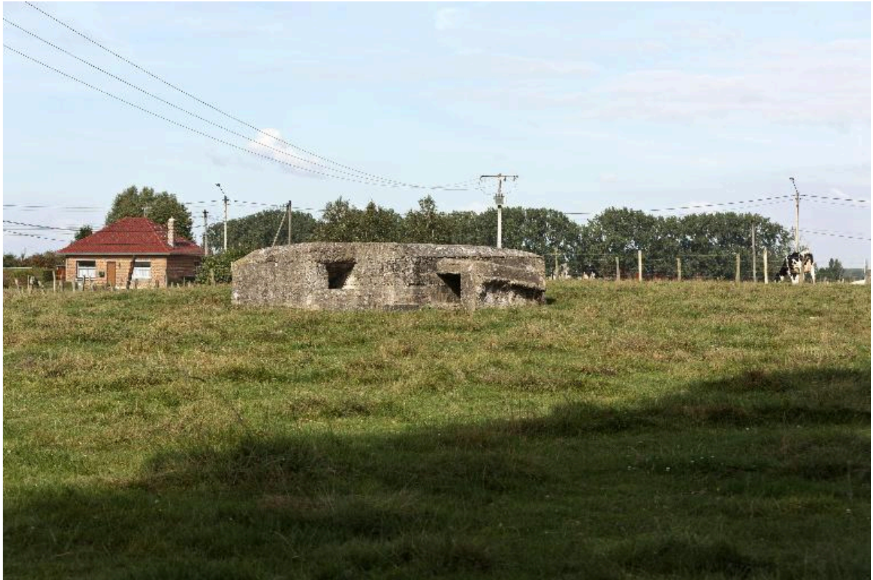
Vue générale vers le nord-ouest