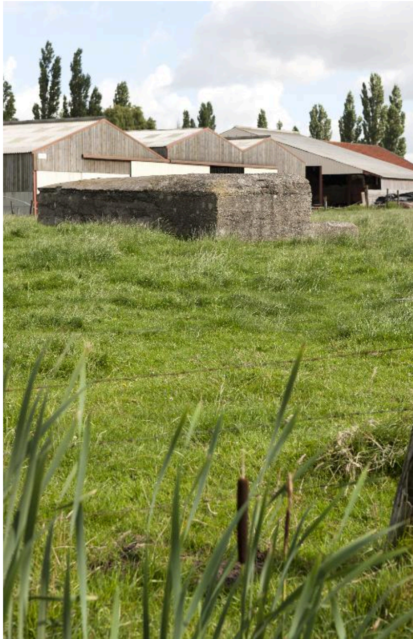
Vue vers le nord-est