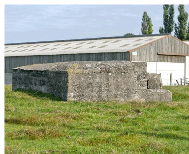
Vue vers le nord-est IVR31_20145904608NUCA