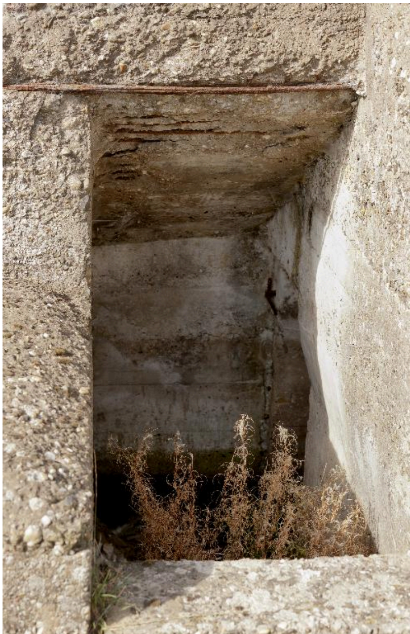
Escalier descendant dans l'abri