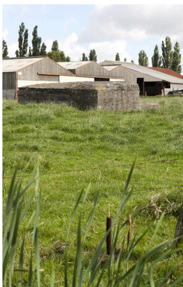
Vue vers le nord-est IVR31_20145904604NUCA