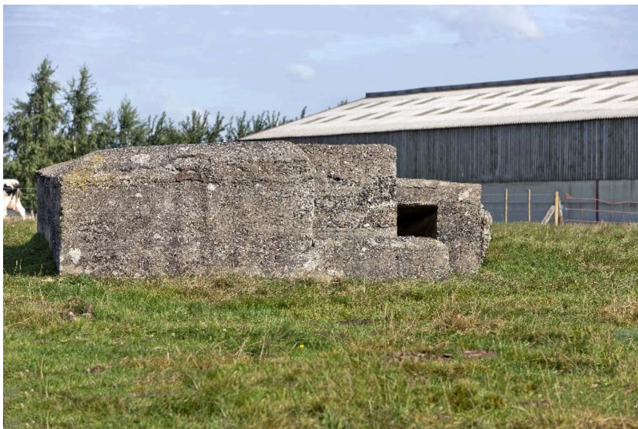
Vue longitudinale, vers le nord