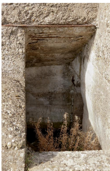
Escalier descendant dans l'abri