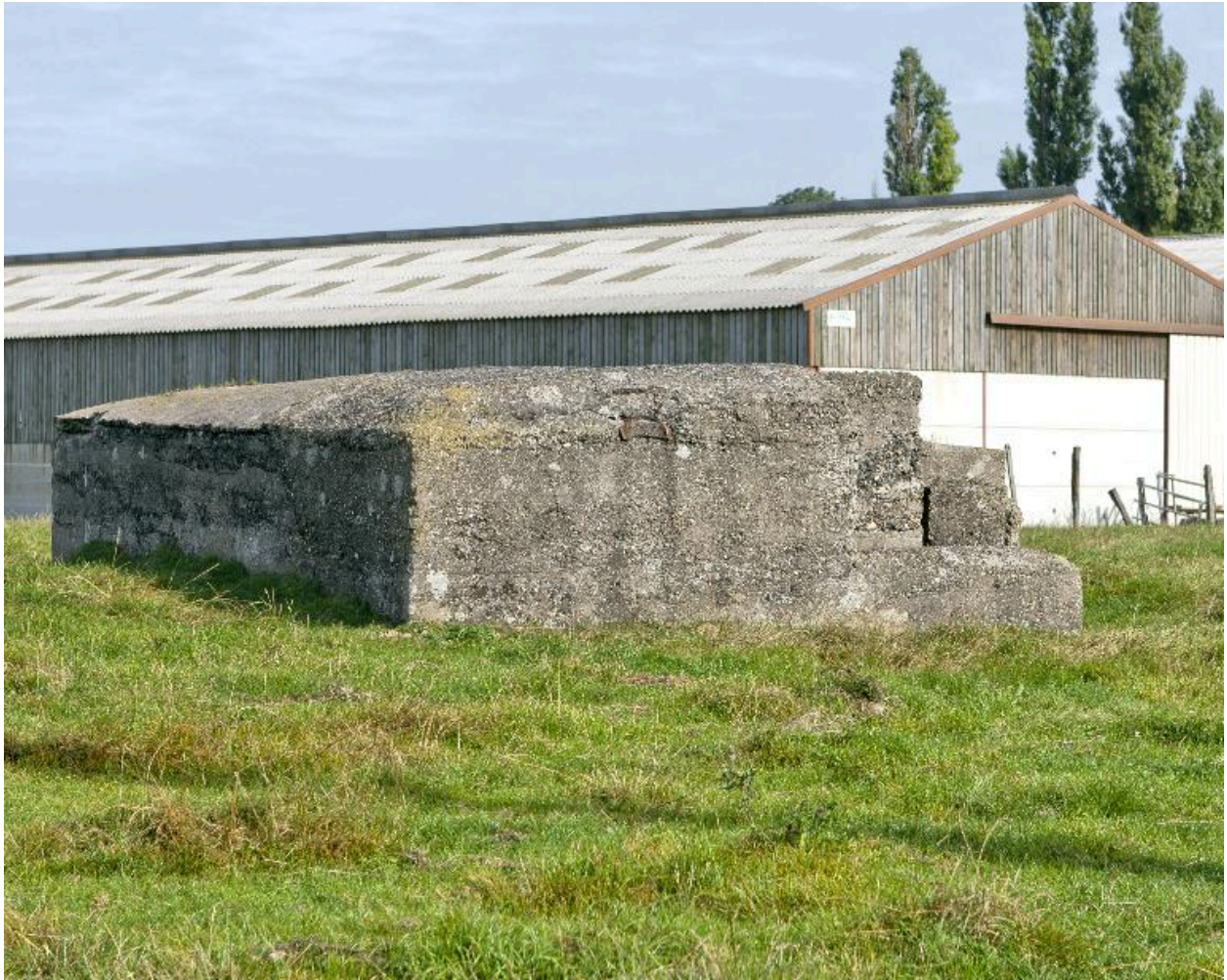
Vue vers le nord-est