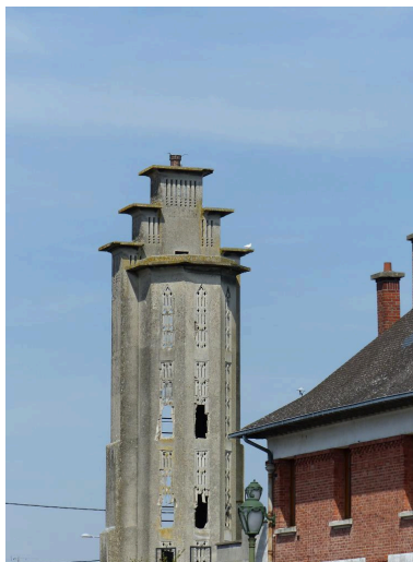
Vue de la partie supérieure de la tour et du réseau ajouré. IVR32_20170205618NUCA