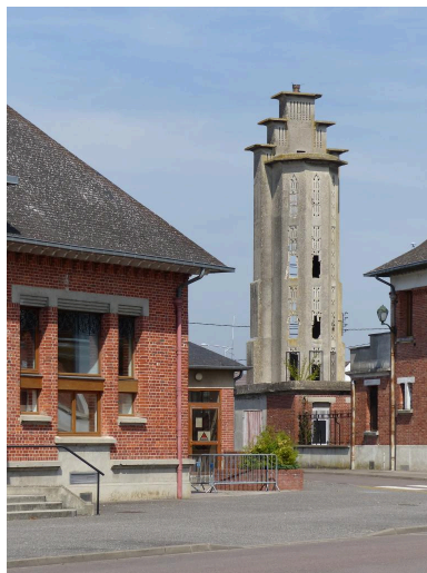
Vue de la tour.