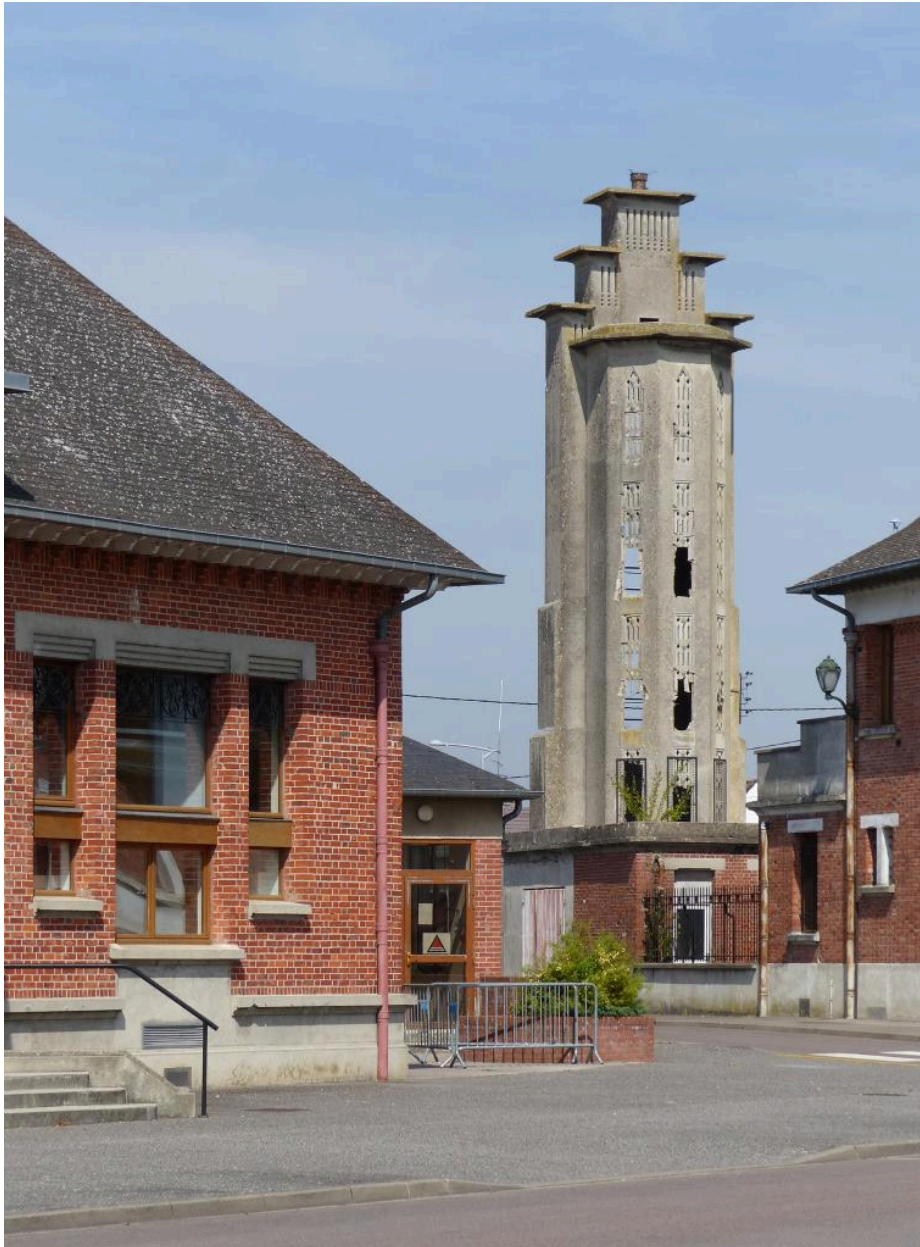
Vue de la tour.