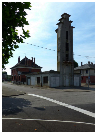
Vue de la remise et de la tour, depuis le nord.