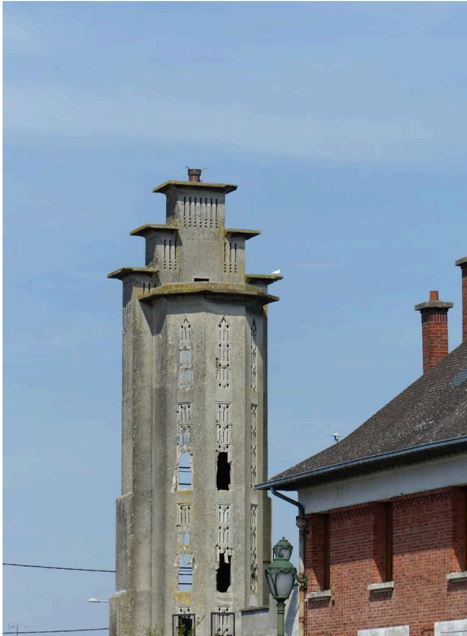
Vue de la partie supérieure de la tour et du réseau ajouré.