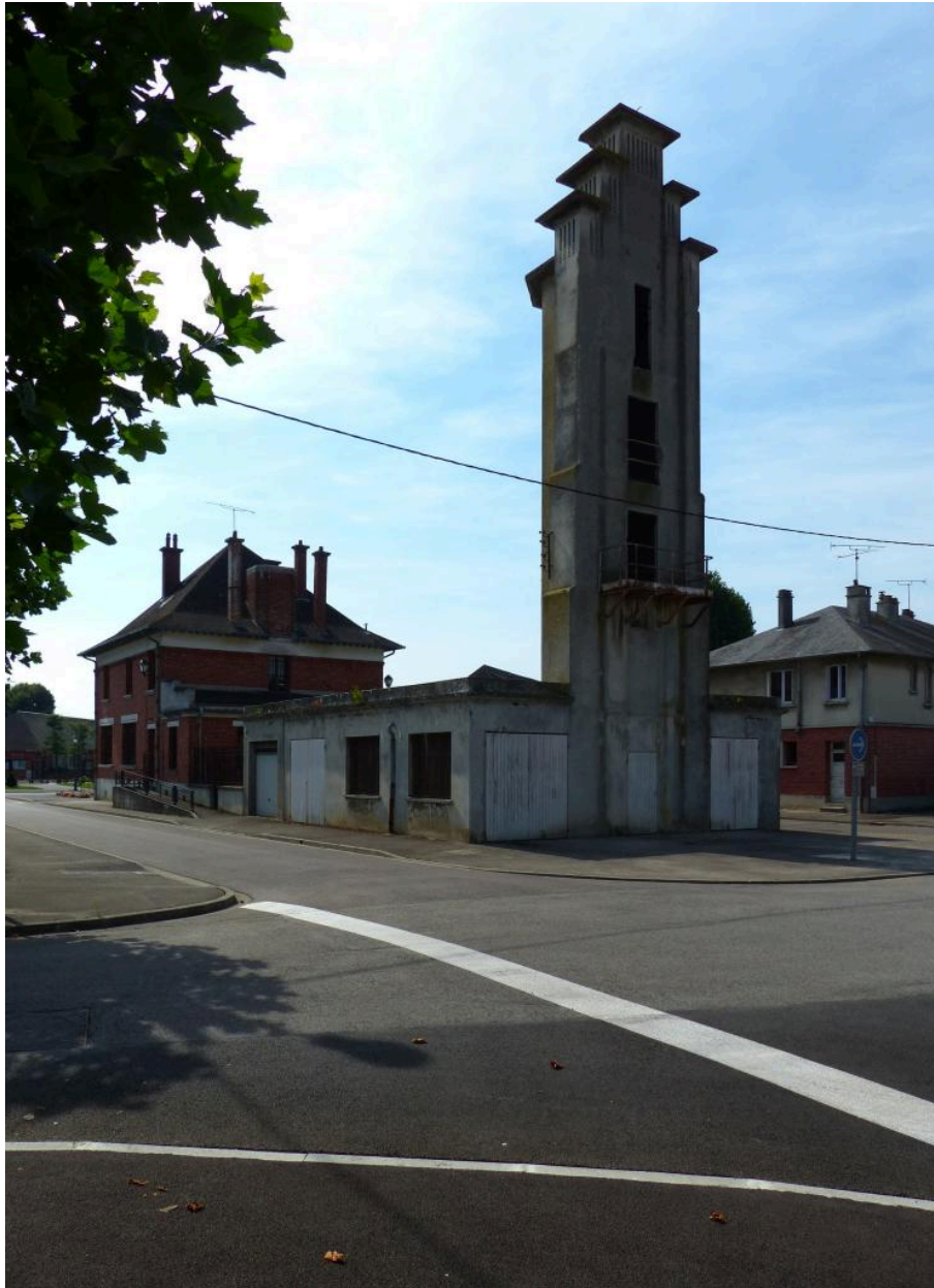
Vue de la remise et de la tour, depuis le nord.