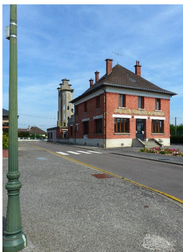
Vue générale. IVR32_20170205480NUCA