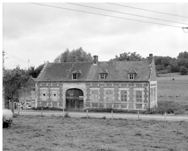
Logis. Vue d'ensemble.

Plan de situation. Extrait du plan cadastral de 1982, section ZC 24.