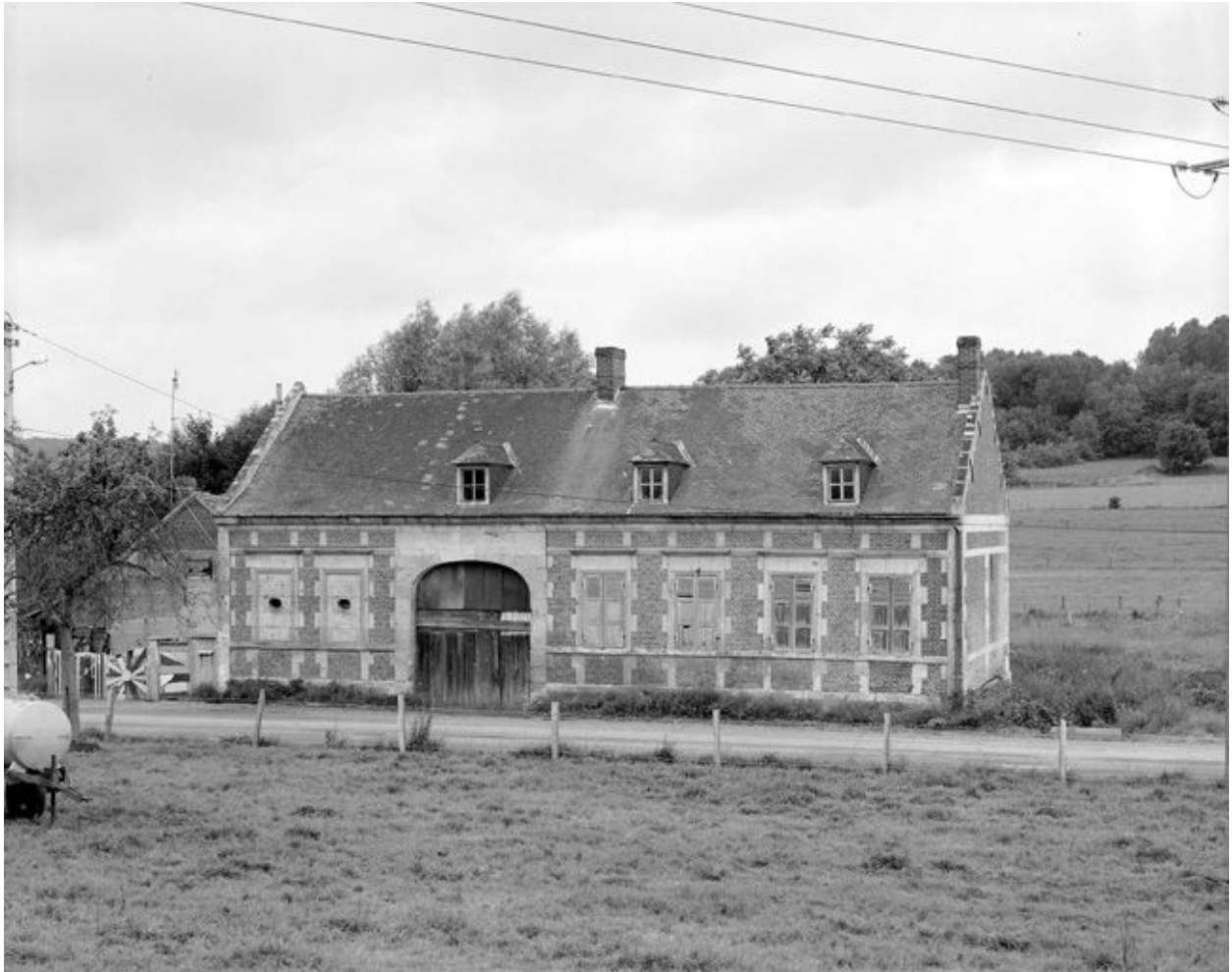
Logis. Vue d'ensemble.