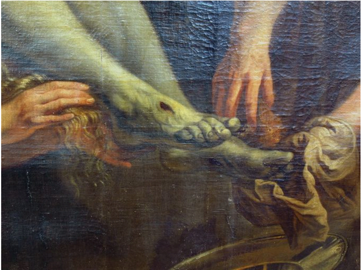
Vue de détail, pieds du Christ