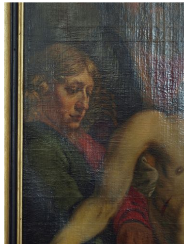
Vue de détail, saint Jean IVR31_20106203300NUCA