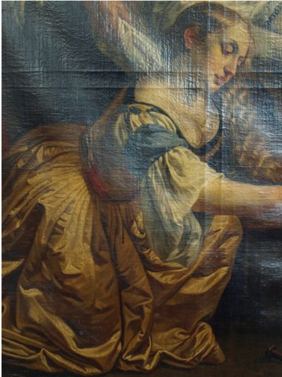
Vue de détail, sainte Marie-Madeleine