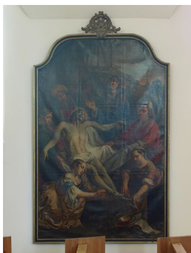
Vue générale