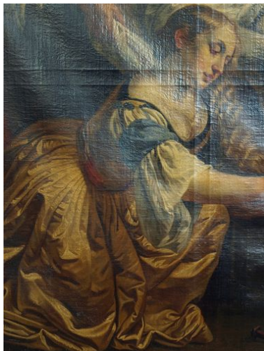
Vue de détail, sainte Marie-Madeleine IVR31_20106203301NUCA