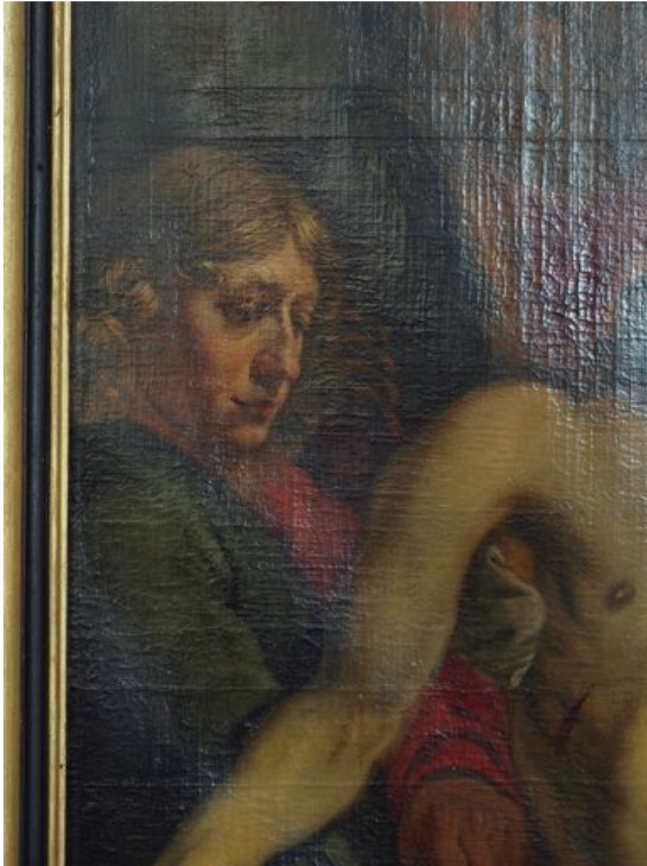
Vue de détail, saint Jean