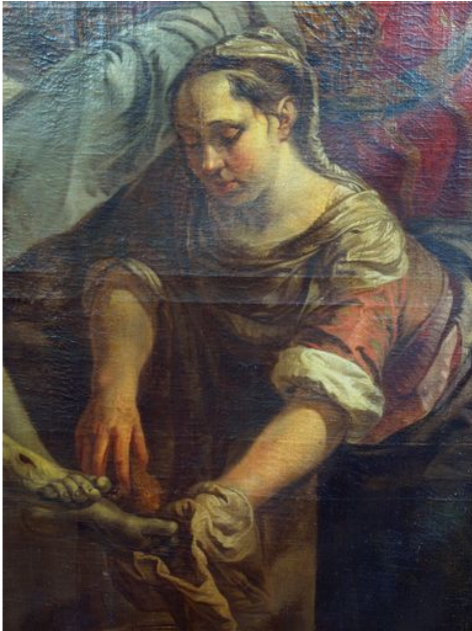
Vue de détail, sainte Marthe