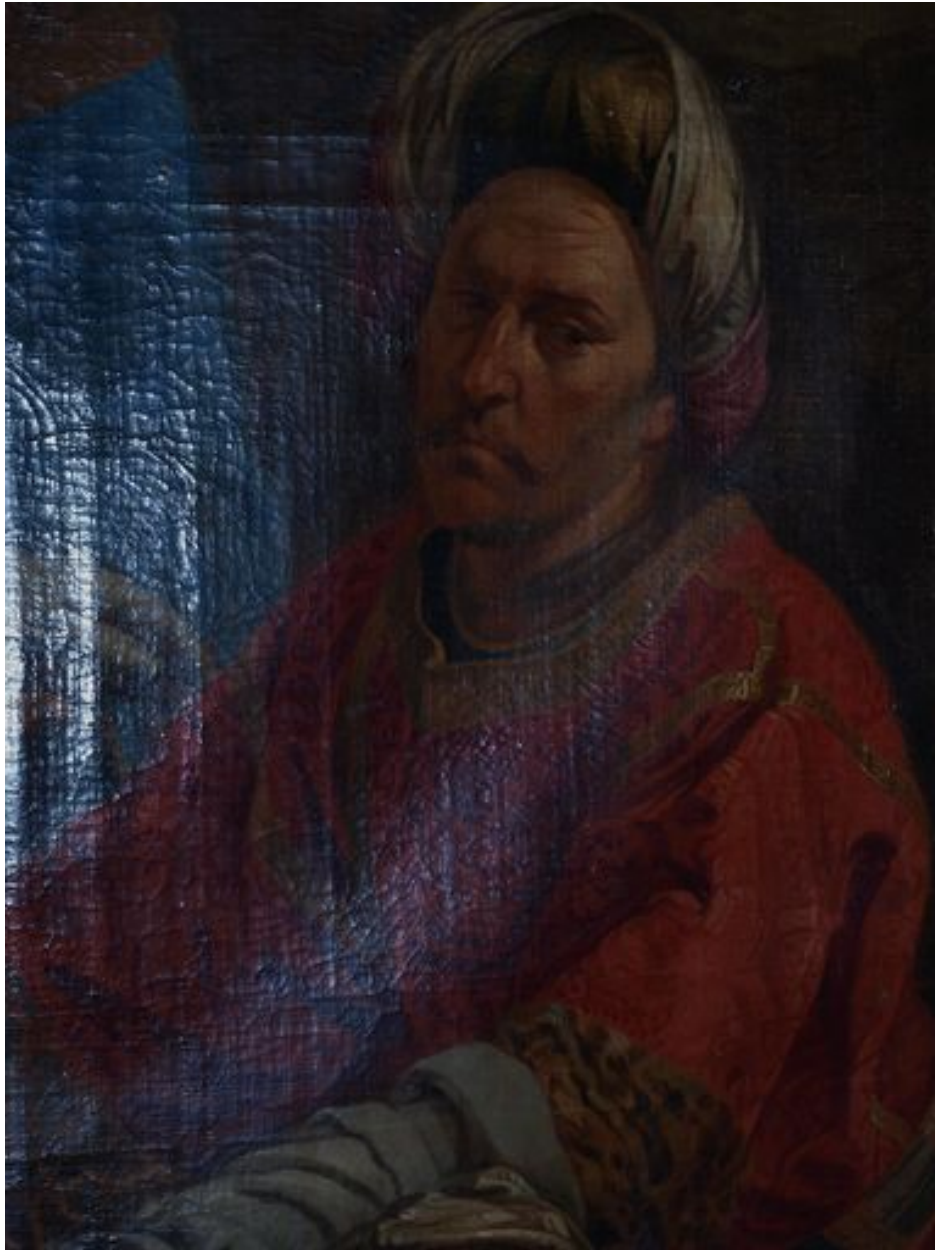
Vue de détail, Joseph d'Arimathe