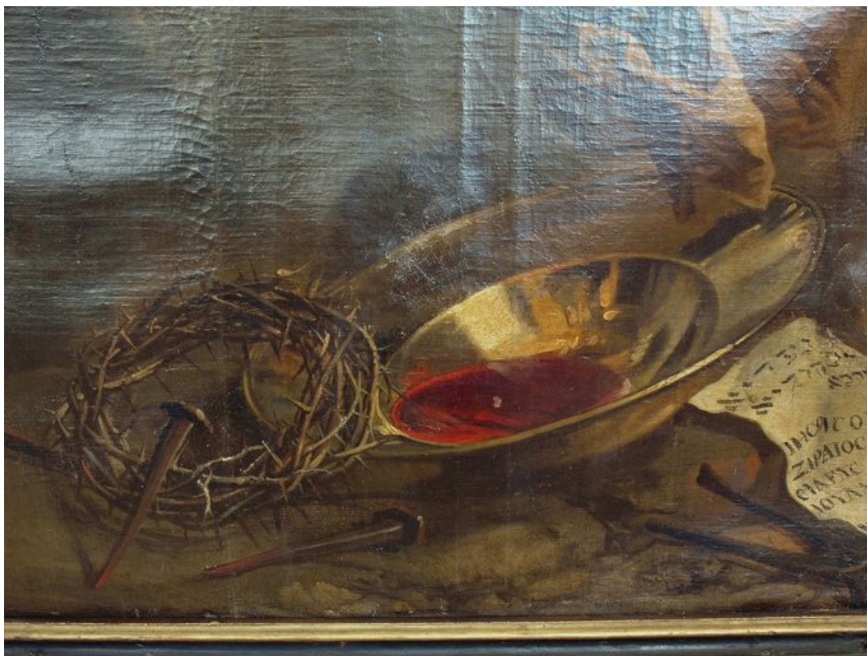
Vue de détail, instruments de la Passion