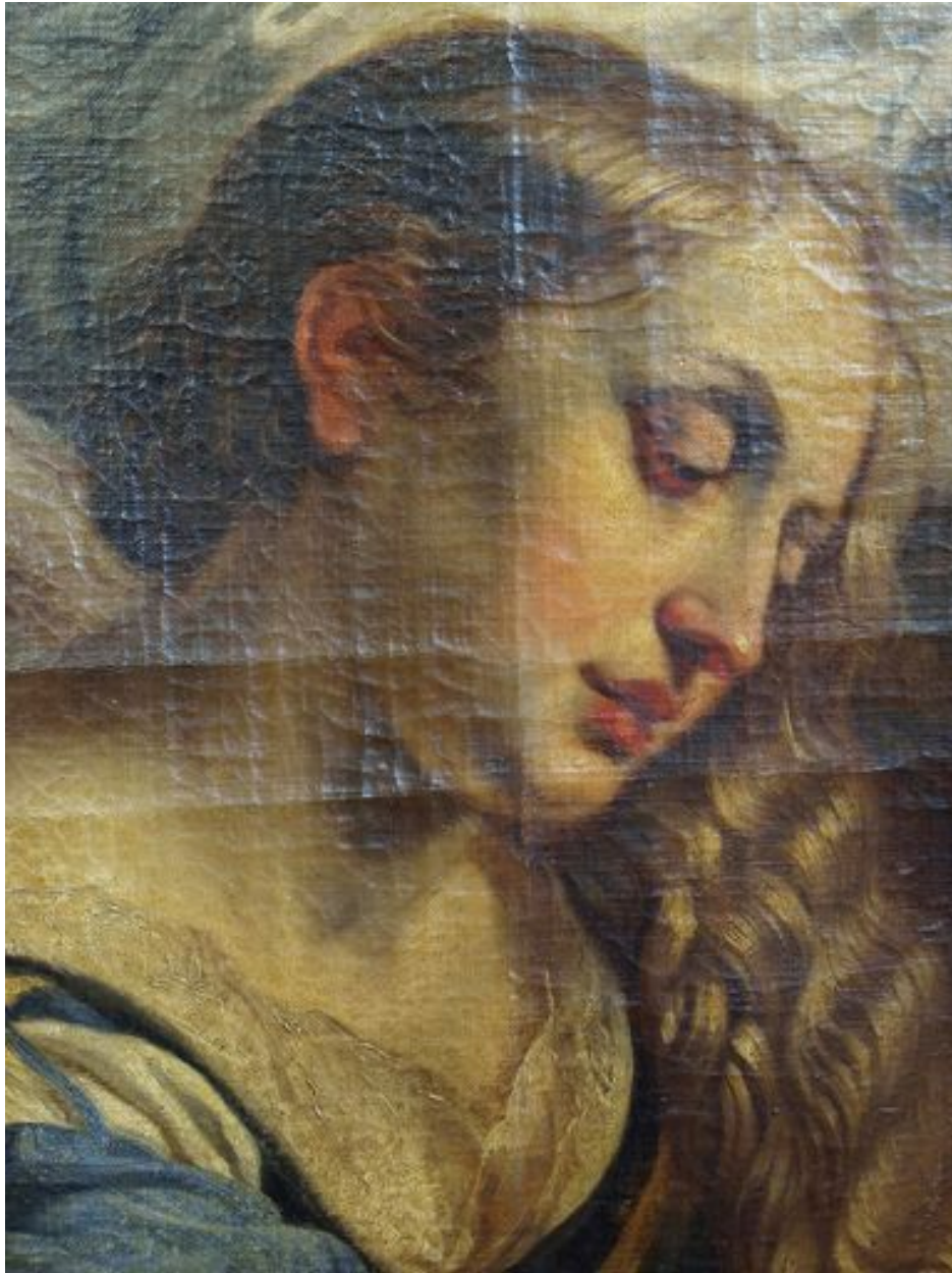
Vue de détail, visage de sainte Marie-Madeleine