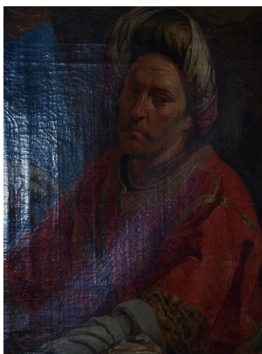
Vue de détail, Joseph d'Arimathe