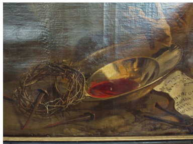
Vue de détail, instruments de la Passion IVR31_20106203297NUCA