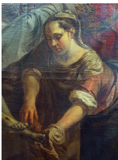
Vue de détail, sainte Marthe