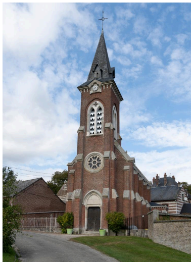
Vue générale depuis le sud. IVR32_20216000947NUCA