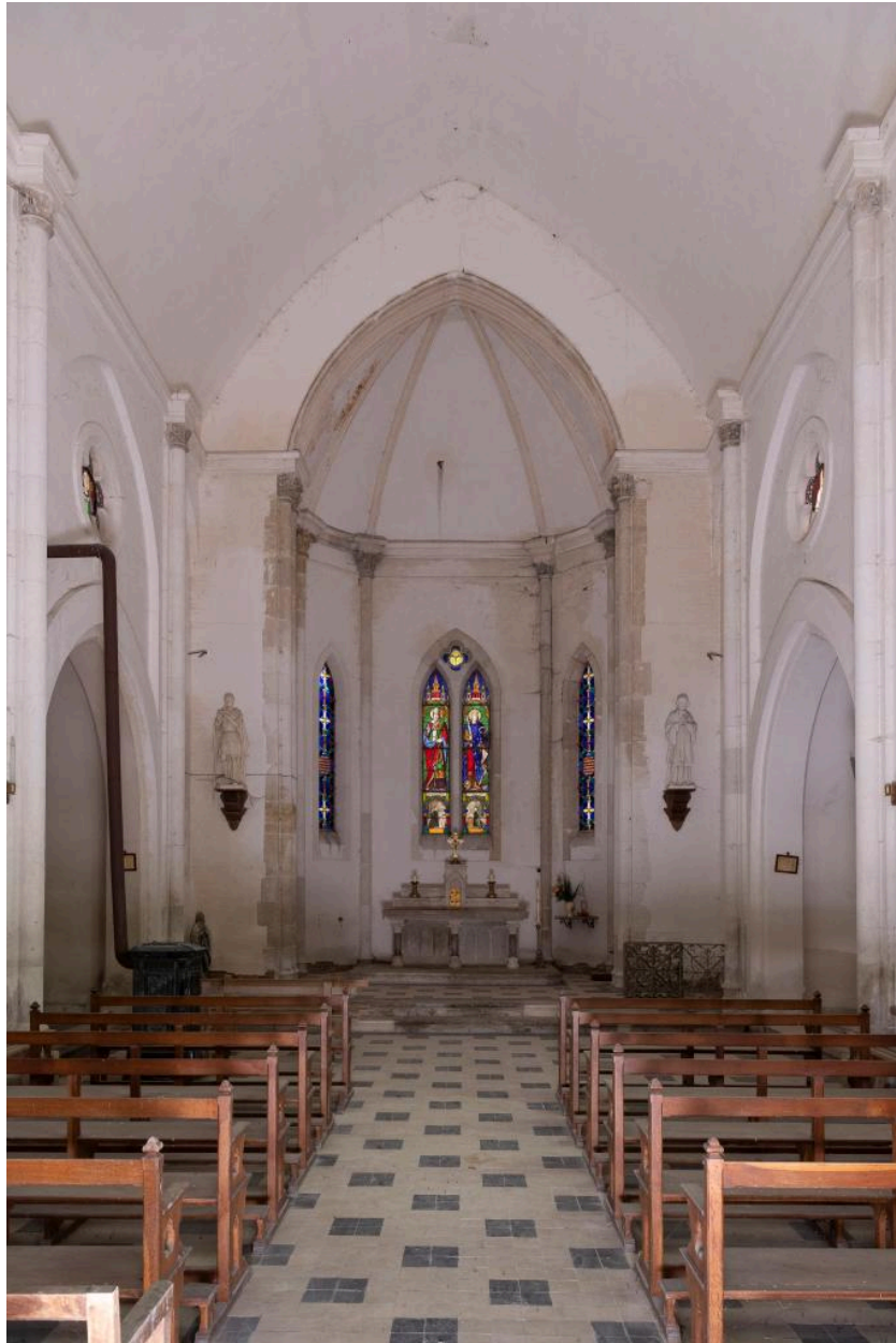
Vue intérieure vers le chœur.