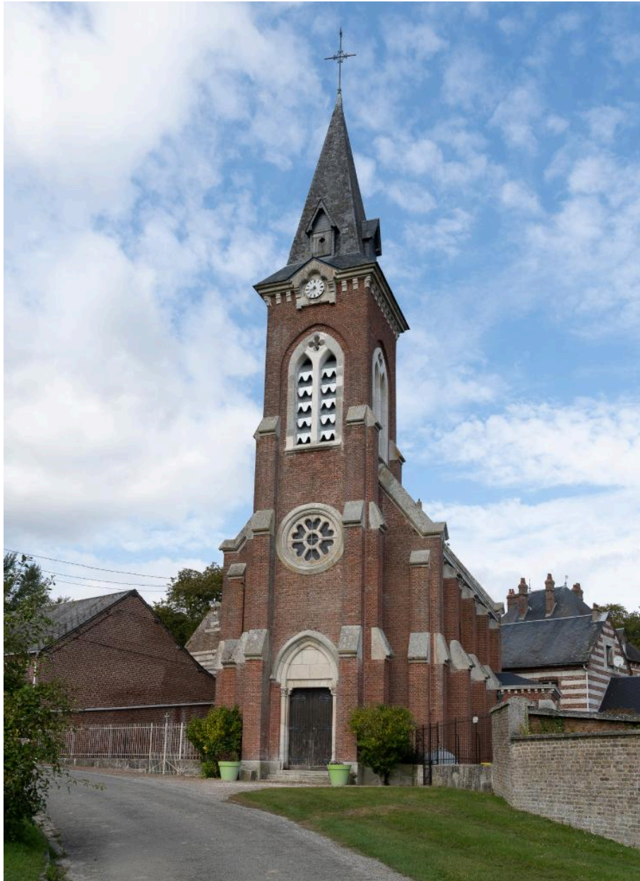
Vue générale depuis le sud.