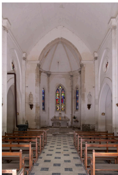
Vue intérieure vers le chœur. IVR32_20216001154NUCA