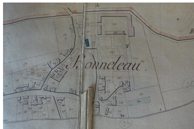
Bonneleau. Cadastre dit napoléonien, section A, feuille 2, 1833 (EDT 390/1 G 1). IVR32_20216005107NUCA