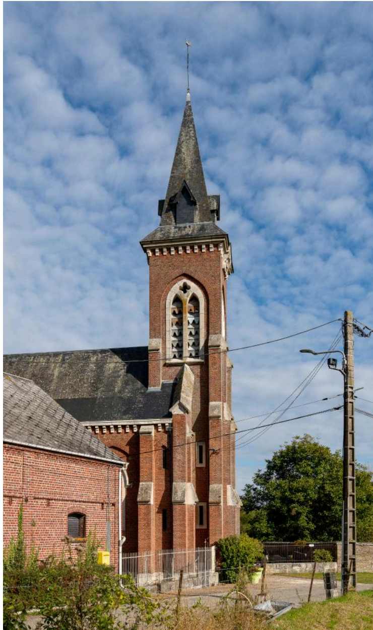
Vue depuis l'ouest.