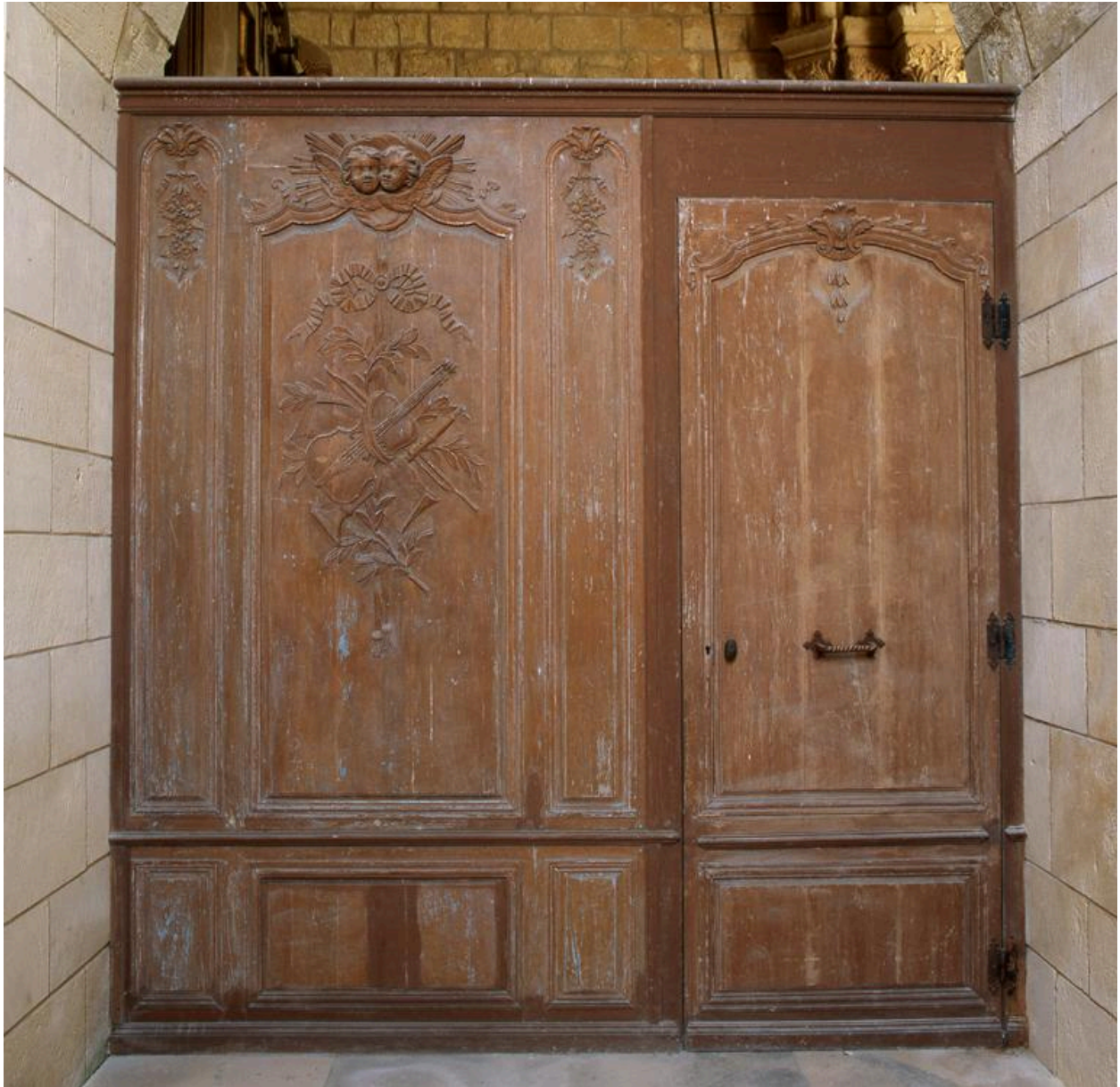
Vue des 2 panneaux.