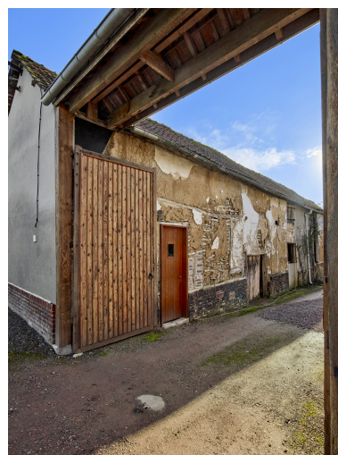
Vue de la grange, depuis le nord. IVR32_20258000242NUCA