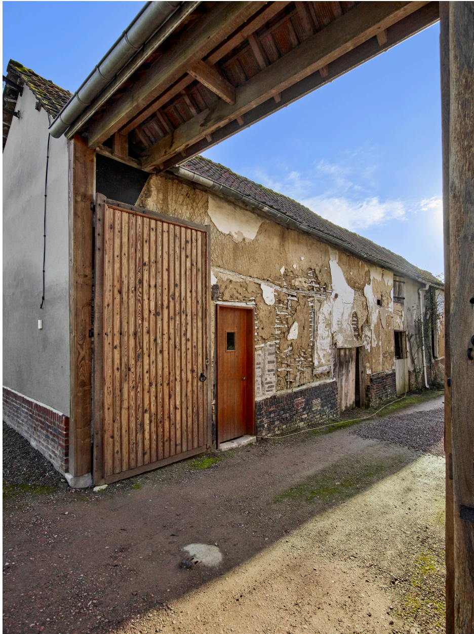
Vue de la grange, depuis le nord.