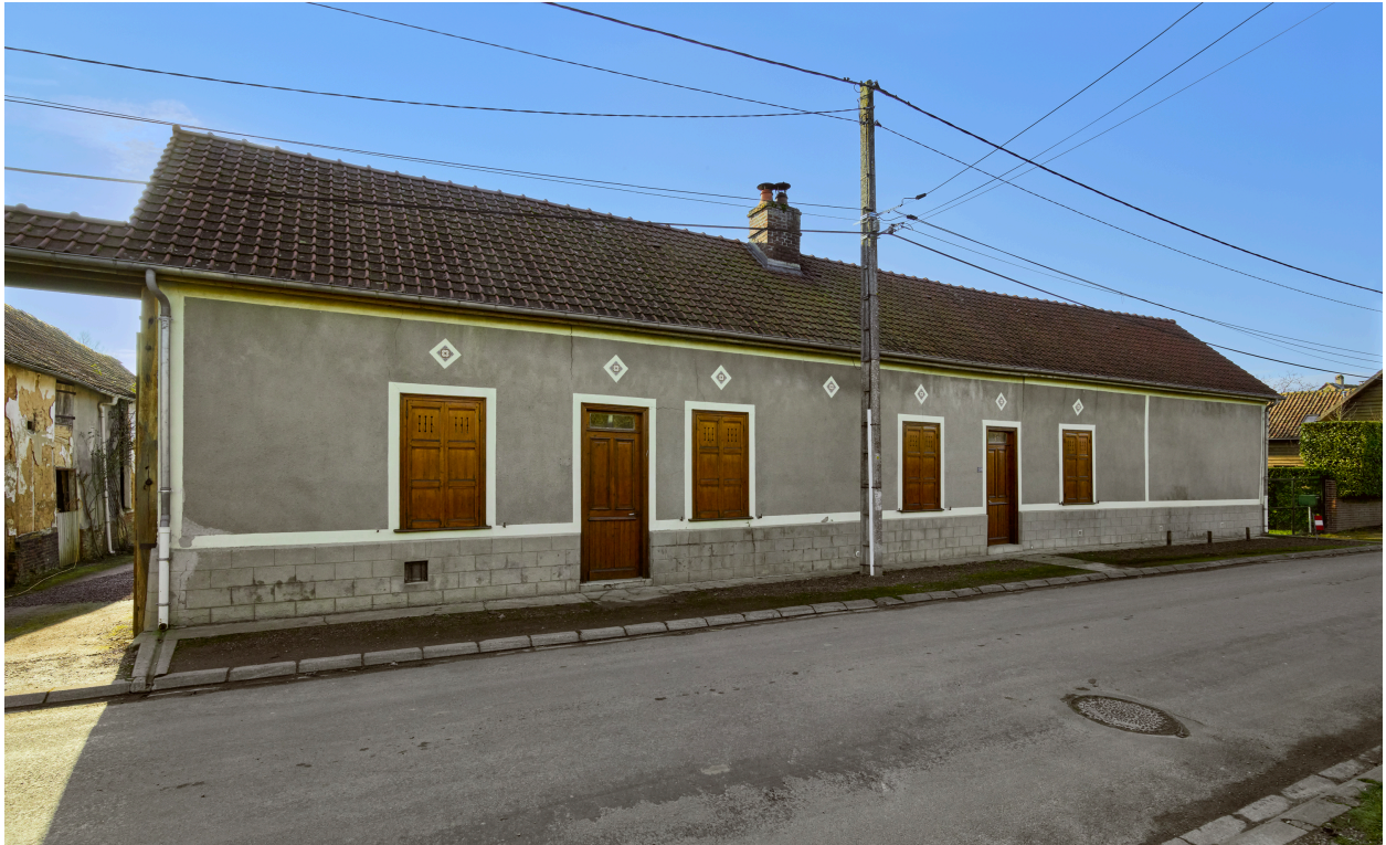
Vue de la maison, depuis le nord-est.