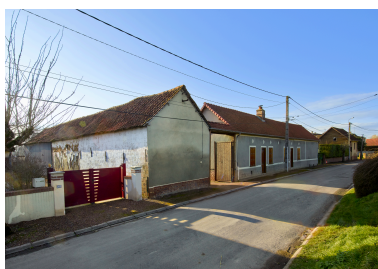
Vue d'ensemble depuis le nord-est. IVR32_20258000239NUCA

IVR32_20248005560NUCA