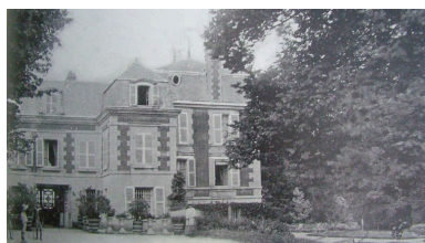
Vue de l'ancien château de Chevregny (coll. part).