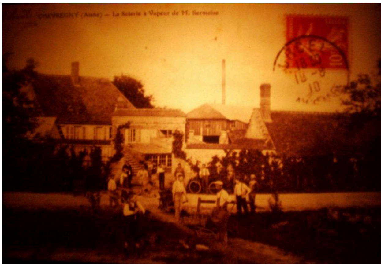
Vue ancienne de la scierie à vapeur de M. Sermoise.