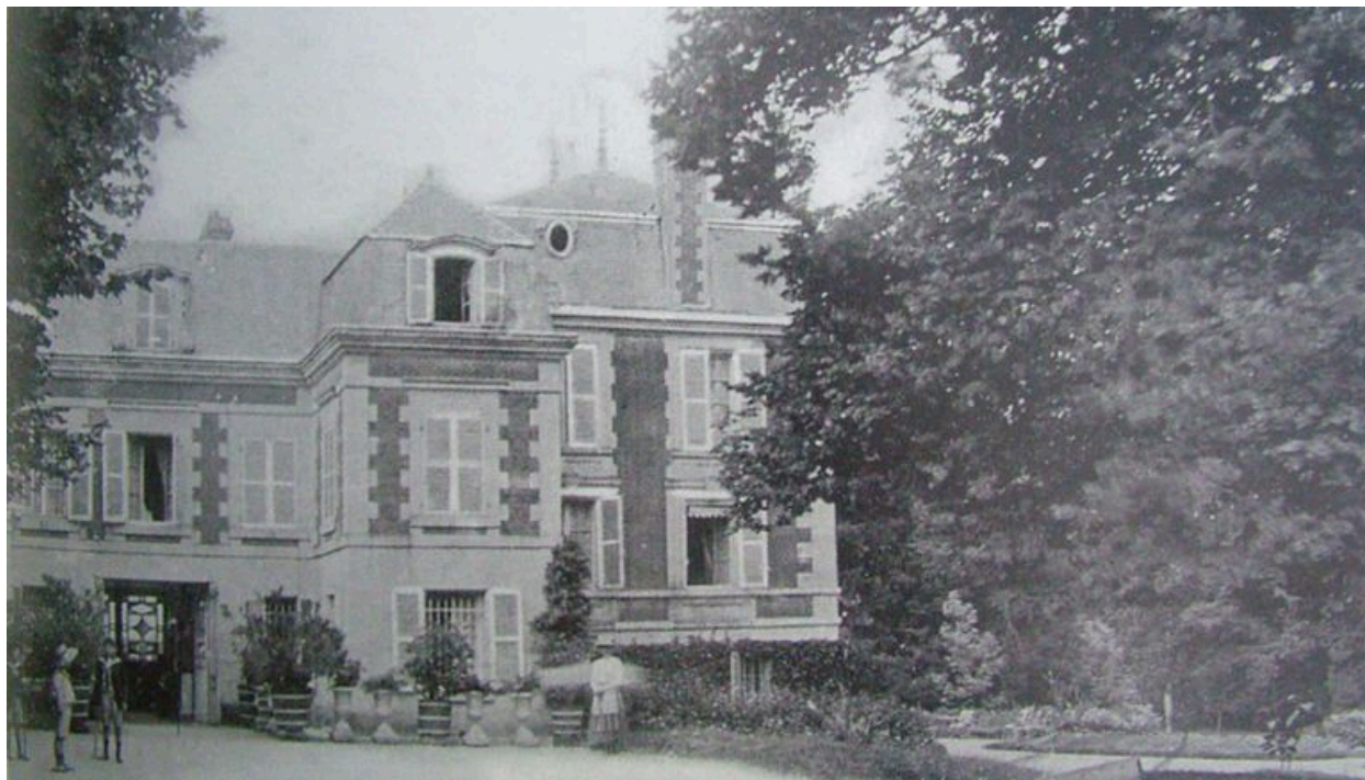
Vue de l'ancien château de Chevregny.