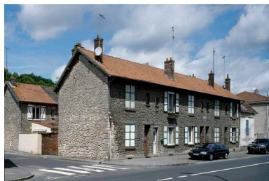
La cité Alphonse-Huré. IVR22_20106000396XA