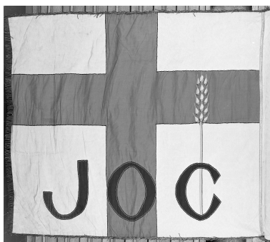
Arrière. IVR31_19966200074X