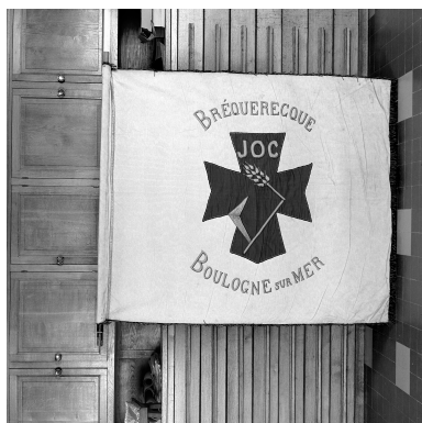
Avant. IVR31_19966200082X