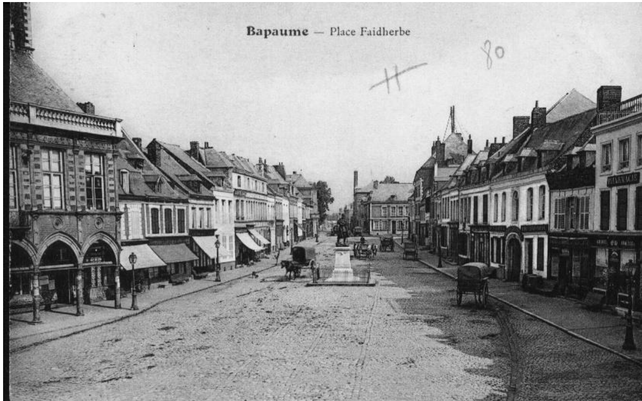
Bapaume - Place Faidherbe. Carte postale, avant 1914. Vue générale orientée ouest-est de la place.