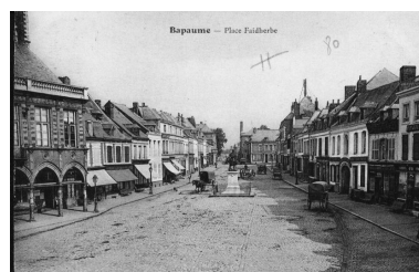
Bapaume - Place Faidherbe. Carte postale, avant 1914. Vue générale orientée ouest-est de la place.