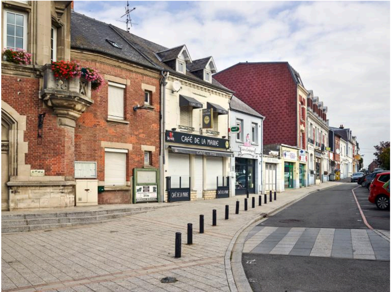
Place Faidherbe, côté nord vu depuis la rue de Péronne. Vue actuelle.