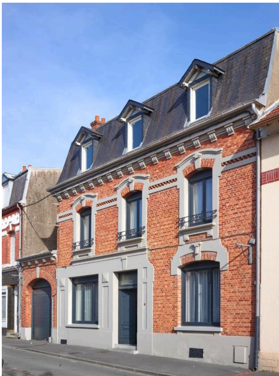
Ancienne maison-boucherie de M. Duquesne-Cottel, 19 place Faidherbe. Construite par Eugène Bidard en septembre 1921. (AD Pas-de-Calais, 10R9/43, dossier n°639). (voir IA62005183).