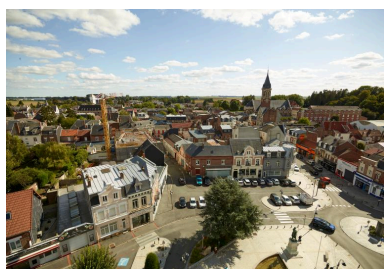
Vue aérienne depuis le beffroi de l'hôtel de ville, vers les rues de Péronne et Briquet-Taillandier. Vue actuelle.