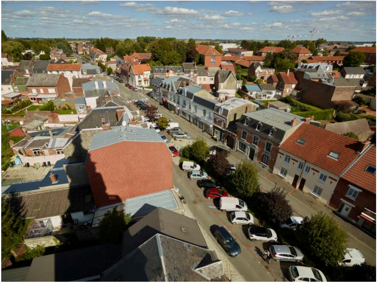
Vue aérienne de la partie haute de la place, vers la rue de Douai. Vue actuelle.