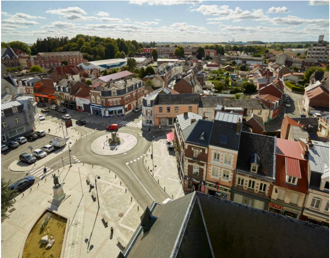
Vue aérienne depuis le beffroi de l'hôtel de ville, vers les rues de péronne, Marcellin Gaudefroy et d'Arras. Vue actuelle.