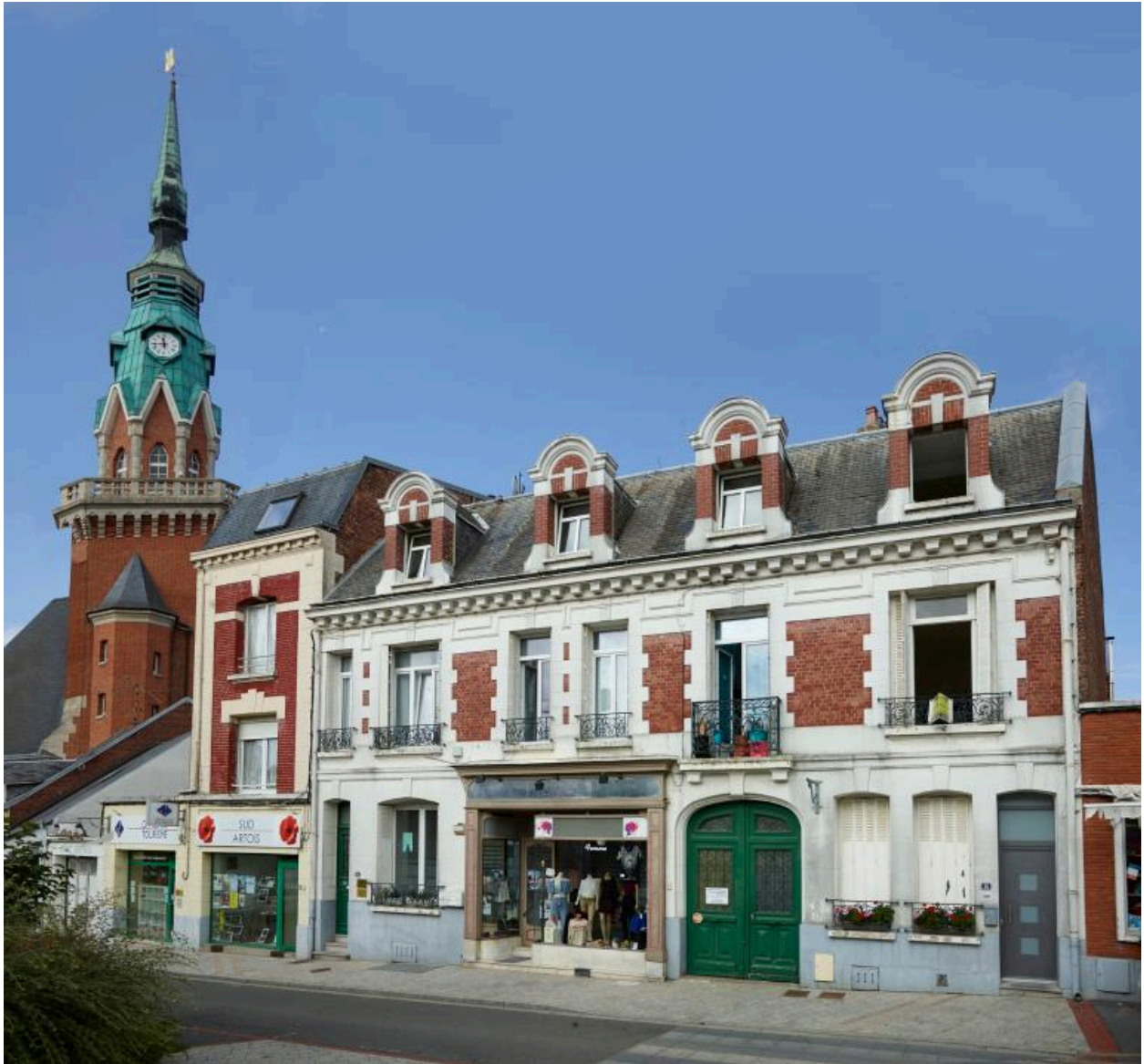
Maison de commerce, n° 14 et 16 place Faidherbe. Ancienne menuiserie-quicaillerie-habitation construite pour M. Béhal par Eugène Bidard en 1922. (AD Pas-de-Calais, 10R9/6, dossier n°86).