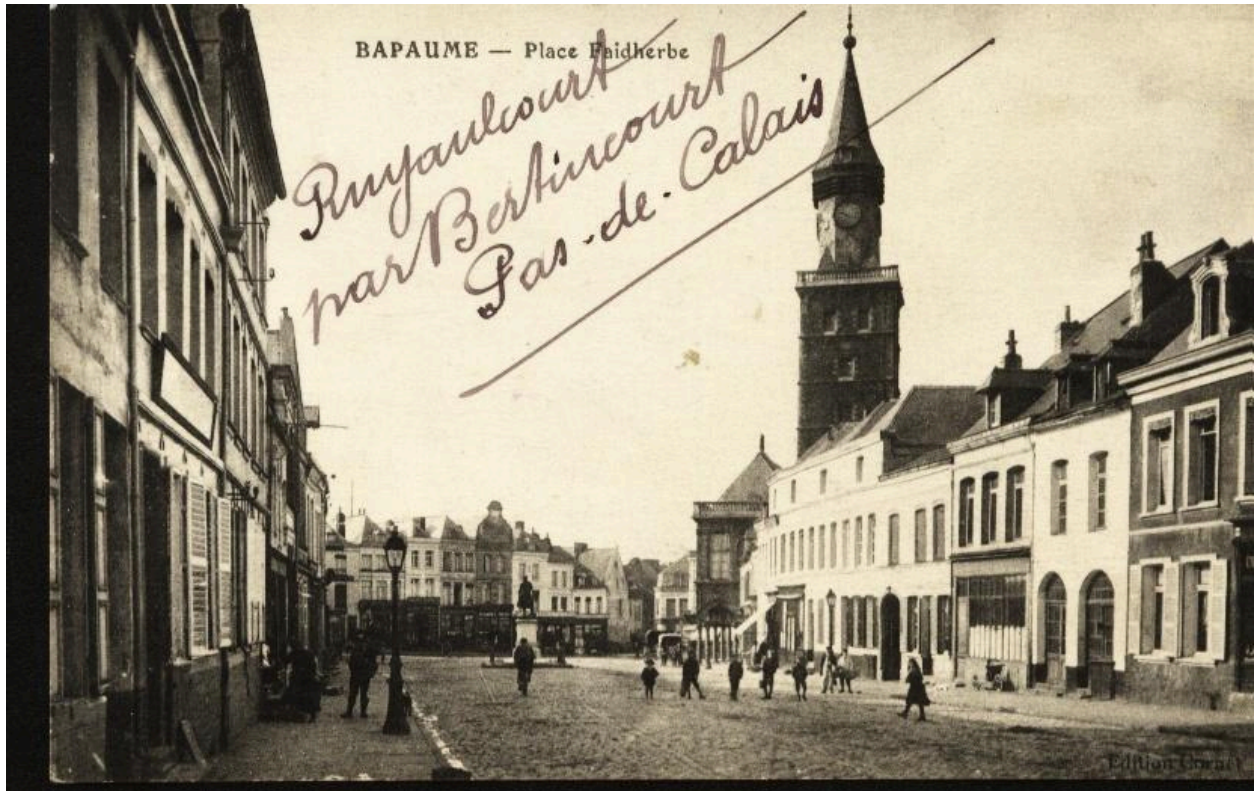
Bapaume - Place Faidherbe. Carte postale, avant 1914. Vue générale de la place orientée est-ouest.