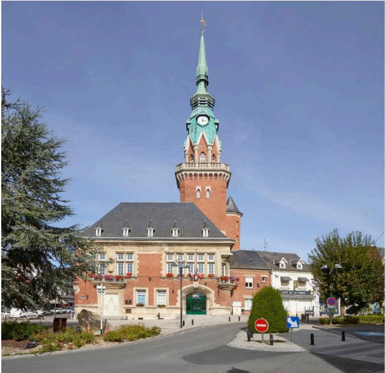
Mairie et place Faidherbe. Vue actuelle.