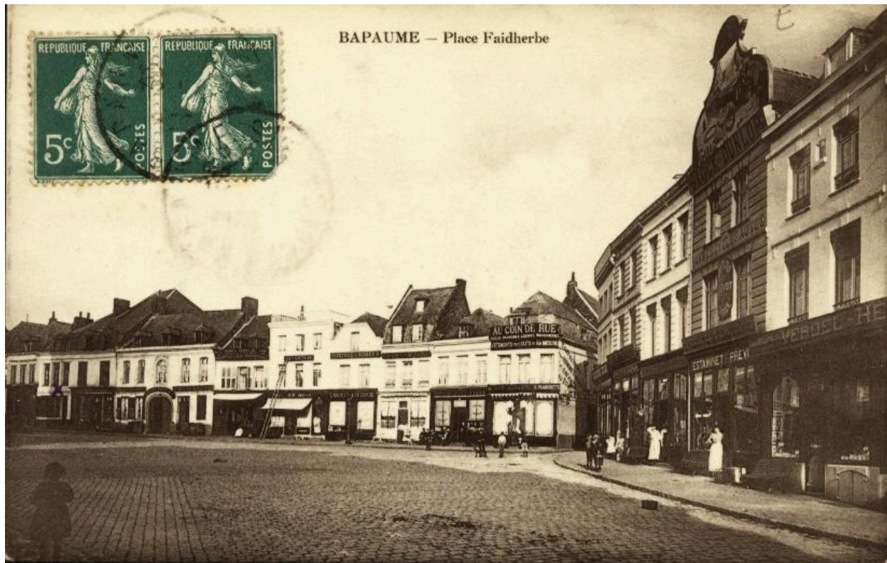
Bapaume - Place Faidherbe. Carte postale, avant 1914 (coll. part.). Vue de la partie nord-ouest de la place.