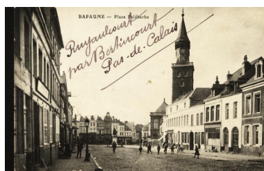
Bapaume - Place Faidherbe. Carte postale, avant 1914. Vue générale de la place orientée est-ouest.