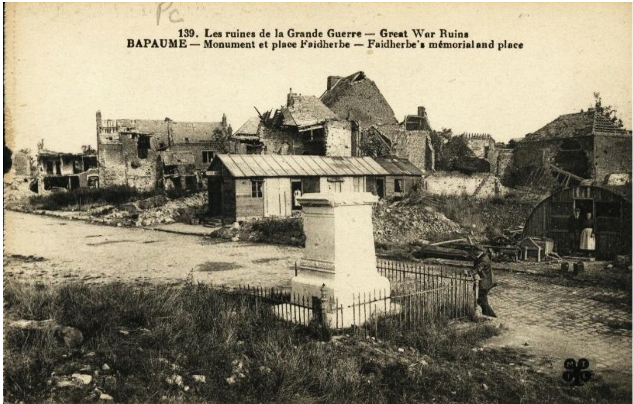
139. Les ruines de la Grande Guerre - Great War ruins. Bapaume - Monument et place Faidherbe - Faidherbe's memorial and place. Carte postale, vers 1921.