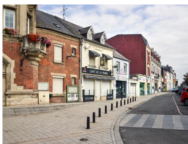
Place Faidherbe, côté nord vu depuis la rue de Péronne. Vue actuelle.