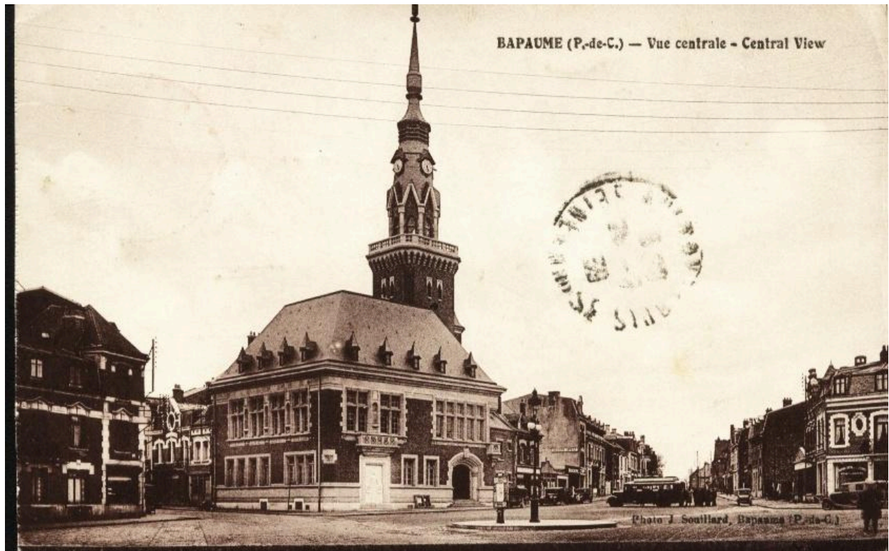
Bapaume (P.-de-C.) - vue centrale - Central view. J. Souillard, Bapaume (P.-deC.). Carte postale, vers 1940 (coll. part.). Vue de la nouvelle place orientée est-ouest.