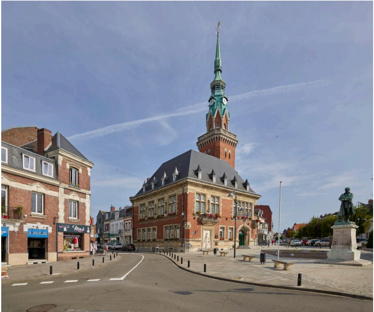
L'hôtel de ville et le monument au Général Faidherbe, depuis le carrefour de la rue d'Arras. Vue actuelle.