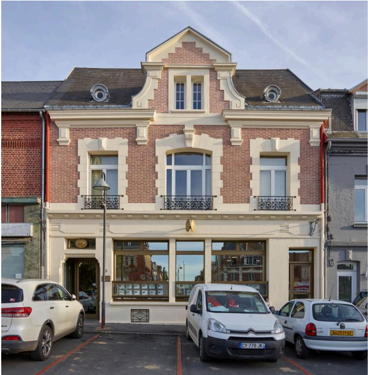
Ancienne banque Adam, n°3 place Faidherbe. Façade principale depuis la place. Construite en 1929 par l'architecte parisien Bonnard. (AD Pas-de-Calais, 10R9/115, dossier n°1955).