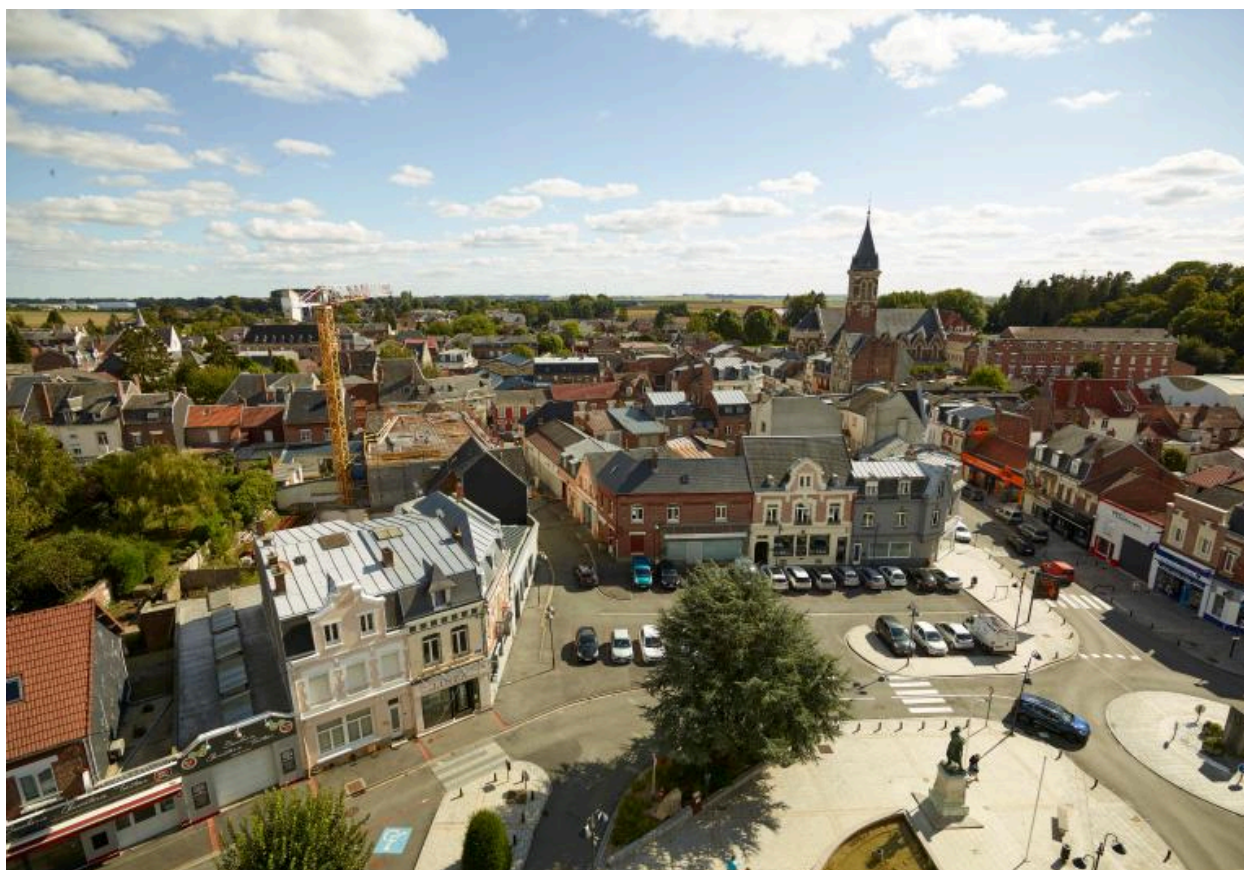
Vue aérienne depuis le beffroi de l'hôtel de ville, vers les rues de Péronne et Briquet-Taillandier. Vue actuelle.