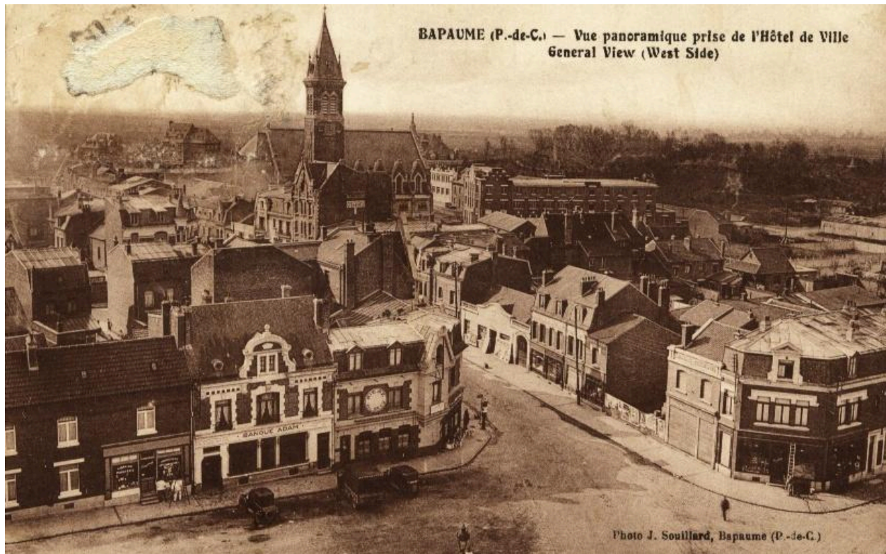
Bapaume (P.-de.C.) - Vue panoramique prise de l'hôtel de ville, General view (west side). Photo J. Souillard - Bapaume (P.-de-C.). Carte postale, après 1931 (coll. part.). Vue aérienne de la partie nord-ouest de la place et l'entrée de la rue de Péronne.