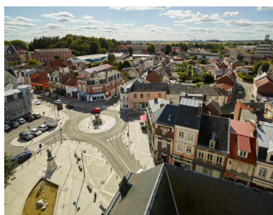
Vue aérienne depuis le beffroi de l'hôtel de ville, vers les rues de Péronne, Marcellin-Gaufrey et d'Arras. Vue actuelle.