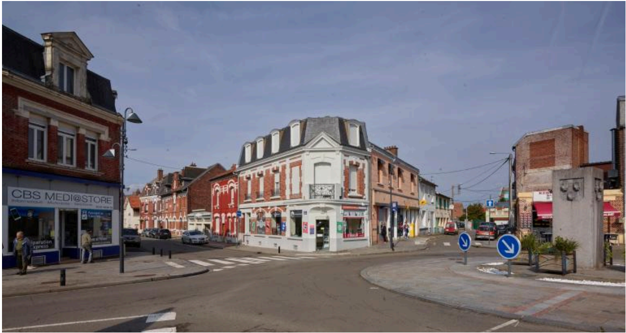
Le carrefour des rues Marcelin-Gaudefroy et d'Arras, au sud de la place Faidherbe. Vue actuelle.