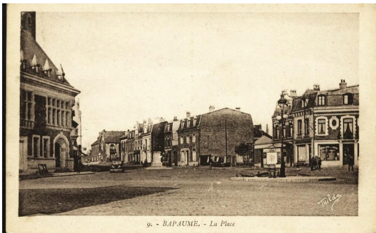
9. Bapaume - la place. Signée Thilda. Carte postale, vers 1930 (coll. part.). Vue générale orientée ouest-est de la place Faidherbe.