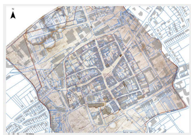
Juxtaposition de la feuille C2 du cadastre napoléonien de 1829 (AD Pas-de-Calais, 3P080/7)