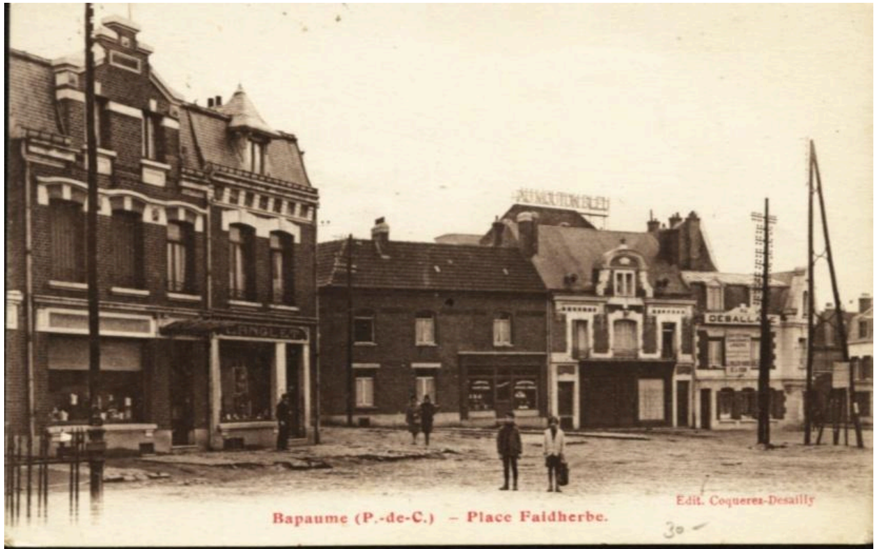
Bapaume (P.-de-C.) - Place Faidherbe. Editions Coquerez - Desailly. Carte Postale, vers 1930 (coll. part.). Détail de la partie sud-ouest.