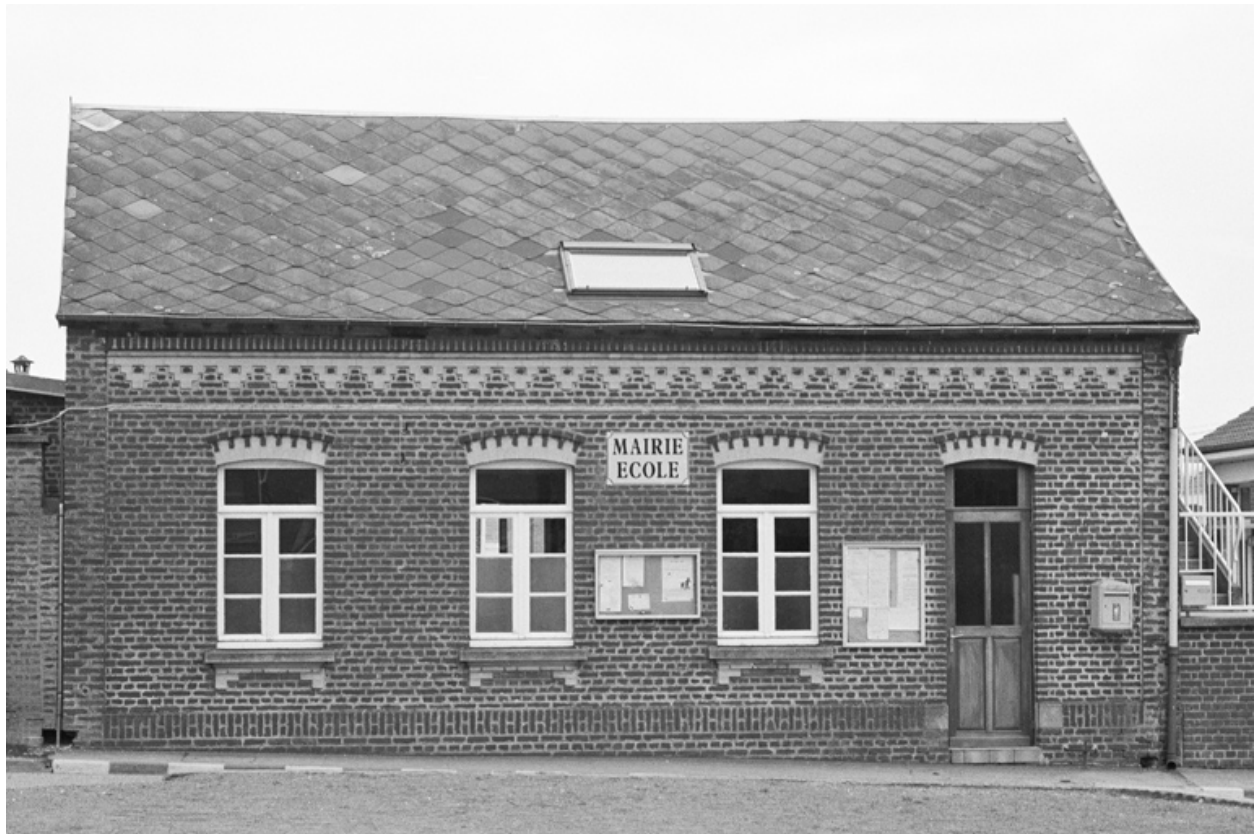
Façade antérieure de l'école donnant sur la place de l'Eglise.