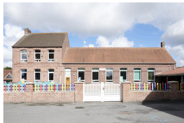
Façade sud, sur cour. IVR32_20245902981NUCA