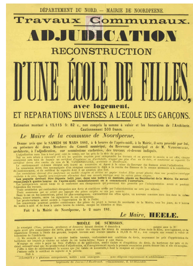
Affiche d'adjudication pour la reconstruction d'une école de filles, avec logement et réparations diverses à l'école de garçons, 1881 (AD Nord : 2 O 437 / 27). IVR32_20255900564NUCA