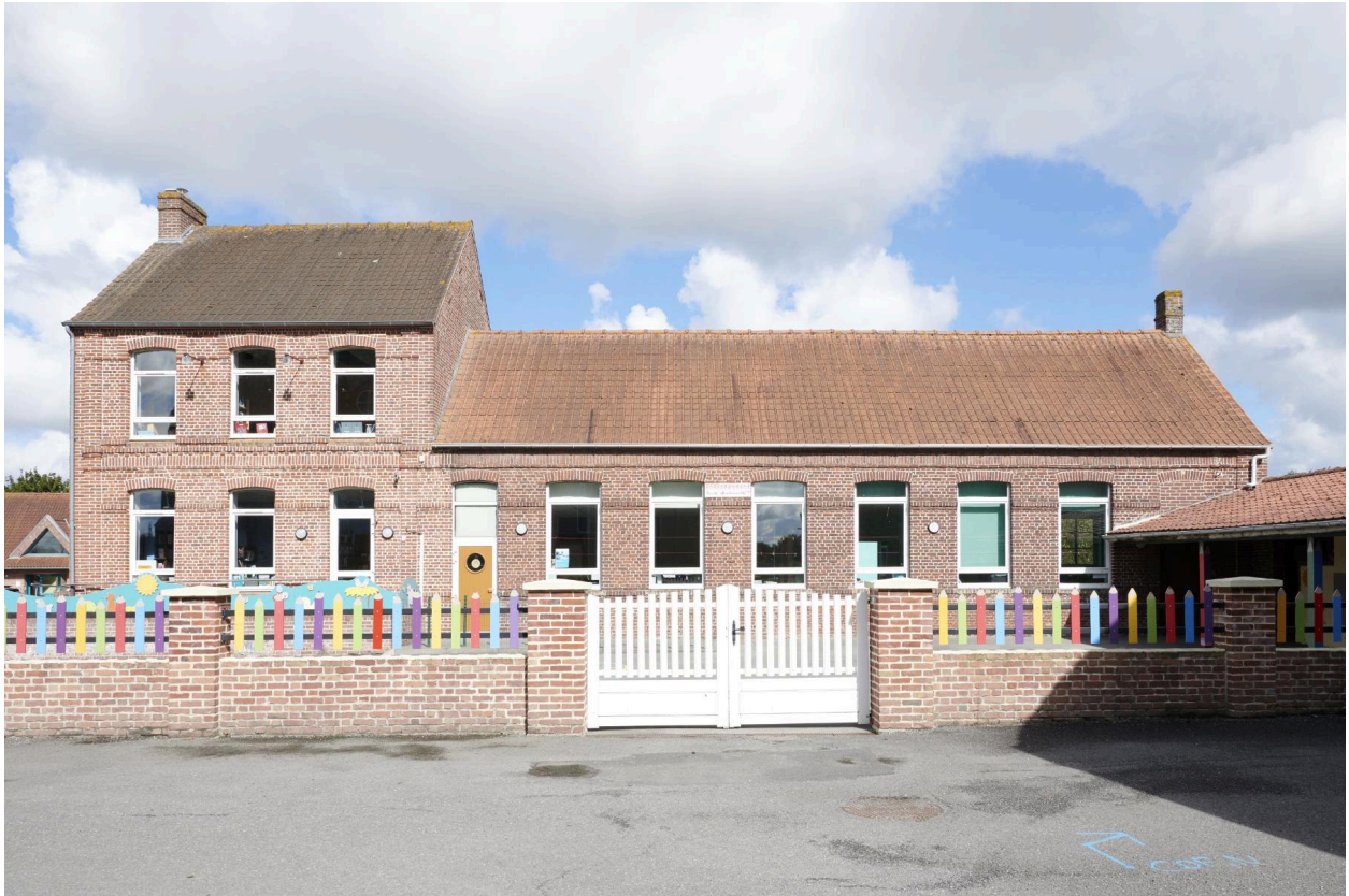
Façade sud, sur cour.