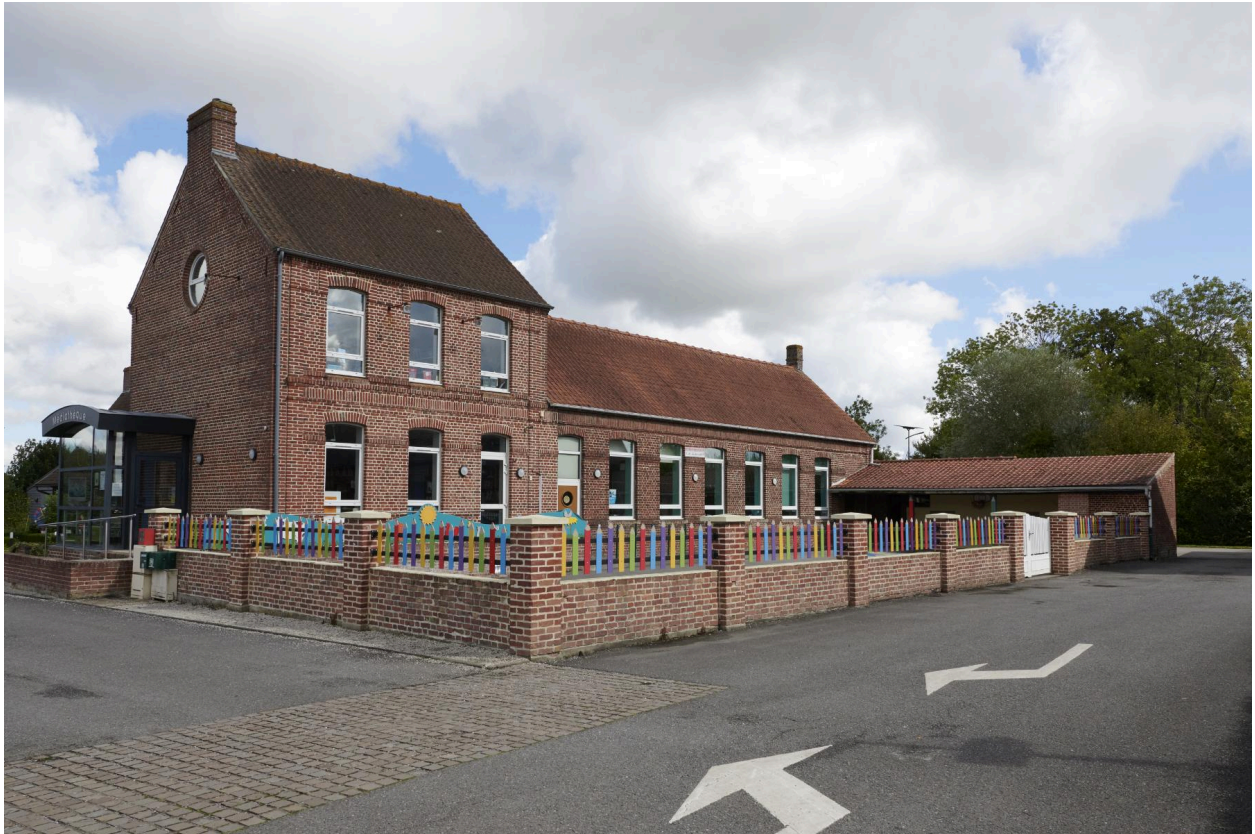
Pignon ouest et façade sud sur cour.