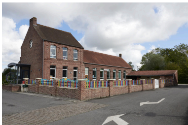
Pignon ouest et façade sud sur cour. IVR32_20245902983NUCA