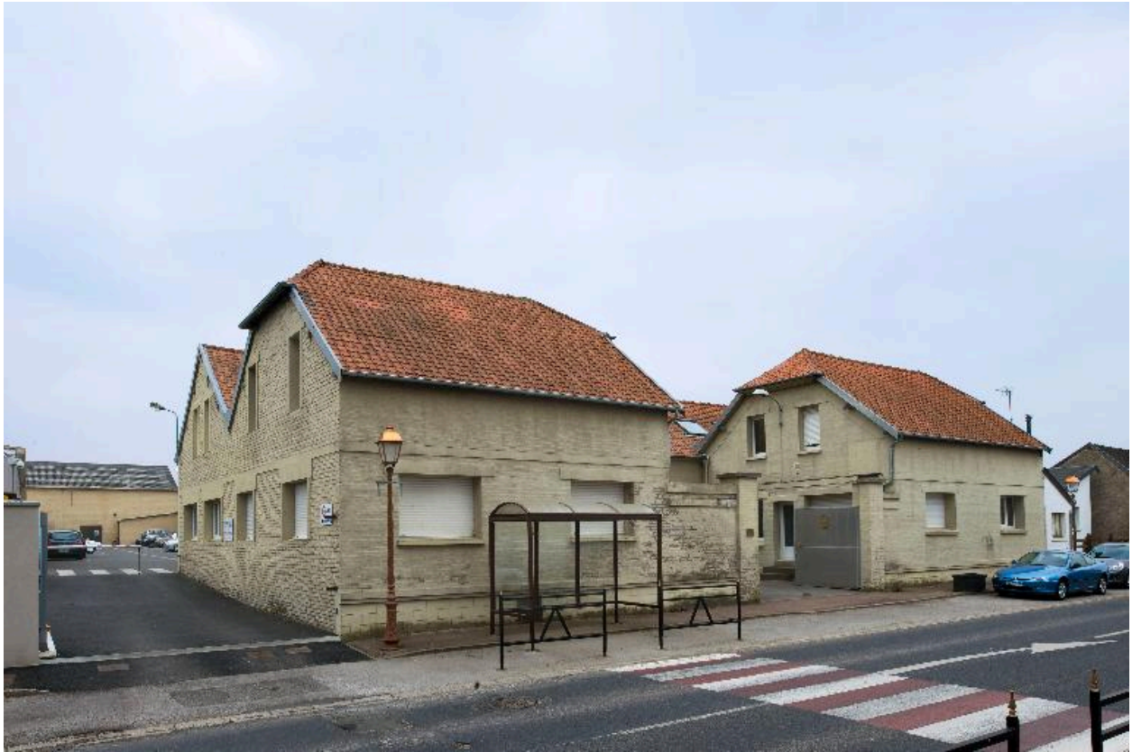
Entrée principale, 45 rue Jean-Jaurès.