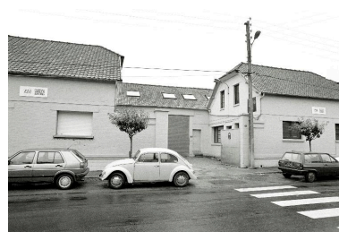
L'entrée principale, 45 rue Jean-Jaurès, en 1990.