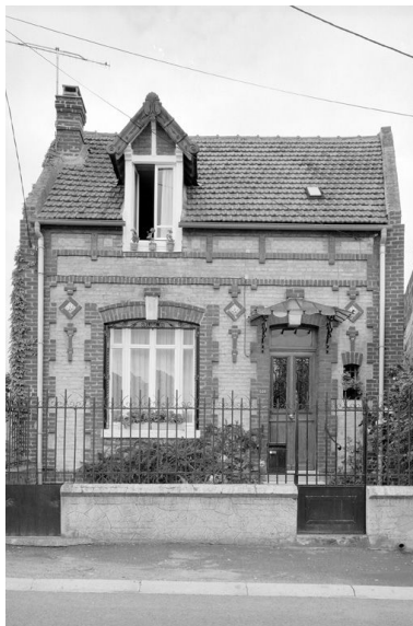
Elévation antérieure.