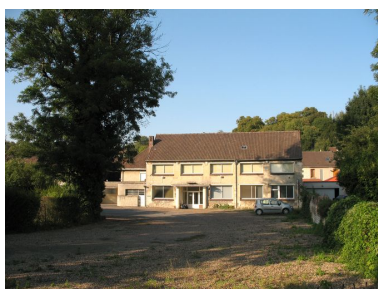
Emplacement de la perlerie aujourd'hui occupée par la mairie annexe de Montataire.

Repro. Clarisse Lorieux IVR22_20086005074NUCAB