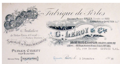
Papier à en-tête de la perlerie Leroy, 1939 (AC Montataire ; 4H3).

IVR22_20086005074NUCAB