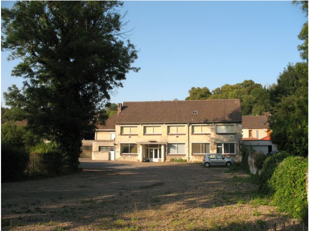
Emplacement de la perlerie aujourd'hui occupée par la mairie annexe de Montataire.