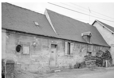
Elévation antérieure. IVR22_19856000771X