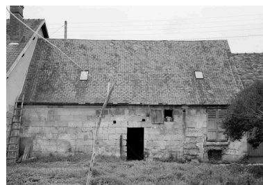
Elévation postérieure.