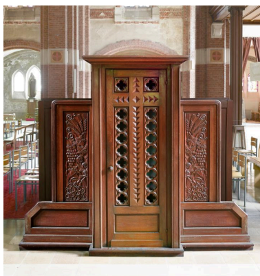
Vue générale de face depuis la nef.