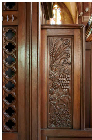
Détail du décor d'un panneau des loges latérales. IVR32_20216200517NUCA