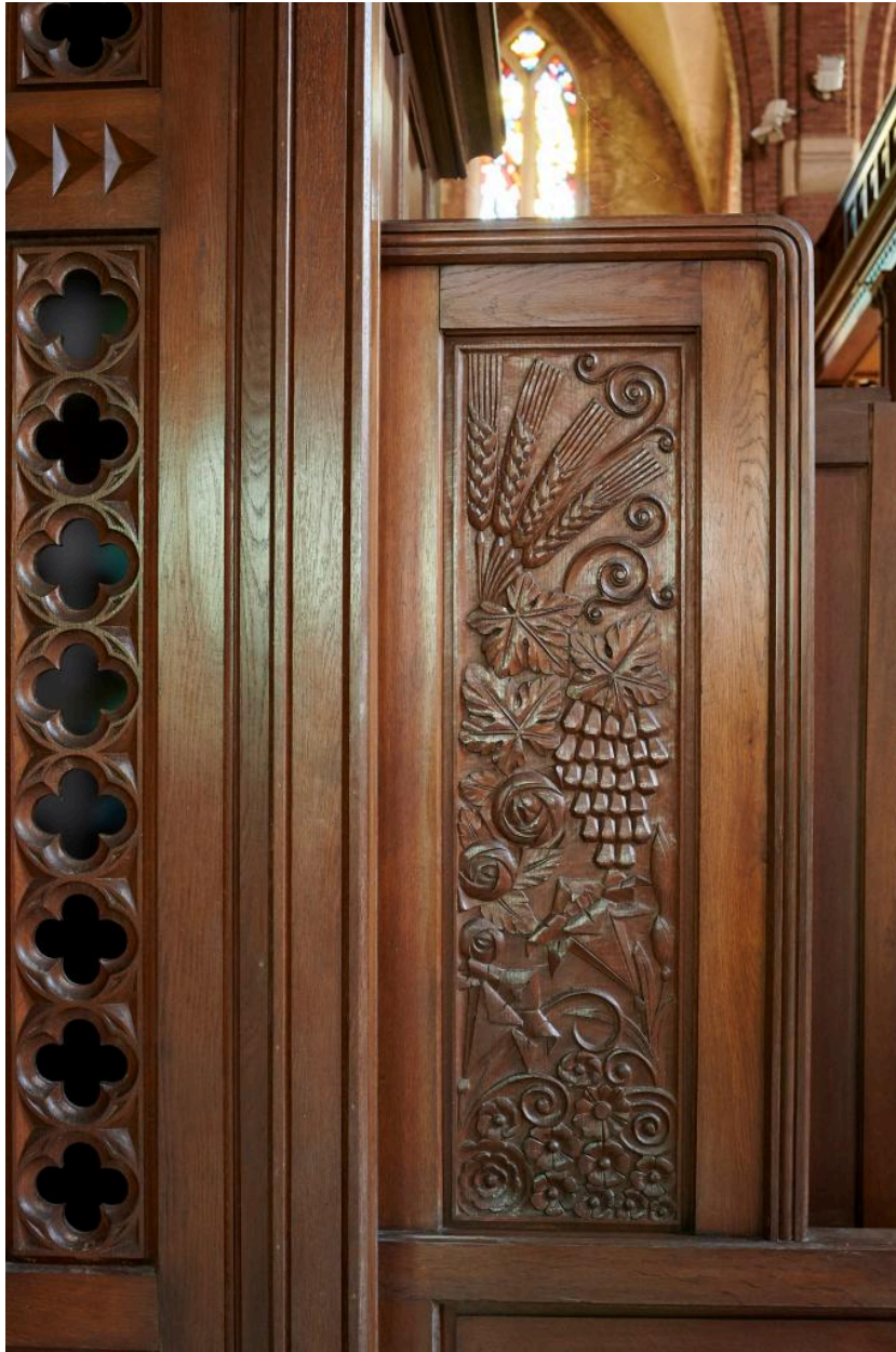
Détail du décor d'un panneau des loges latérales.