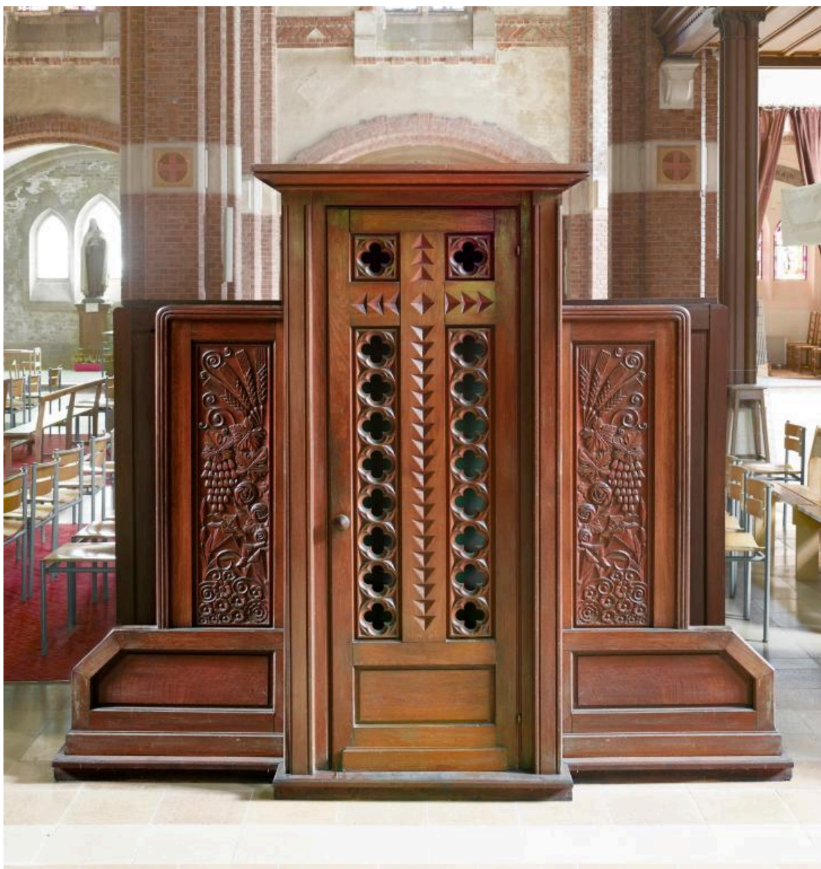
Vue générale de face depuis la nef.