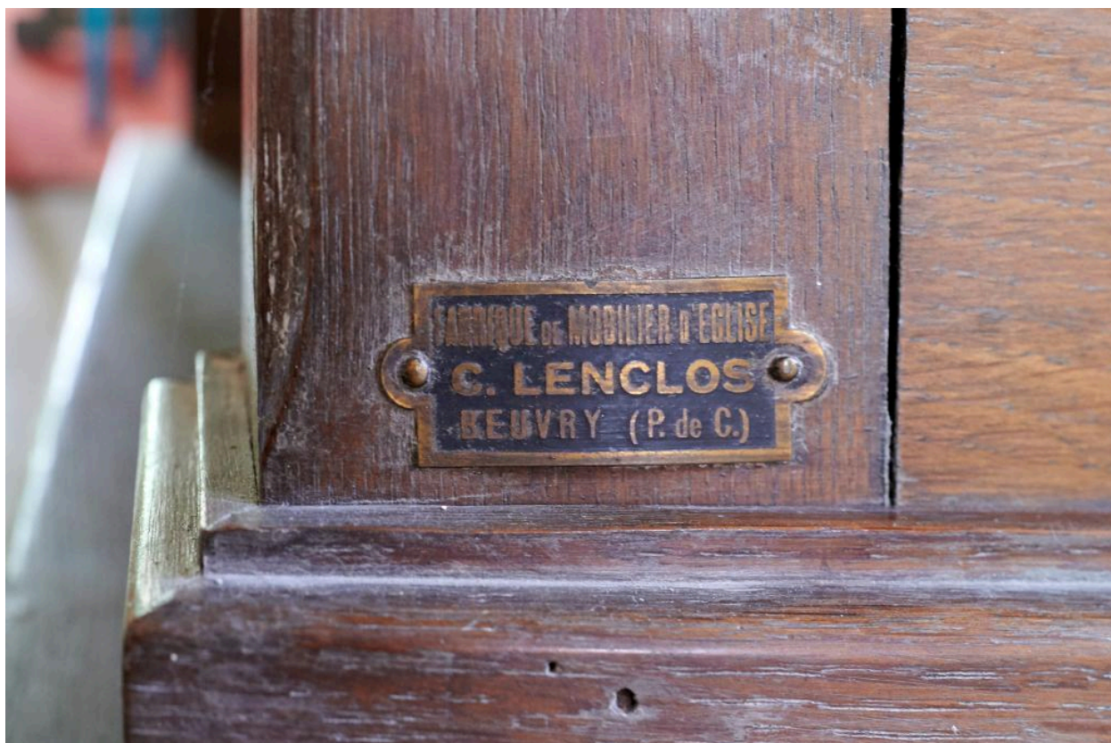
Étiquette métallique de l'entreprise C. Lenclos apposée à l'avant gauche du confessionnal situé sur le côté gauche de la nef.