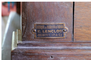
Etiquette métallique de l'entreprise C. Lenclos apposée à l'avant gauche du confessionnal situé sur le côté gauche de la nef.