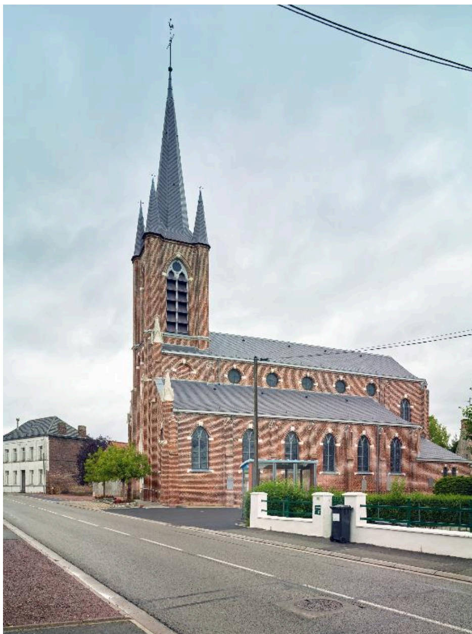
Vue générale de trois quarts depuis l'est.