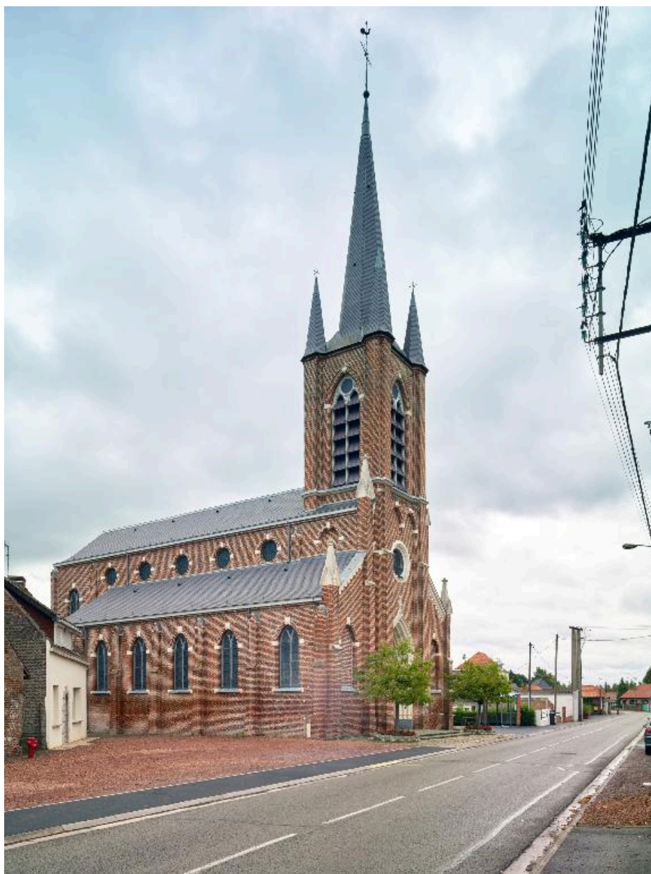
Vue générale de trois quarts depuis l'ouest.