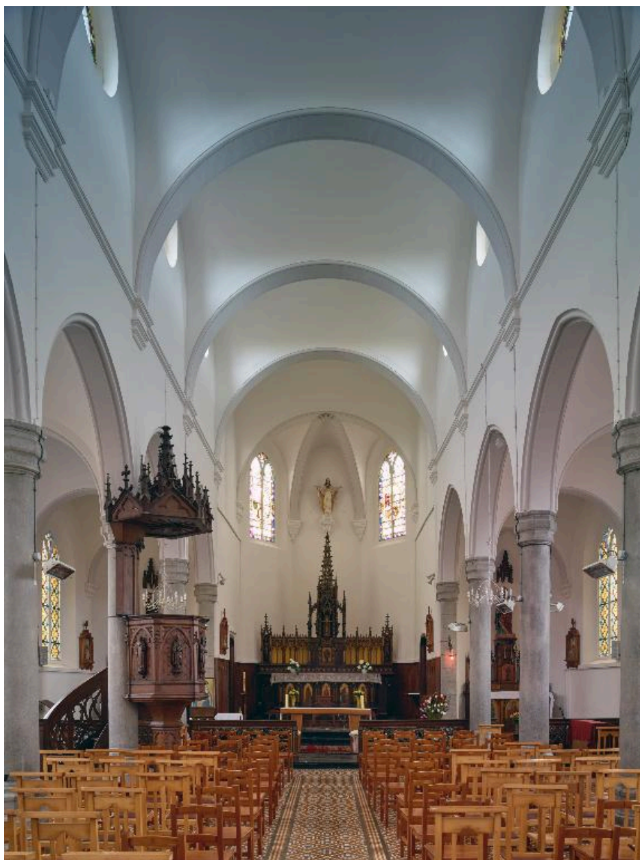
Vue générale intérieure vers le chœur.