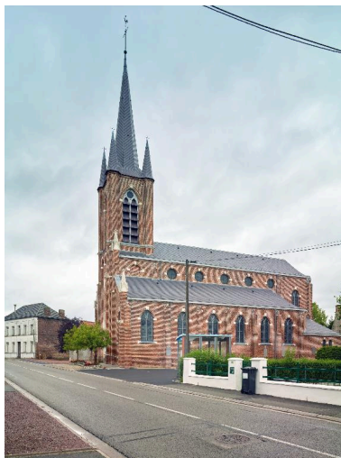
Vue générale de trois quarts depuis l'est. IVR31_20155901633NUCA