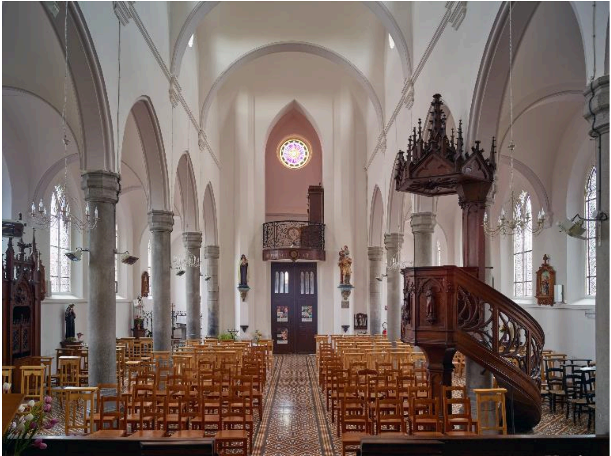
Vue générale vers l'entrée.