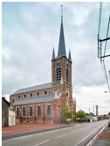
Vue générale de trois quarts depuis l'ouest.