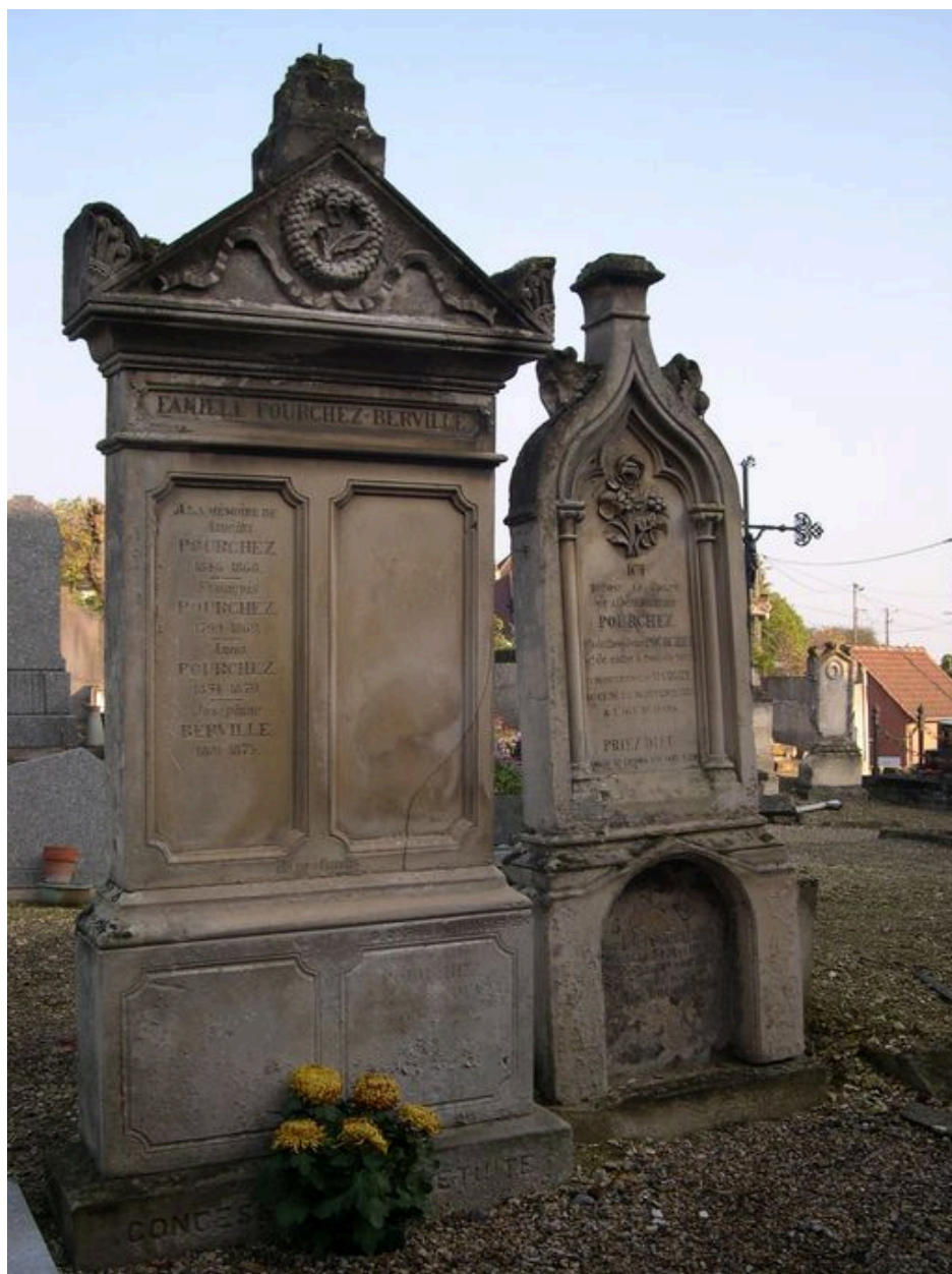
Vue des stèles.