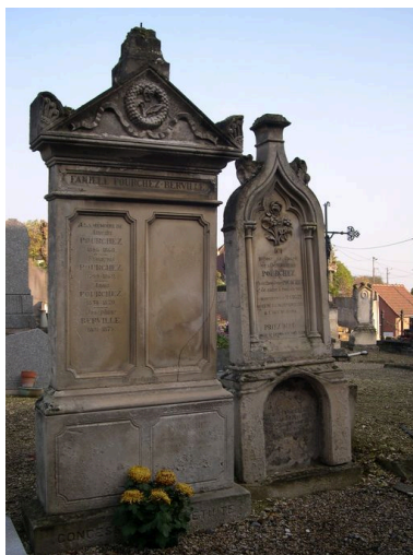
Vue des stèles.