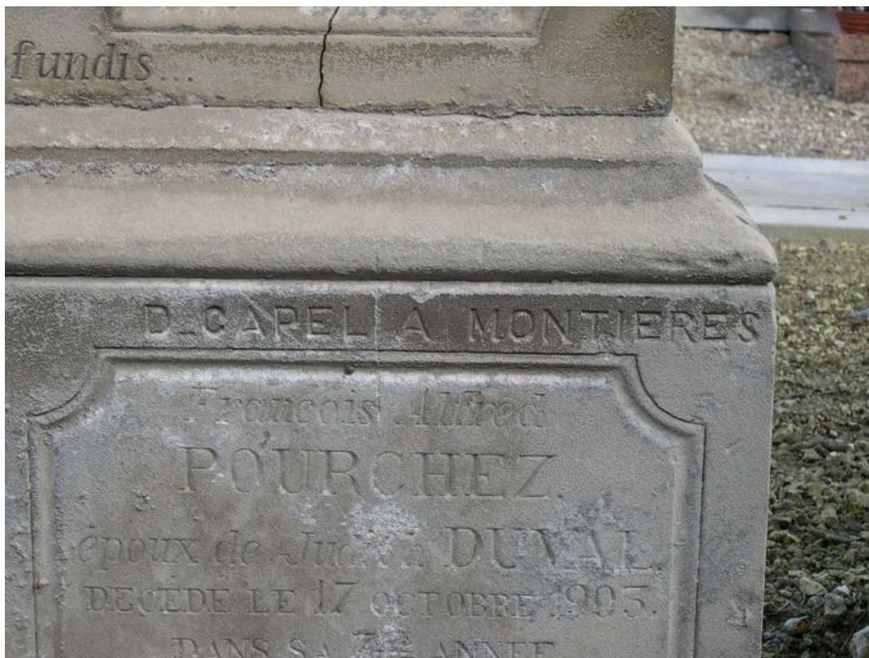
Détail sur la signature : D. Capel à Montières.