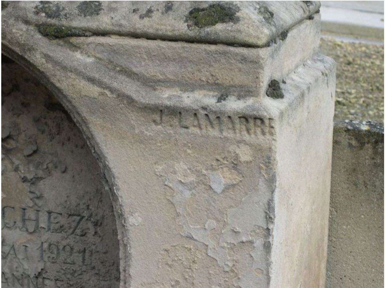
Détail sur la signature : J. Lamarre.