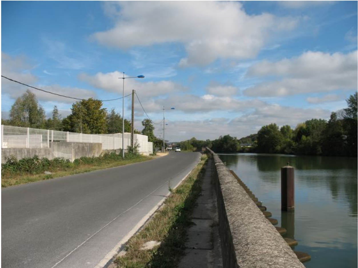
L'Oise, le quai d'Amont et l'ancien site de la tonnellerie.