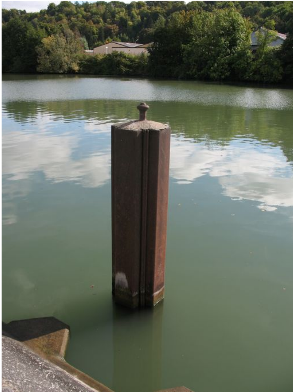
Bittes d'amarrage en fonte de l'ancien port de la tonnellerie.