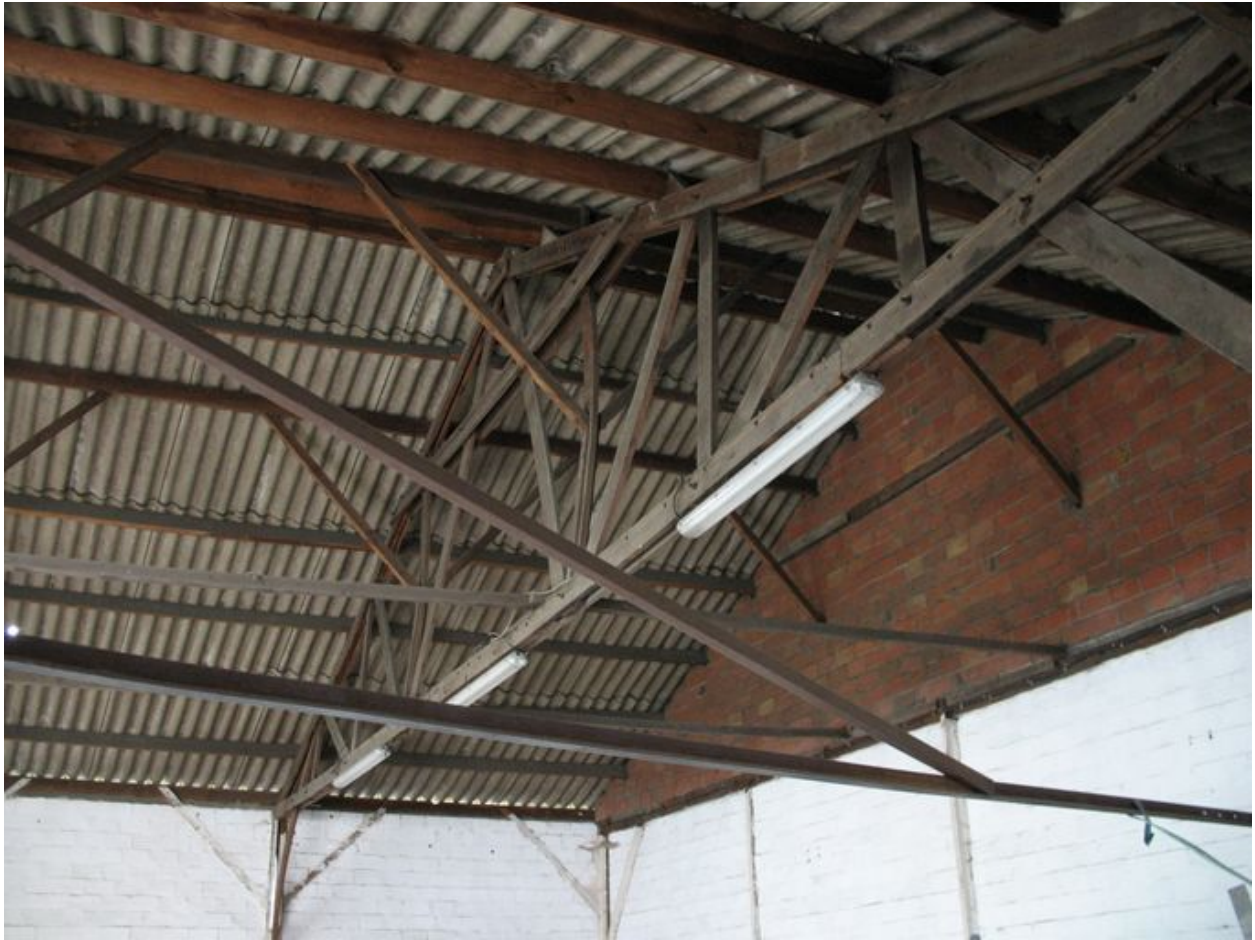
Détail de la charpente en bois du magasin de stock des fûts.