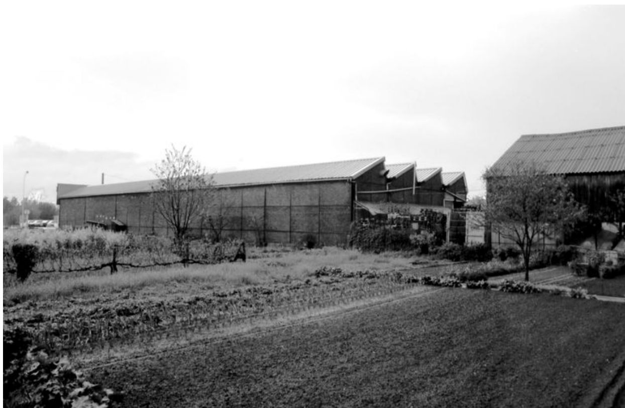
Atelier des fûts étanches en 1992.