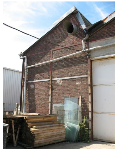
Détail d'une travée couverte en shed de l'ancien atelier des fûts d'emballage. IVR22_20096005148NUCA