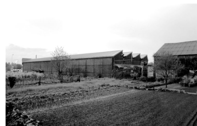
Atelier des fûts étanches en 1992. IVR22_19926000213Z