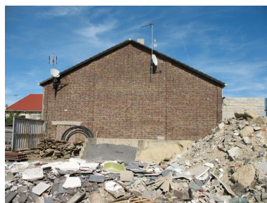
Mur pignon ouest de l'ancienne centrale.