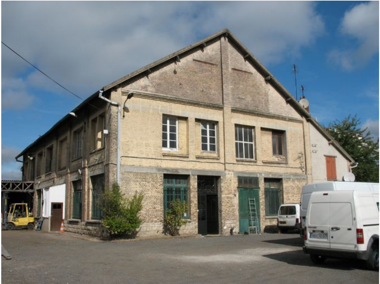
Vue générale de l'ancien atelier des fûts d'emballage et des bureaux.