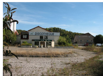
Ancienne scierie transformée en discothèque. IVR22_20096005151NUCA