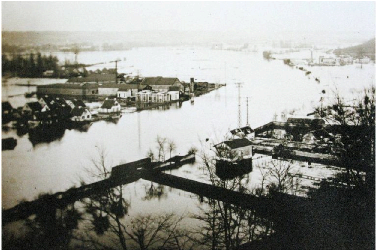
La tonnellerie sous les eaux de l'Oise lors de la crue de janvier 1926 (AC Nogent-sur-Oise ; fonds local).