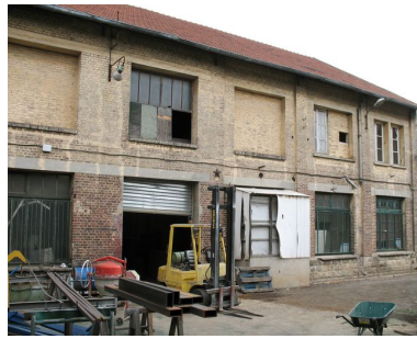
Façade ouest de l'ancien atelier des fûts d'emballage.