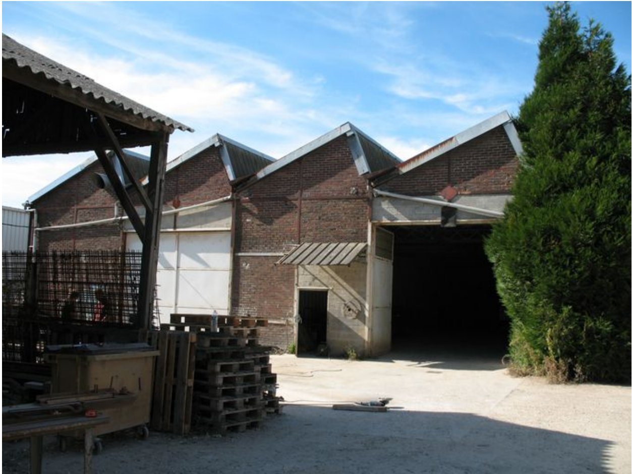
Anciens ateliers de vernissage et de vérification des fûts étanches.