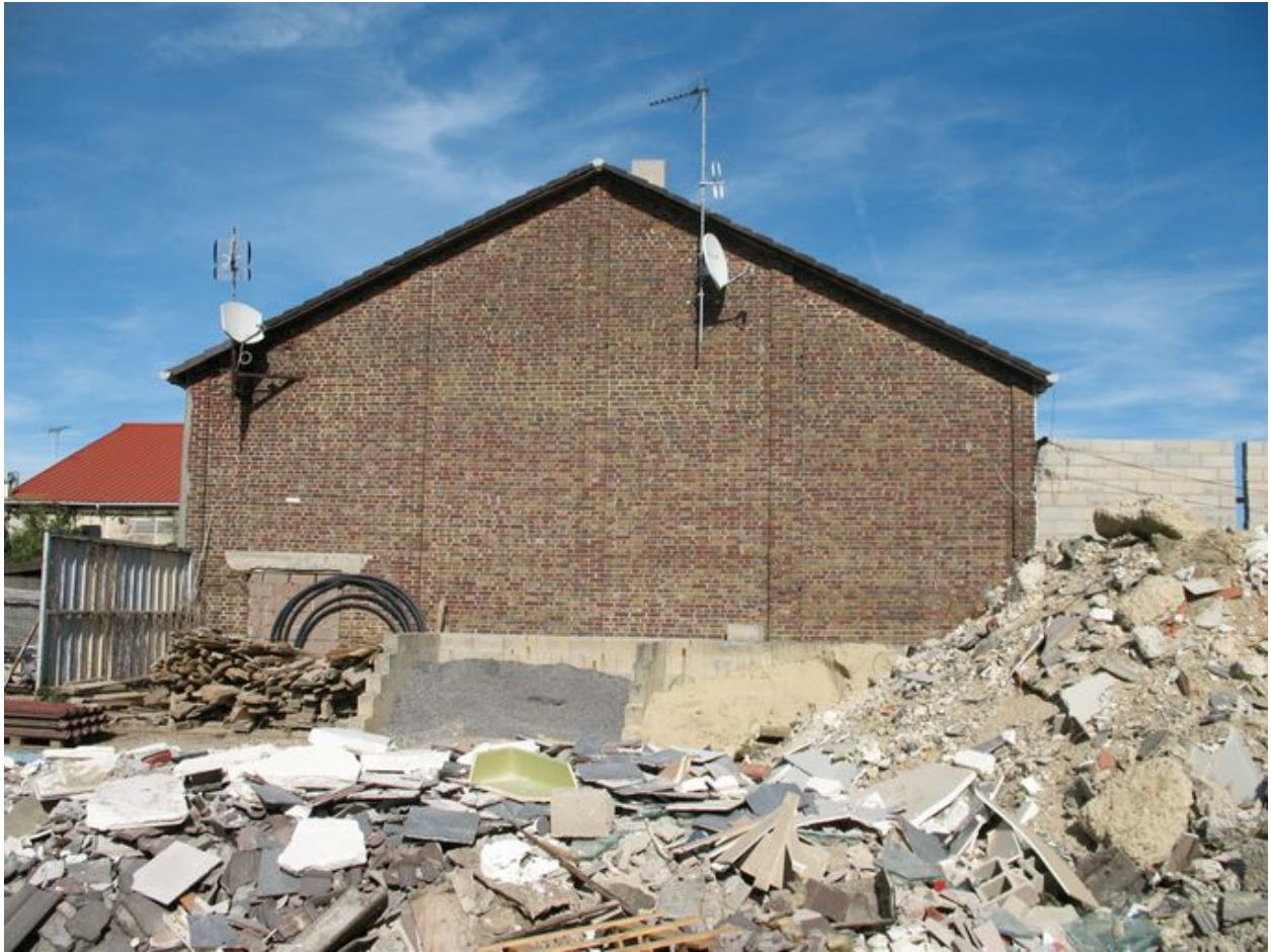
Mur pignon ouest de l'ancienne centrale.