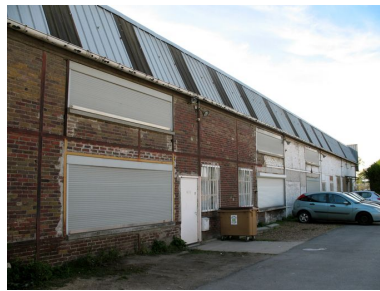
Façade est de l'ancien atelier des fûts étanches. IVR22_20096005147NUCA