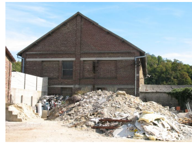
Pignon nord de l'ancien atelier des fûts d'emballage. IVR22_20096005145NUCA