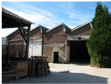
Anciens ateliers de vernissage et de vérification des fûts étanches.