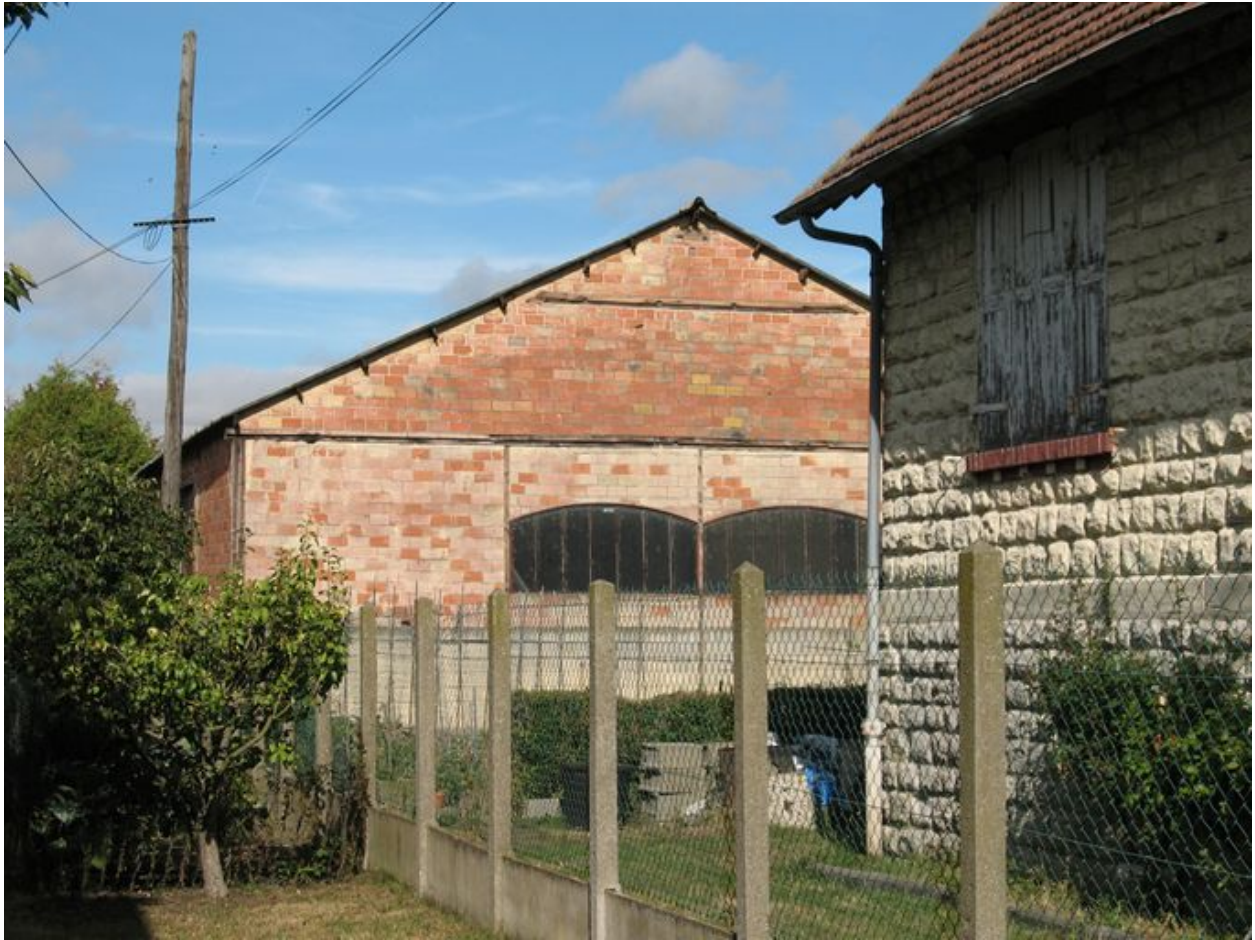
Mur pignon sud du magasin de stockage des fûts.