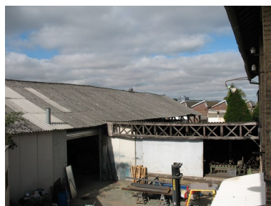
Ancien magasin de stockage des fûts.