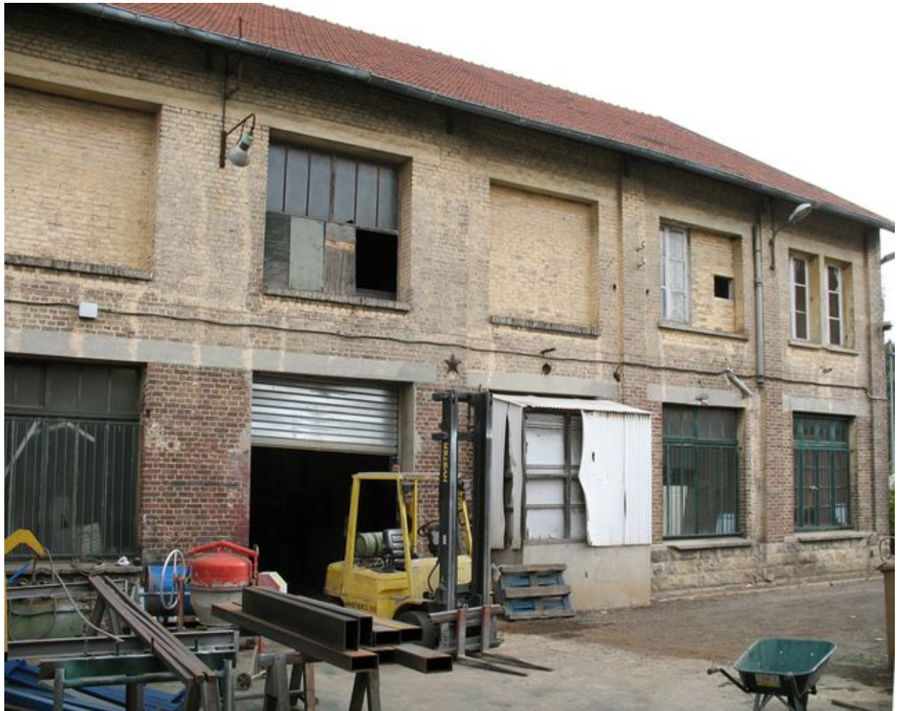
Façade ouest de l'ancien atelier des fûts d'emballage.