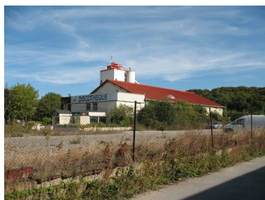
Façade ouest de l'ancienne scierie.