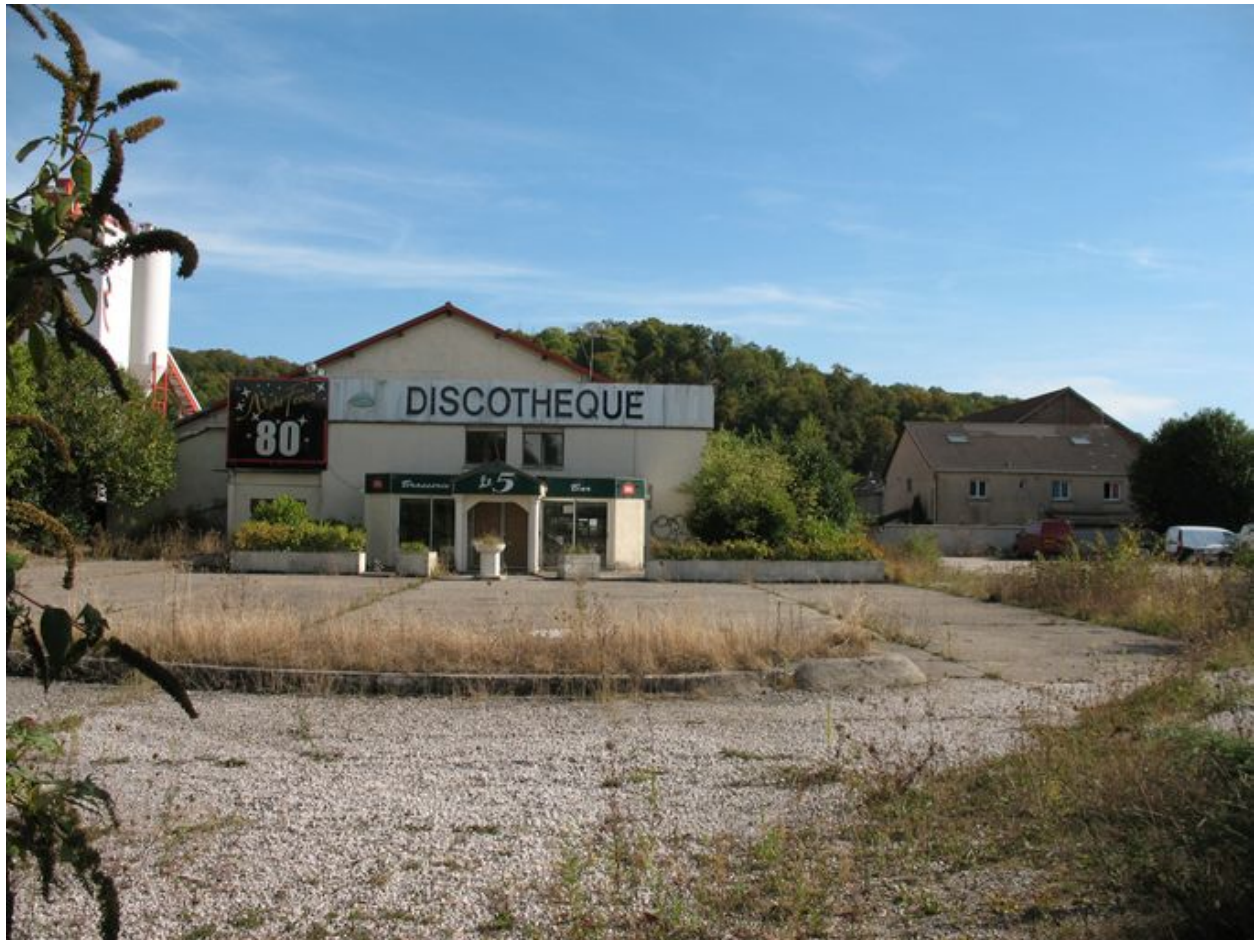
Ancienne scierie transformée en discothèque.