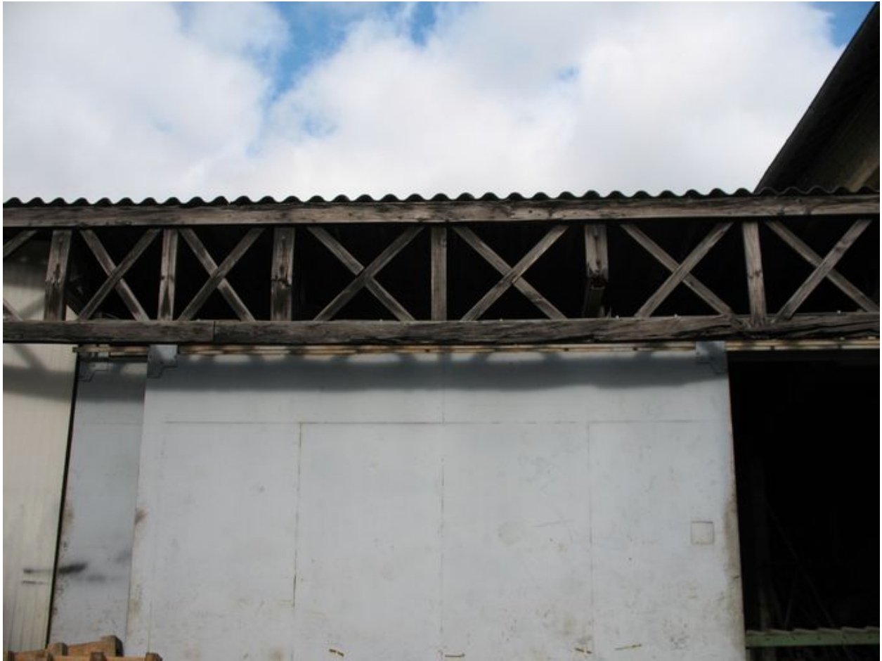
Détail de la charpente en bois entre l'atelier et le magasin.