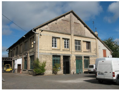
Vue générale de l'ancien atelier des fûts d'emballage et des bureaux. IVR22_20096005143NUCA