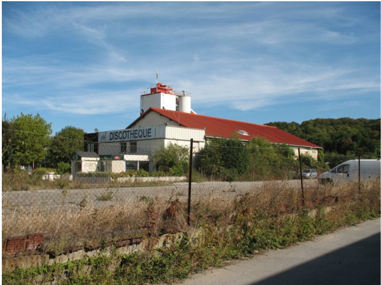
Façade ouest de l'ancienne scierie.