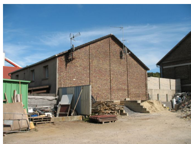
Ancienne centrale transformée en maison d'habitation. IVR22_20096005150NUCA