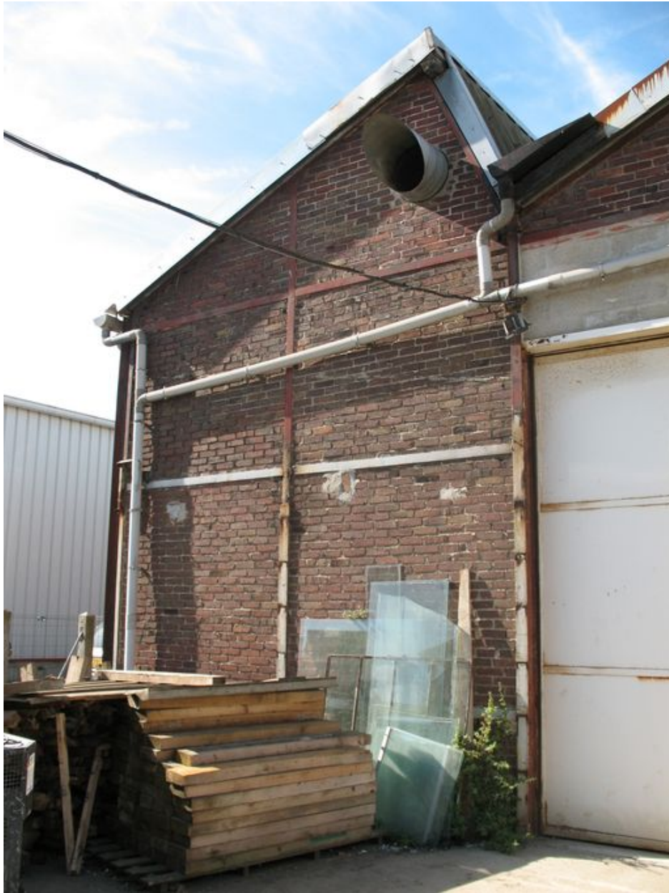
Détail d'une travée couverte en shed de l'ancien atelier des fûts d'emballage.