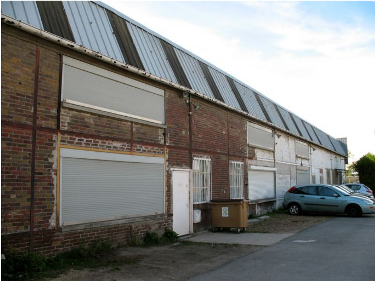
Façade est de l'ancien atelier des fûts étanches.