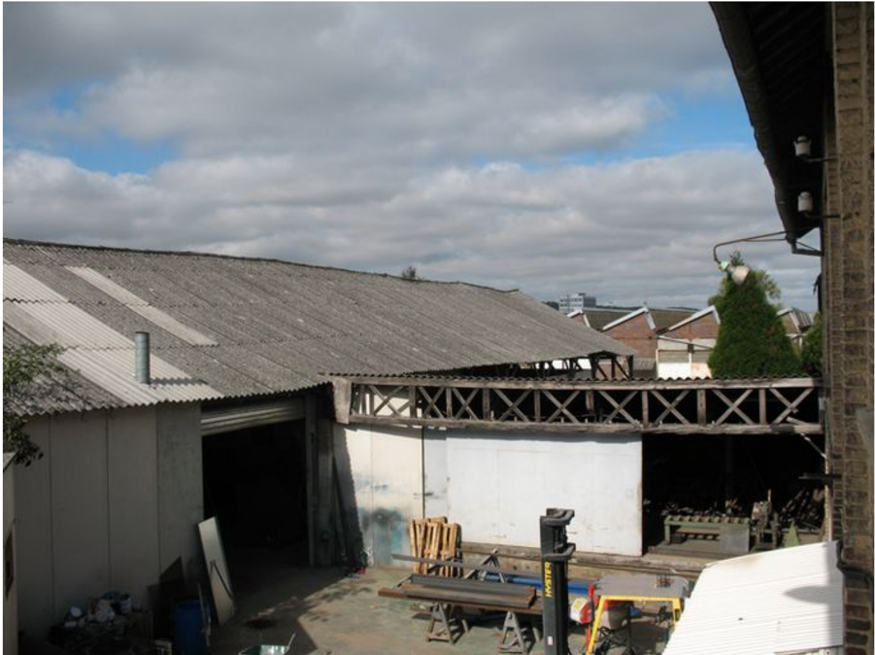
Ancien magasin de stockage des fûts.