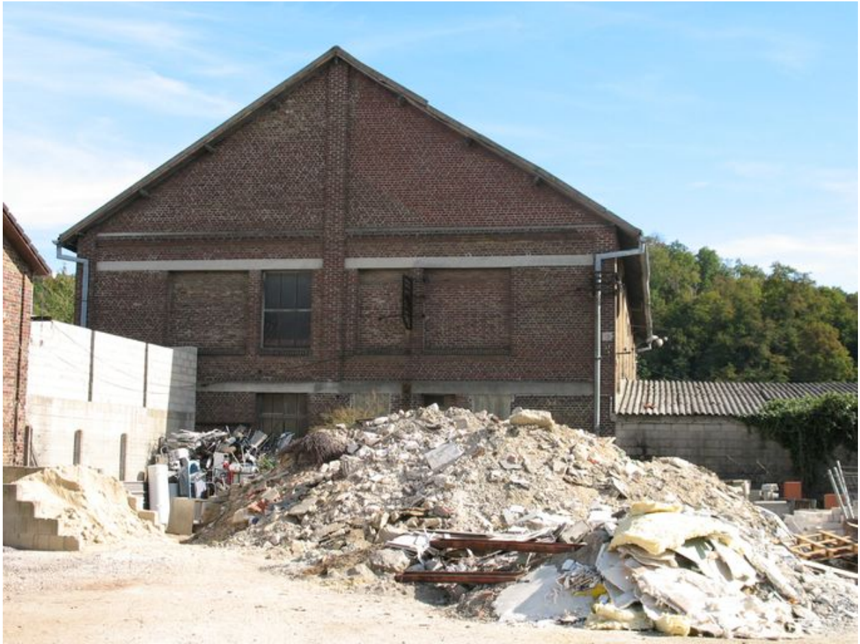
Pignon nord de l'ancien atelier des fûts d'emballage.