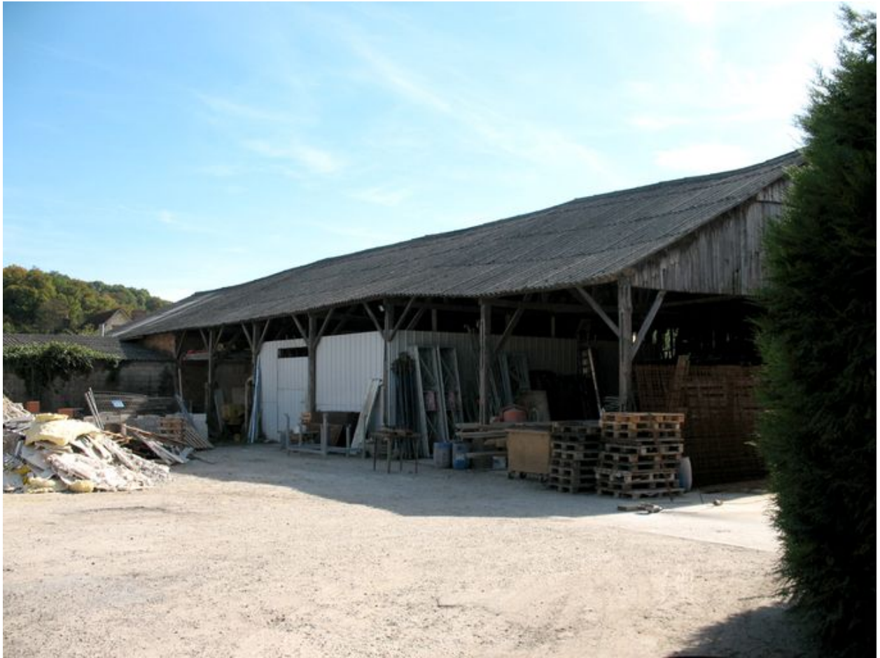
Hangar en bois construit pour le stock des fûts.