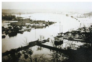
La tonnellerie sous les eaux de l'Oise lors de la crue de janvier 1926.