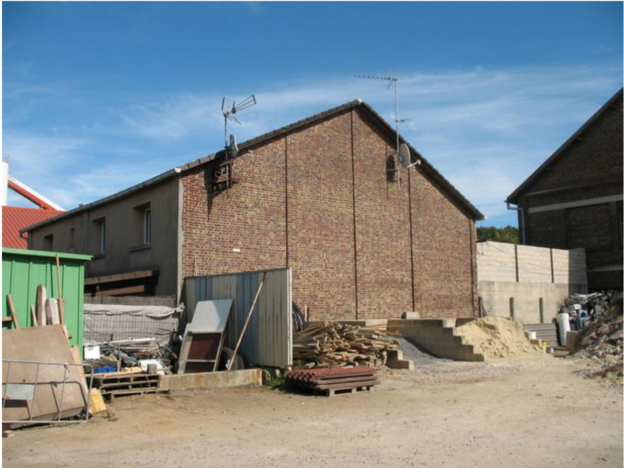
Ancienne centrale transformée en maison d'habitation.