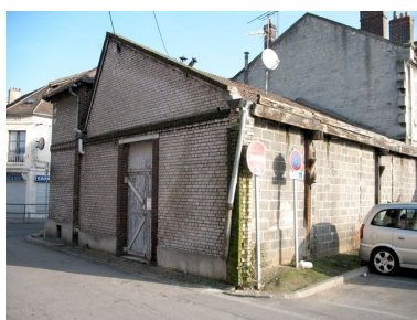
Vestige d'une travée en shed de l'atelier de menuiserie (Nogent-sur-Oise).