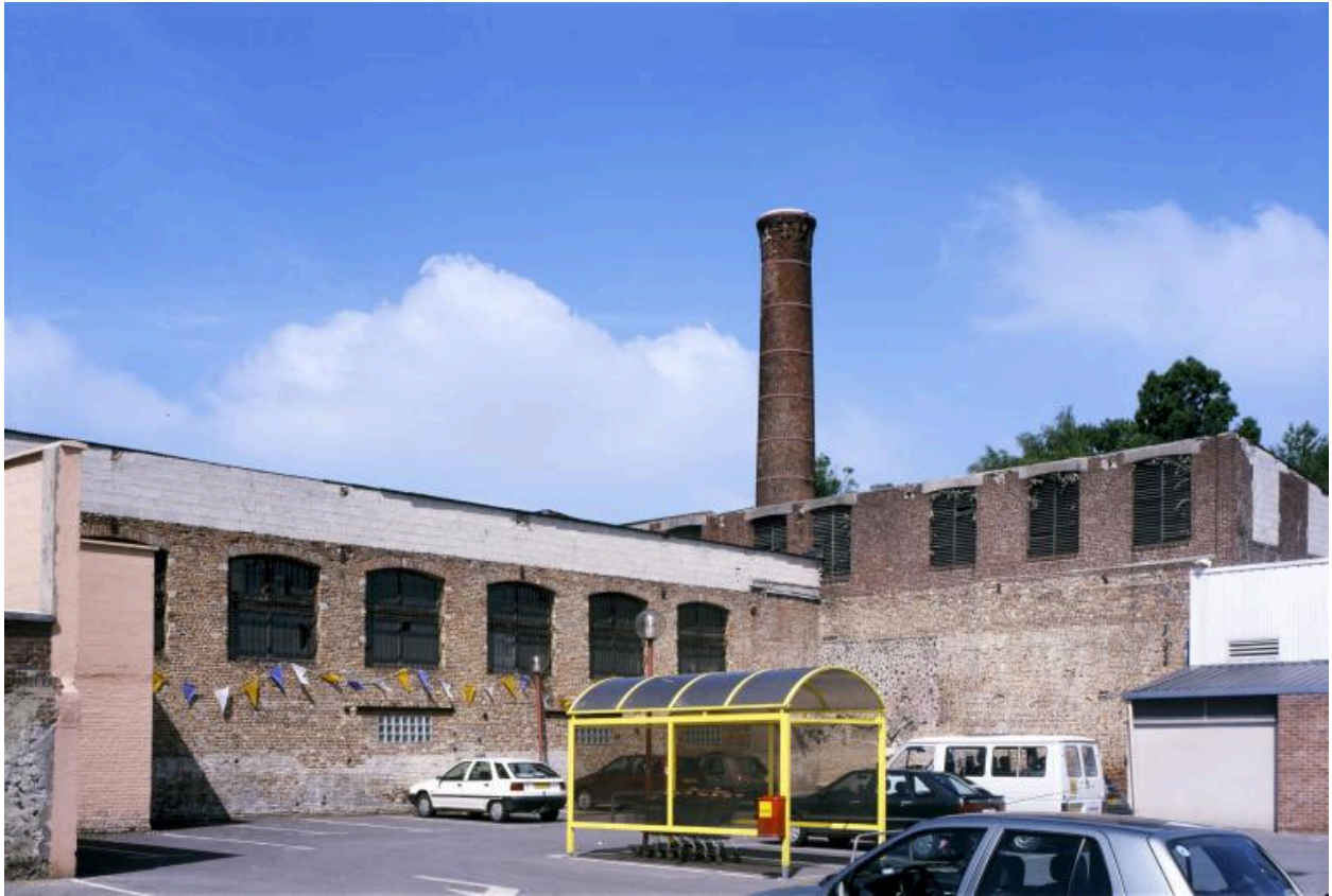
Vue depuis des bâtiments subsistants de l'ancienne tannerie, aujourd'hui annexés en partie par un centre commercial et son parc de stationnement.