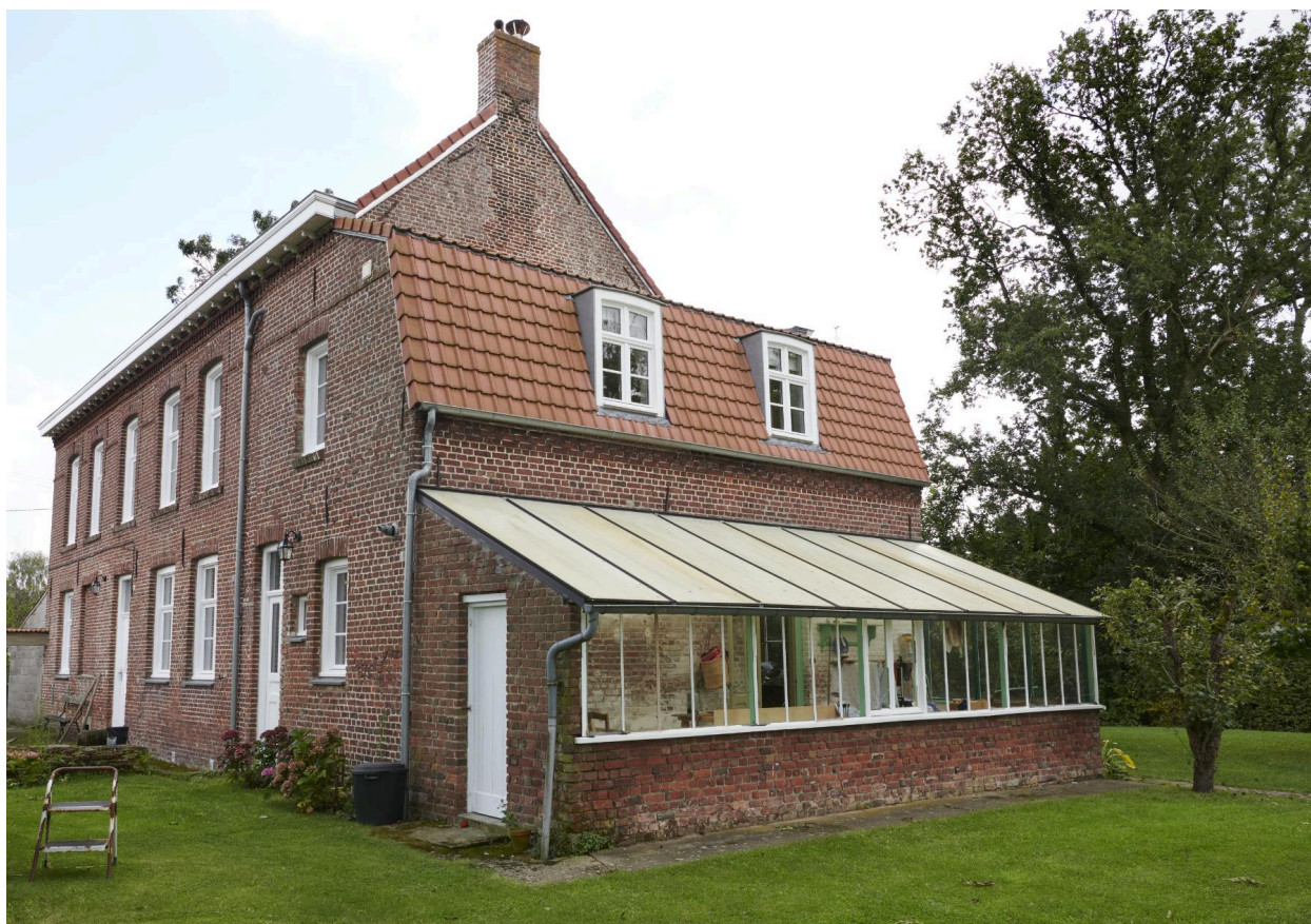
Pignon ouest et arrière du bâtiment.