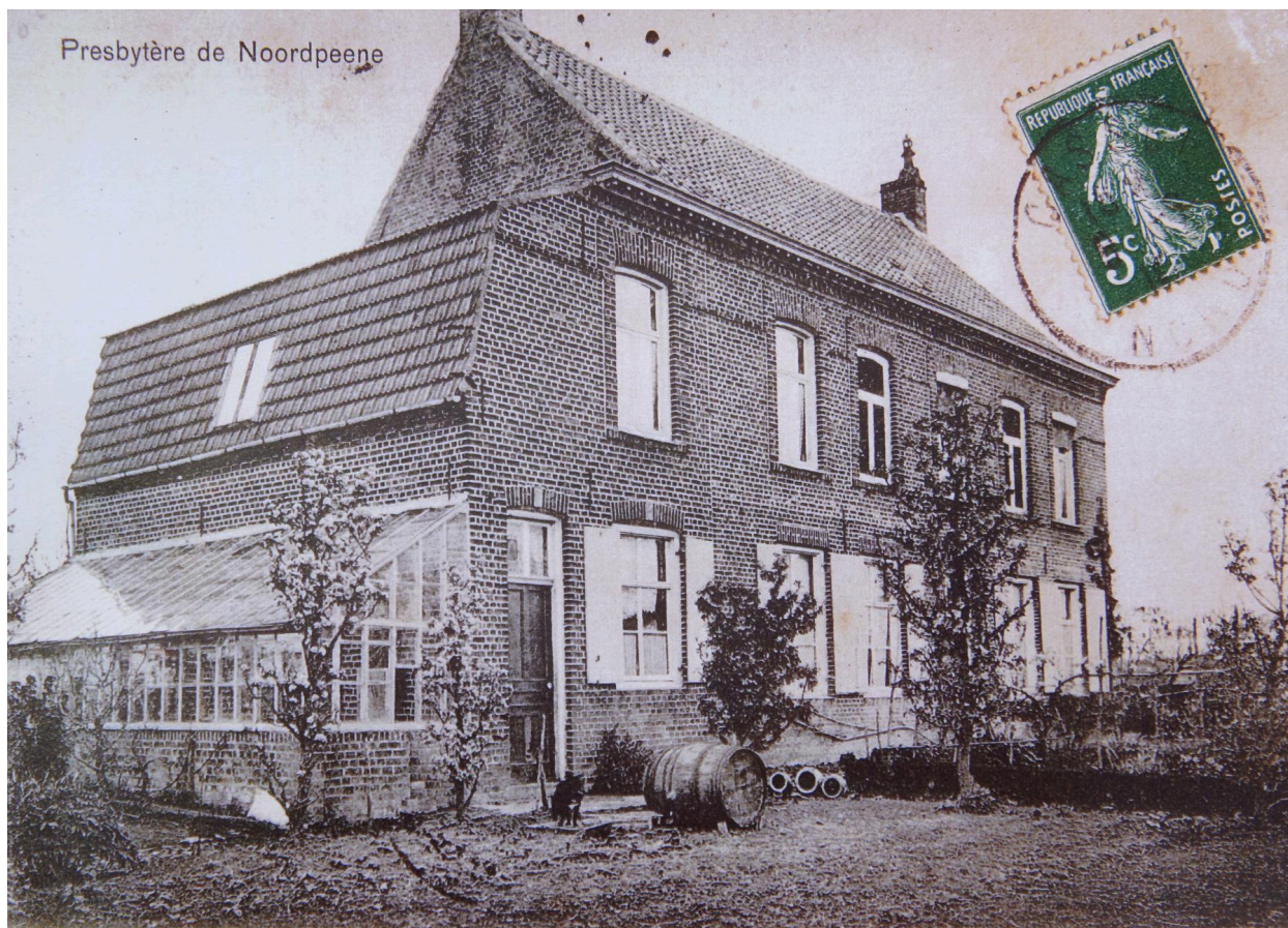
Presbytère de Noordpenne, carte postale du début XXe siècle.