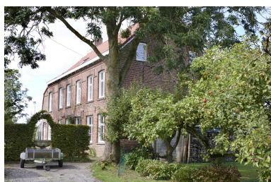
Vue du presbytère depuis la place. IVR32_20245903055NUCA