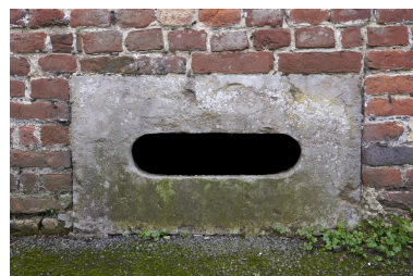
Sourpirail de cave en grès. IVR32_20245903109NUCA