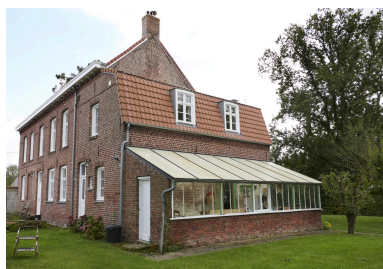
Pignon ouest et arrière du bâtiment.