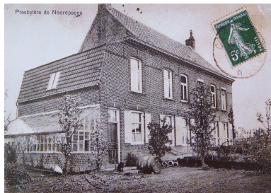
Presbytère de Noordpenne, carte postale du début XXe siècle. IVR32_20245903104NUCA