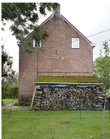
Pignon est. IVR32_20245903106NUCA