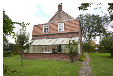
Pignon ouest. IVR32_20245903102NUCA