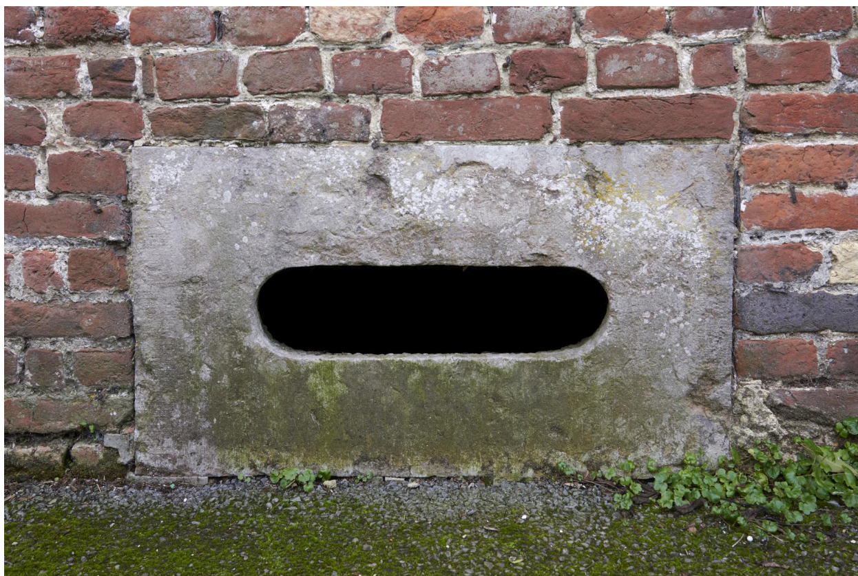
Sopirail de cave en grès.