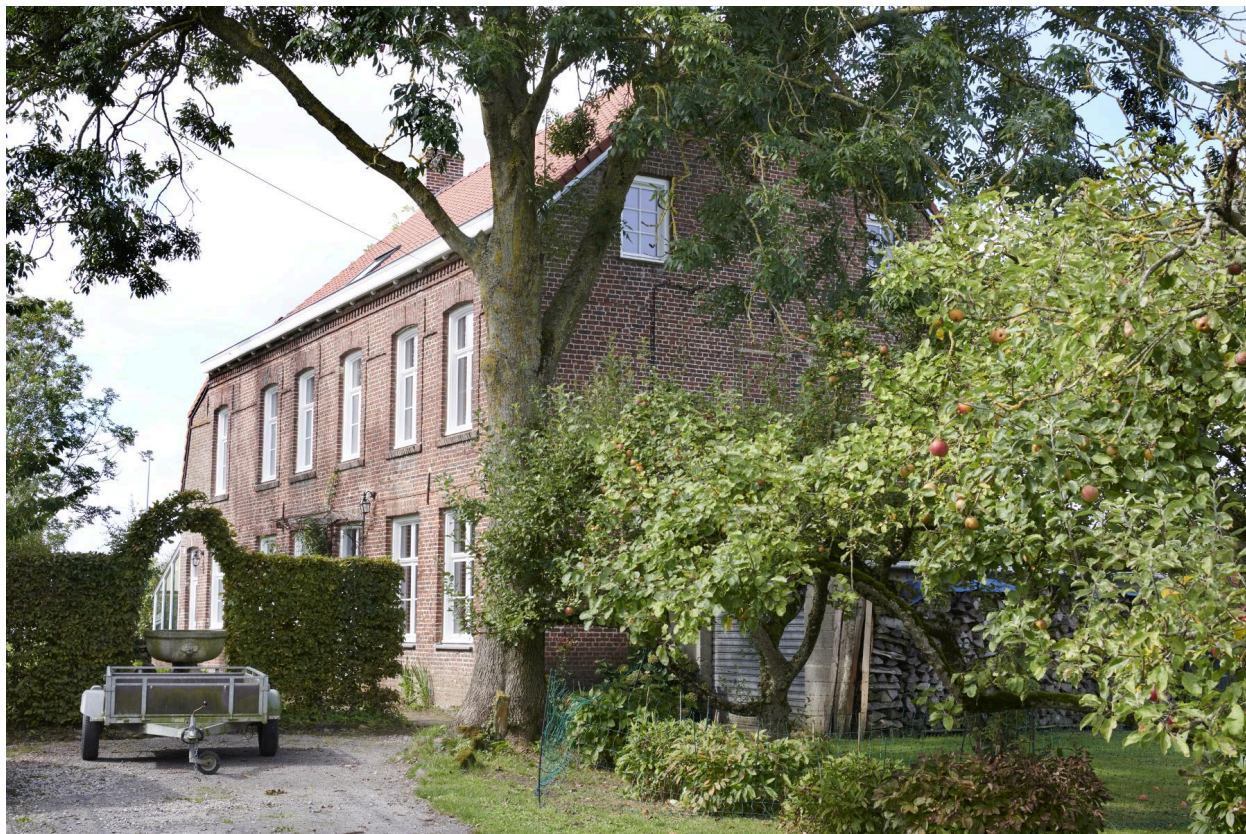
Vue du presbytère depuis la place.