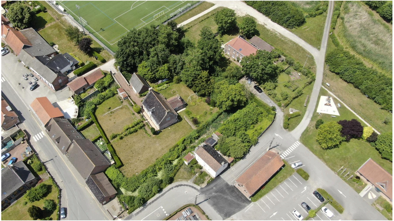
Vue aérienne du presbytère, au second plan, en haut de la photo.