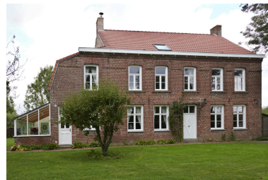
Façade sud, donnant sur le jardin. IVR32_20245903101NUCA