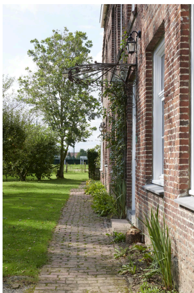
Détail du trottoir de briques qui longe la façade sud. IVR32_20245903105NUCA