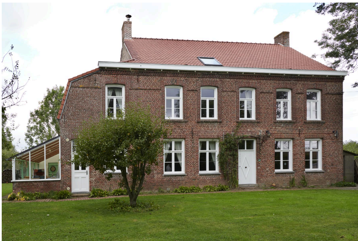
Façade sud, donnant sur le jardin.