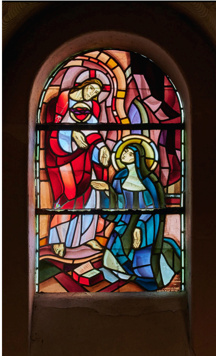
Verrière. La révélation du Sacré-Cœur de Jésus à sainte Marguerite-Marie Alacoque