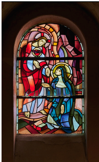
Verrière. La révélation du Sacré-Cœur de Jésus à sainte Marguerite-Marie Alacoque IVR32_20226200215NUCA