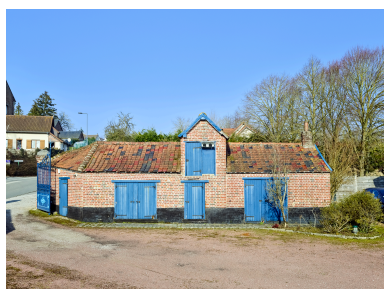
Vue sud de l'ancien poulailler et pigeonnier, depuis la cour. IVR32_20258000130NUCA