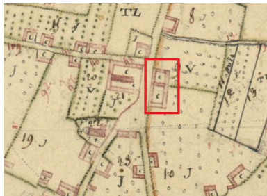
Plan de la ferme, extrait du plan masses de cultures, 1804 (AD Somme ; 3 P 1010). IVR32_20258005548NUCA