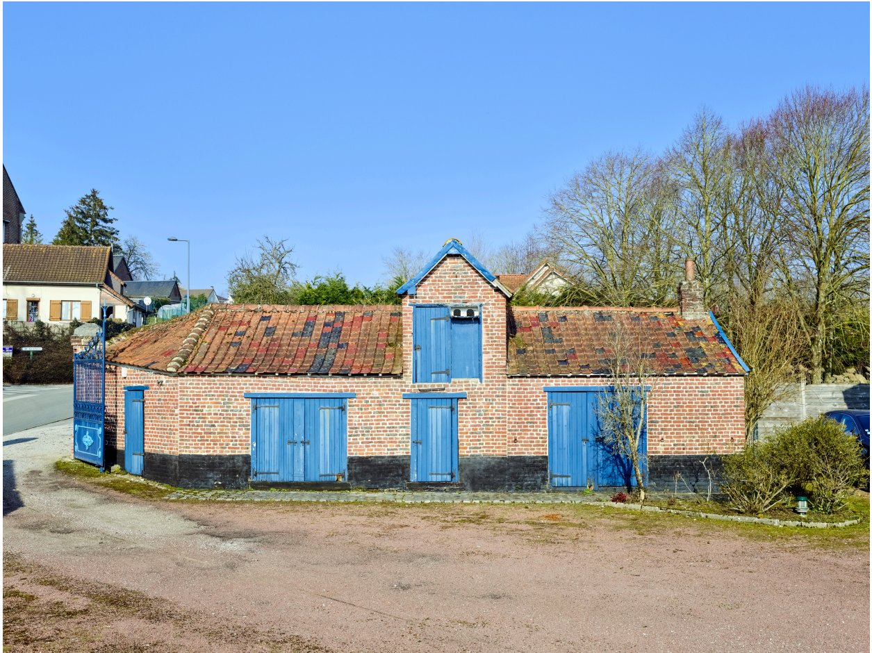
Vue sud de l'ancien poulailler et pigeonnier, depuis la cour.