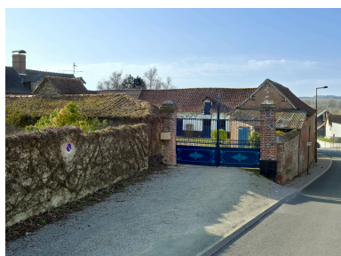
Vue de l'entrée de la ferme, depuis le nord. IVR32_20258001498NUCA