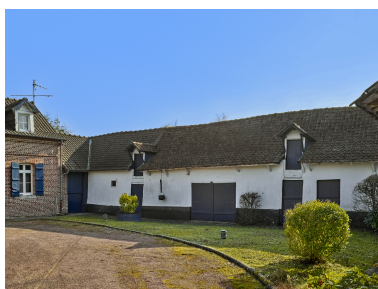
Vue nord d'un ancien édifice agricole, depuis la cour. IVR32_20258000132NUCA