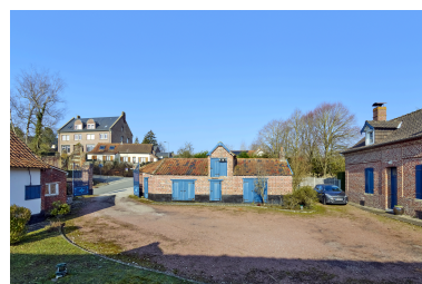
Vue d'ensemble de la cour, depuis le sud.