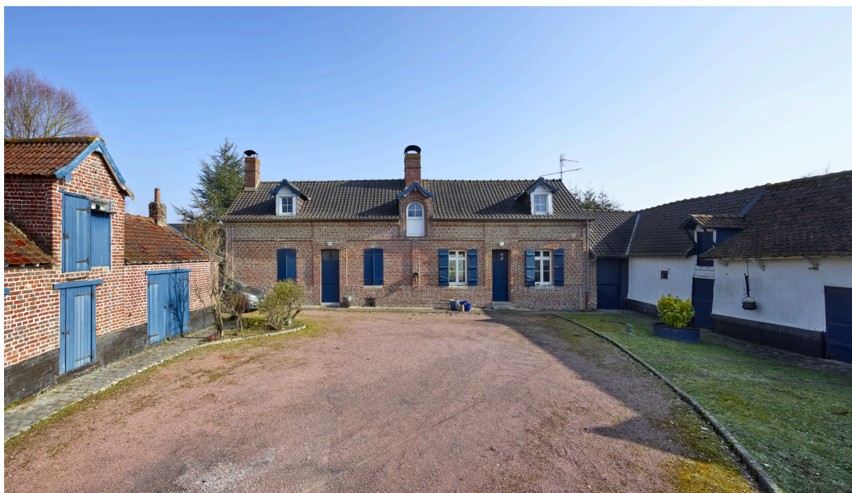
Vue ouest de la maison, depuis la cour.