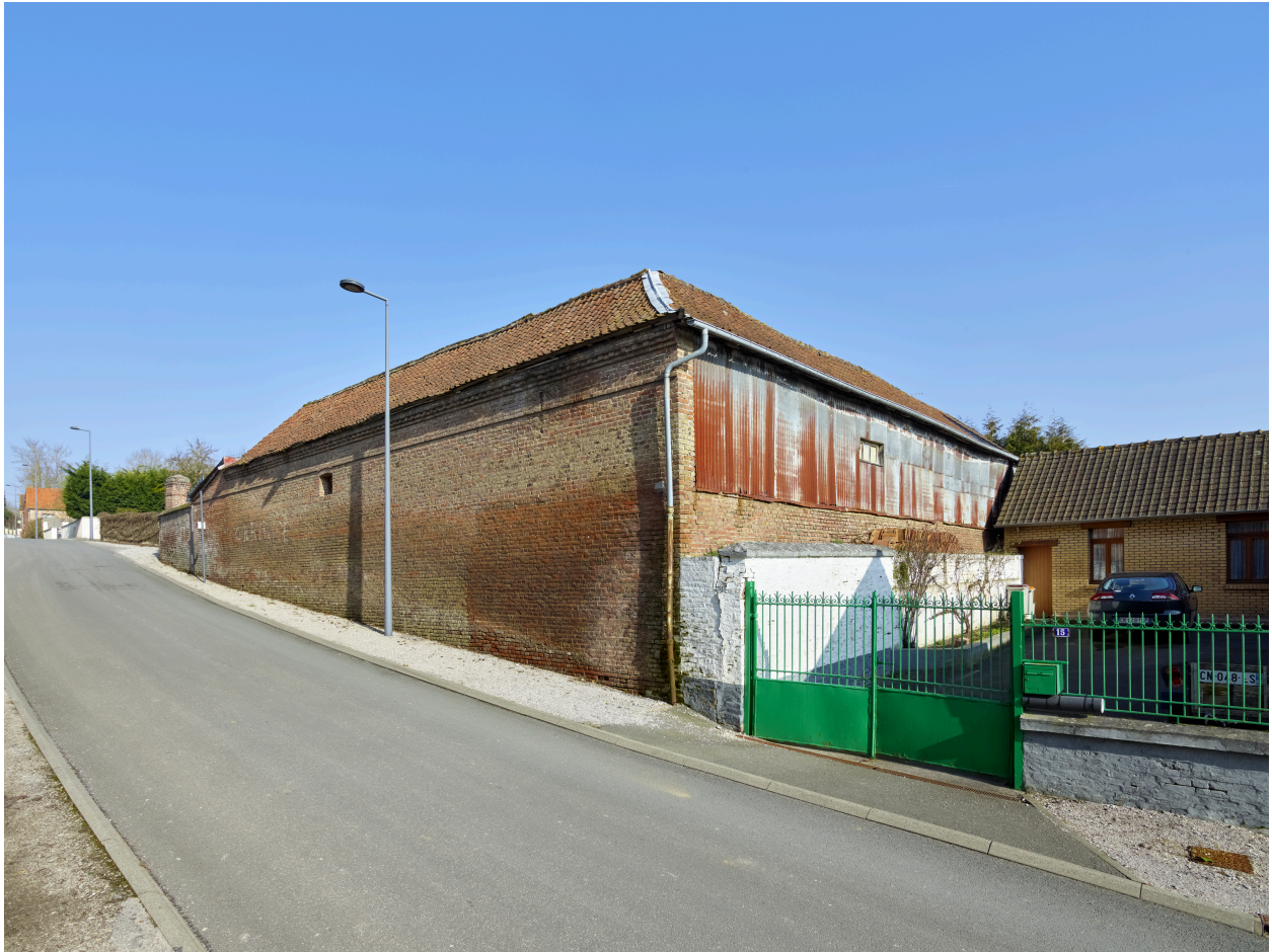
Vue sud-ouest de l'ancienne ferme, depuis la rue.