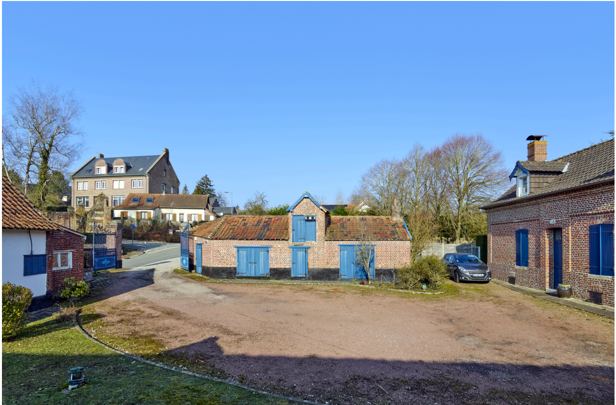
Vue d'ensemble de la cour, depuis le sud.