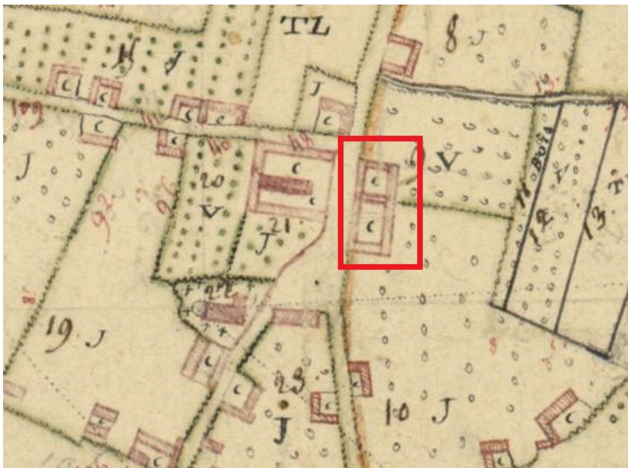
Plan de la ferme, extrait du plan masses de cultures, 1804 (AD Somme ; 3 P 1010).