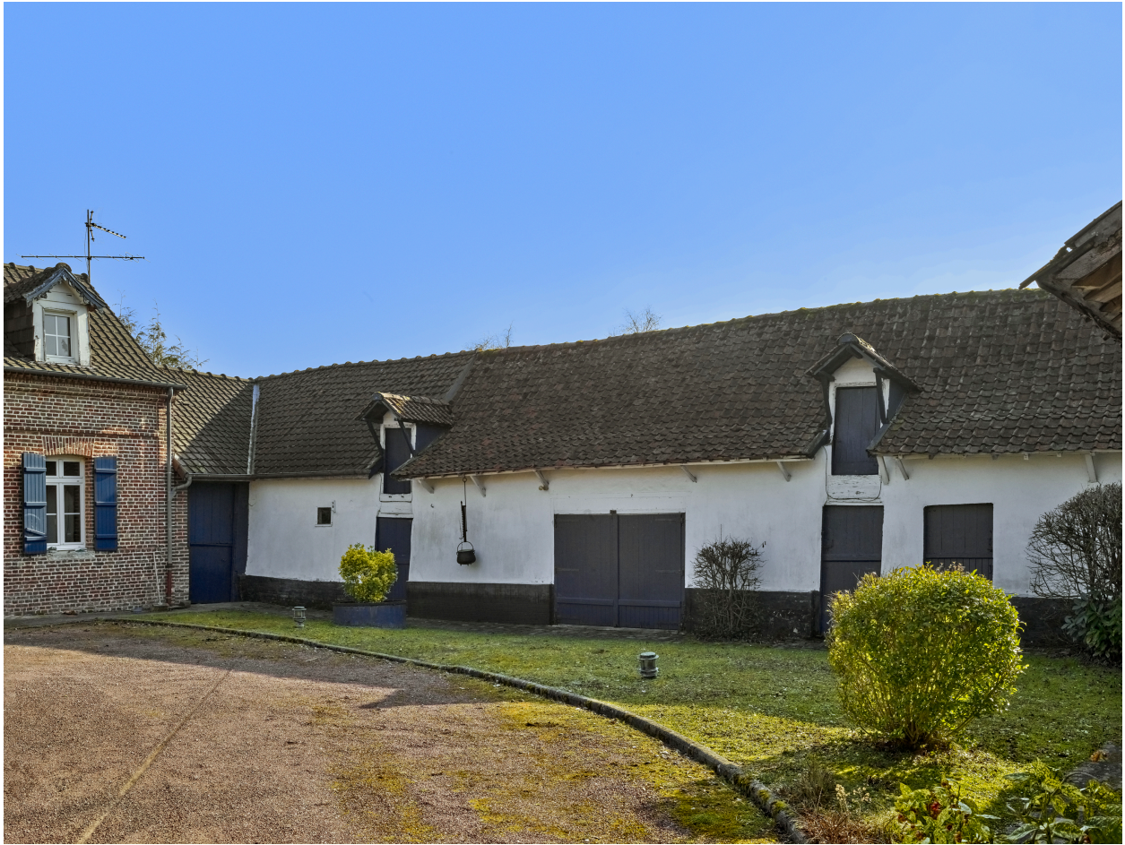
Vue nord d'un ancien édifice agricole, depuis la cour.