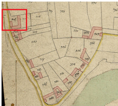
Plan masse de la ferme, extrait du plan parcellaire de la commune de Grand-Laviers, dit cadastre napoléonien Section C, [s.d.] (AD Somme ; 3 P 1376/4). IVR32_20258005549NUCA