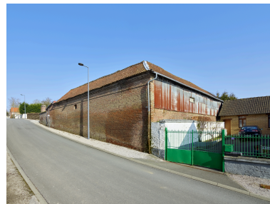
Vue sud-ouest de l'ancienne ferme, depuis la rue.