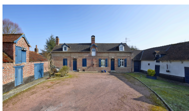
Vue ouest de la maison, depuis la cour.