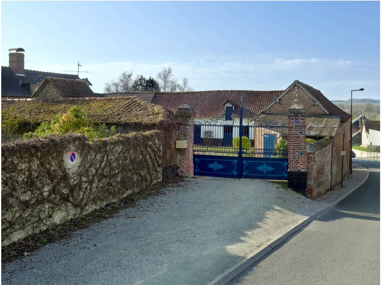
Vue de l'entrée de la ferme, depuis le nord.