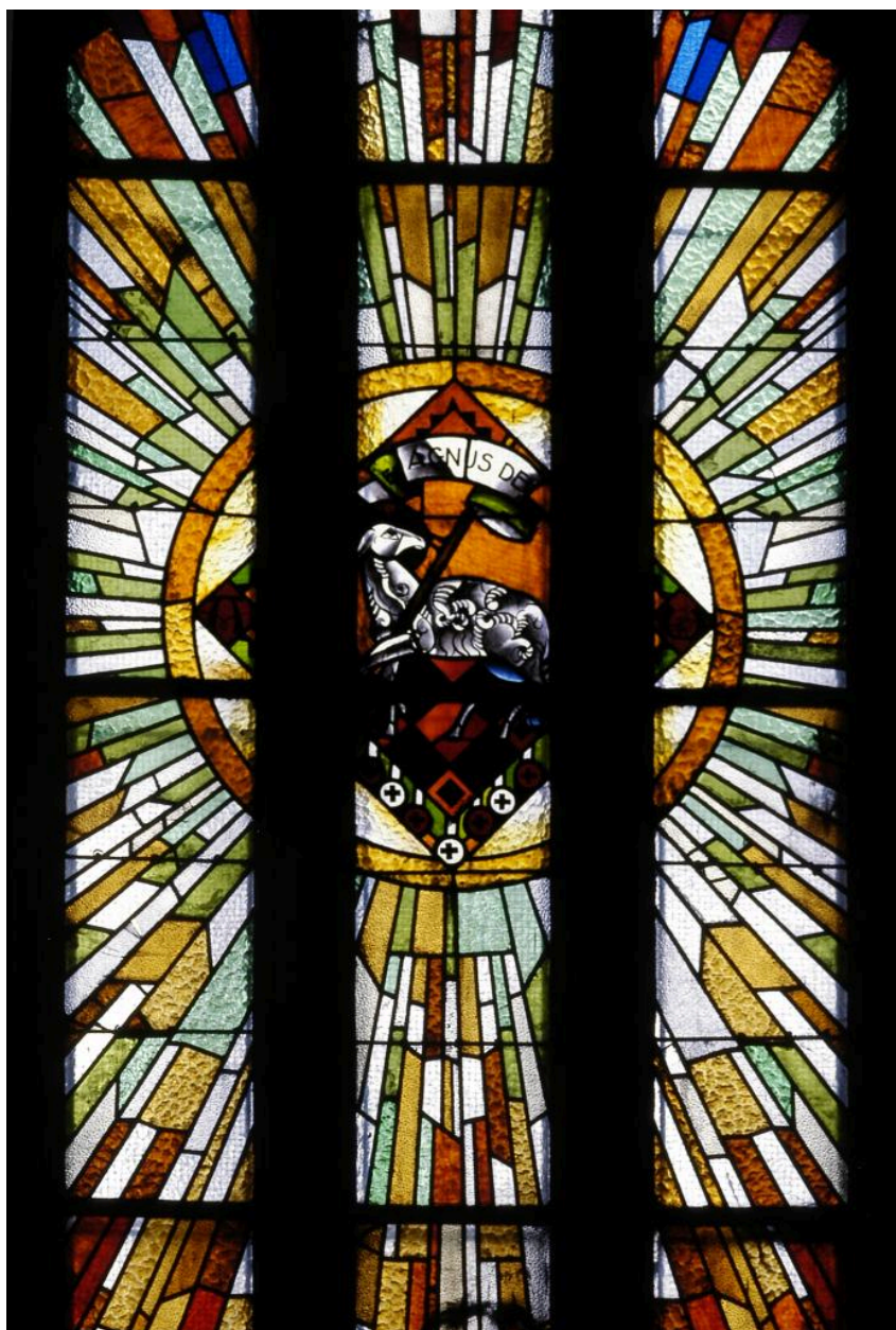
Partie centrale de la verrière de la baie 4 : l'Agneau de Dieu.