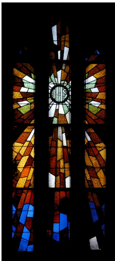
Vue générale de la verrière de la baie 2 : monogramme IHS.