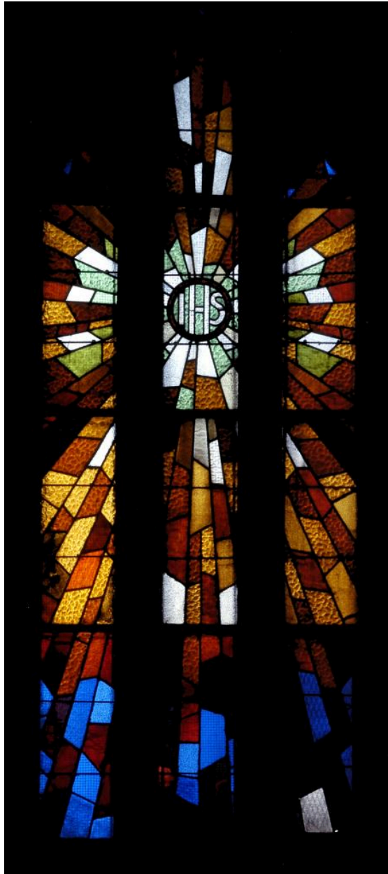
Vue générale de la verrière de la baie 2 : monogramme IHS.