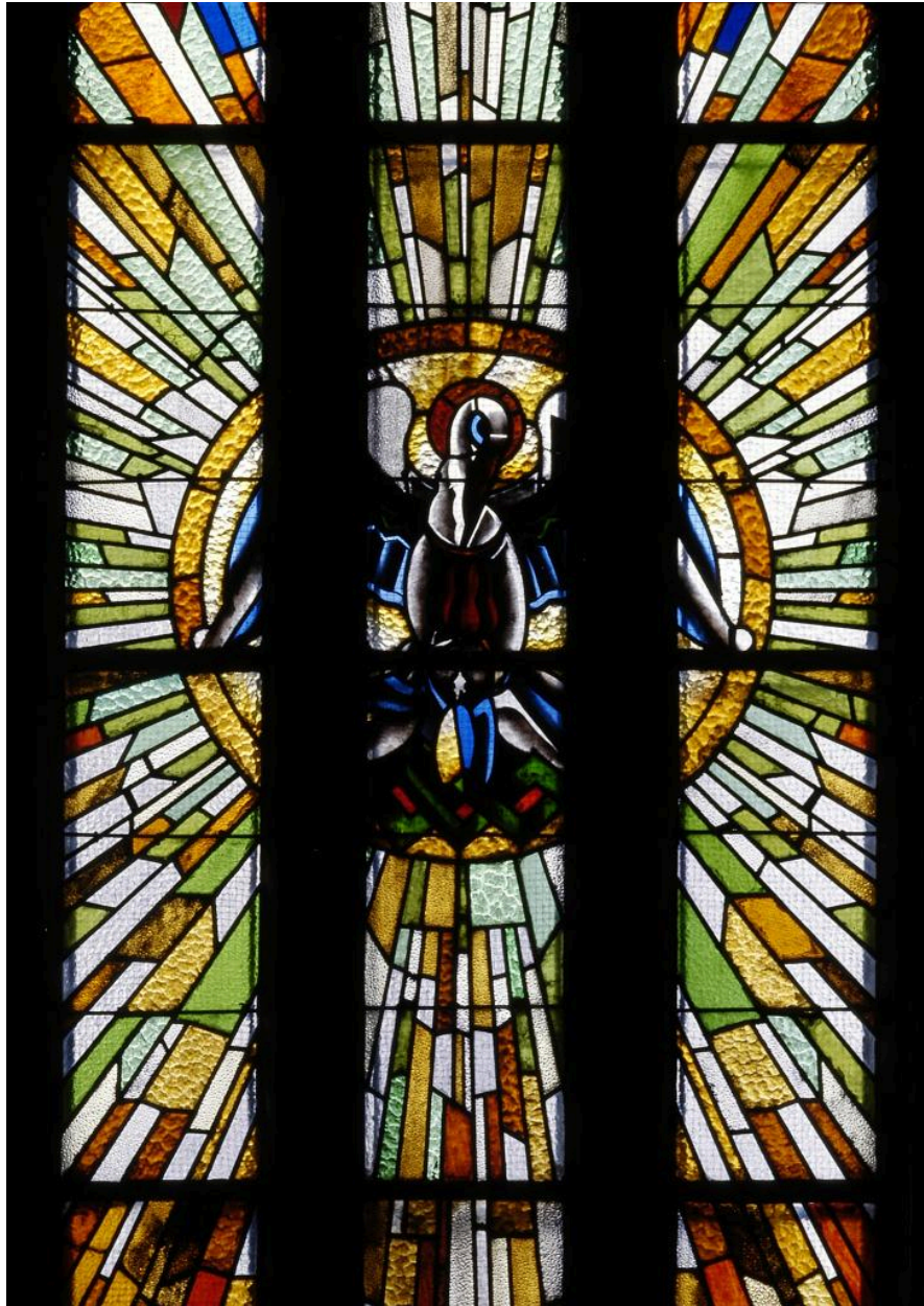
Partie centrale de la verrière de la baie 3 : le Pélican mystique.