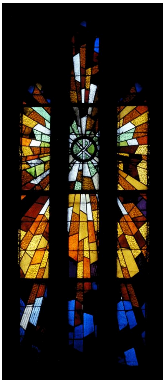
Vue générale de la verrière de la baie 1 : chrisme.