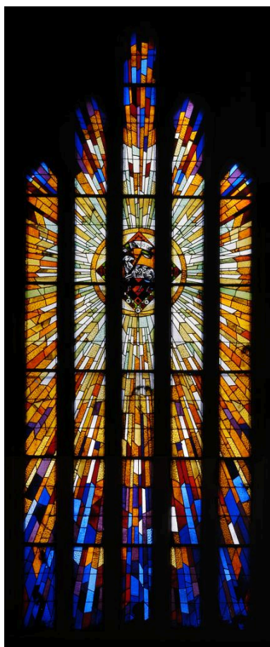
Vue générale de la verrière de la baie 4 : l'Agneau de Dieu.