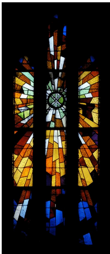
Vue générale de la verrière de la baie 1 : chrisme. IVR22_20060200705XA