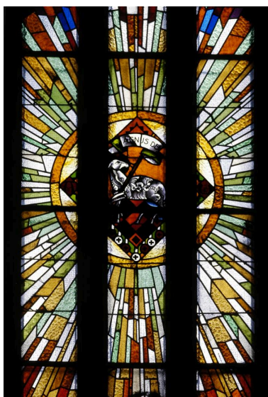
Partie centrale de la verrière de la baie 4 : l'Agneau de Dieu.