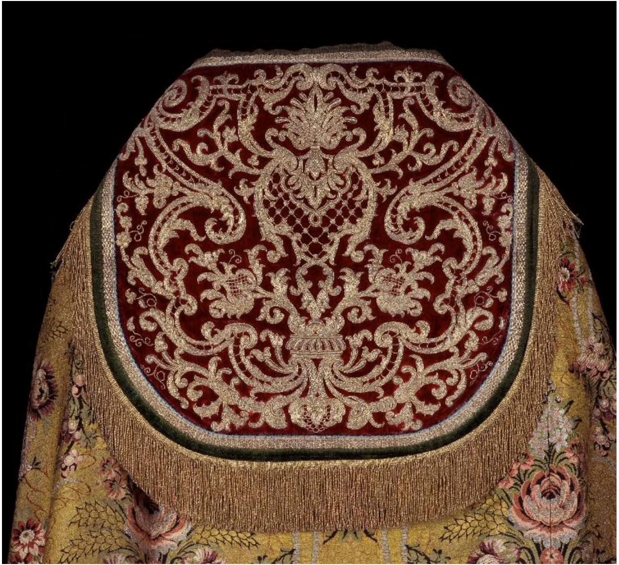
Détail du chaperon à rinceaux.