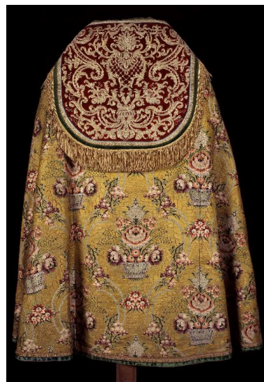
Vue du dos de la chape avec le chaperon à rinceaux.