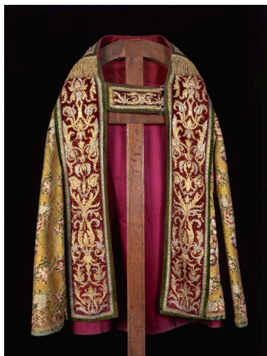
Vue du devant d'une des chapes. IVR22_19956000975XA