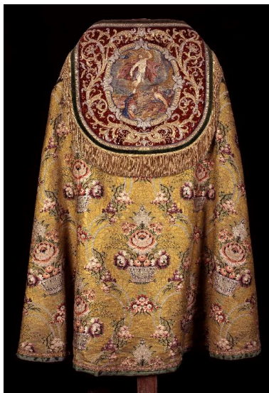
Vue du dos de la chape avec le chaperon illustrant la Résurrection. IVR22_19956000977XA