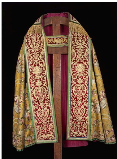
Vue du devant d'une des chapes.