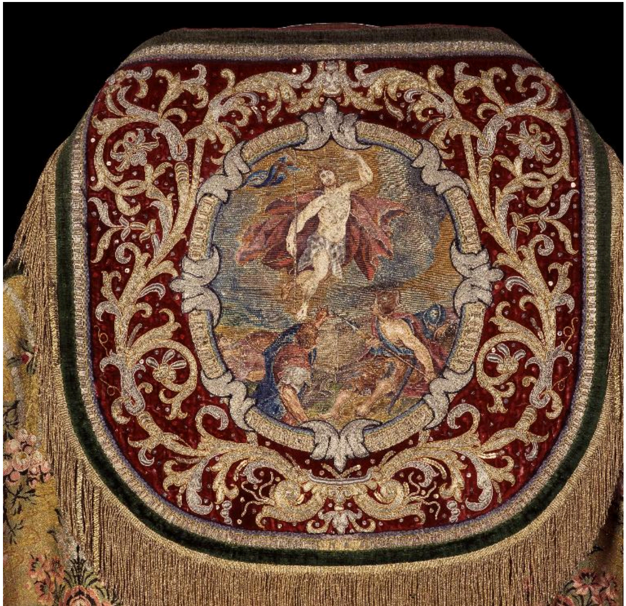
Détail du chaperon avec broderie représentant la Résurrection.