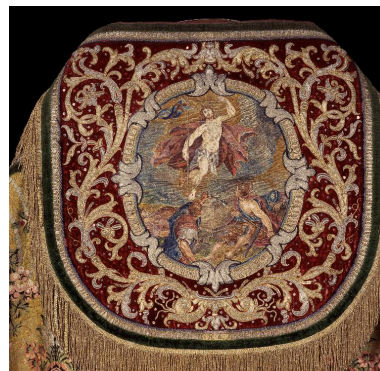
Détail du chaperon avec broderie représentant la Résurrection.