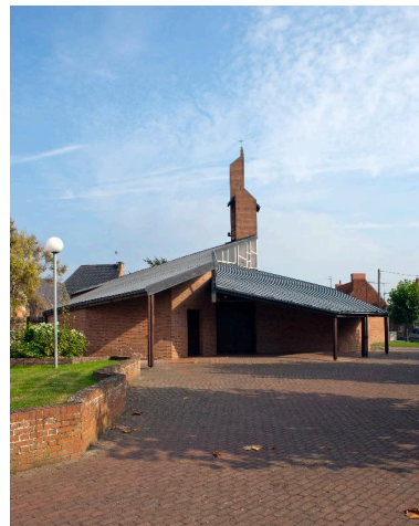
Vue de l'entrée. IVR31_20145903210NUCA