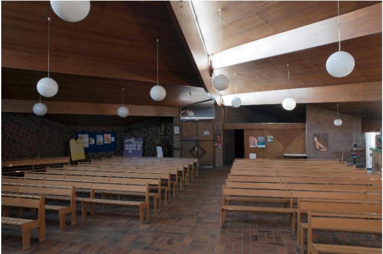
Nef : vue générale vers l'entrée.