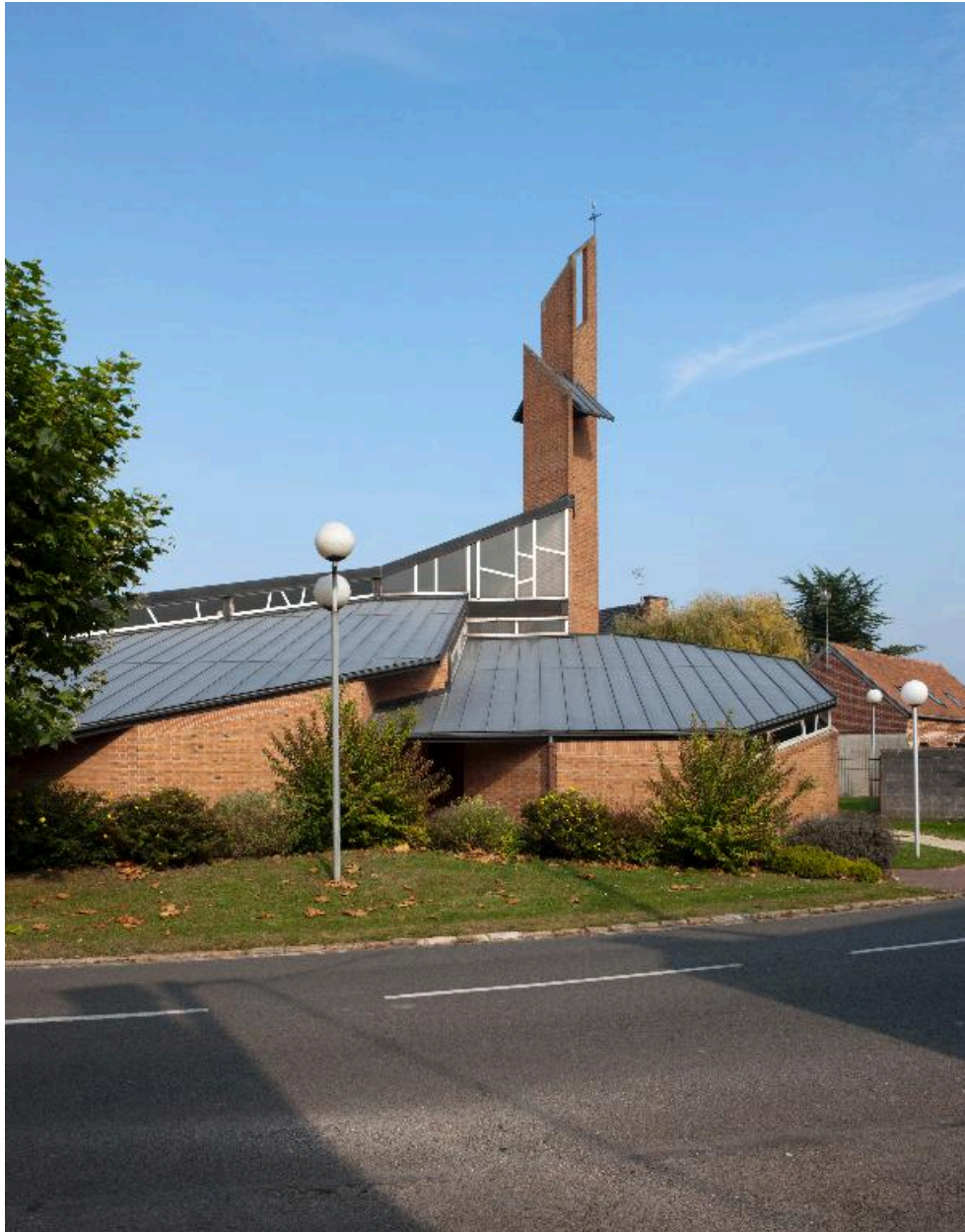
Vue partielle depuis la rue Colodomir-Bécar.