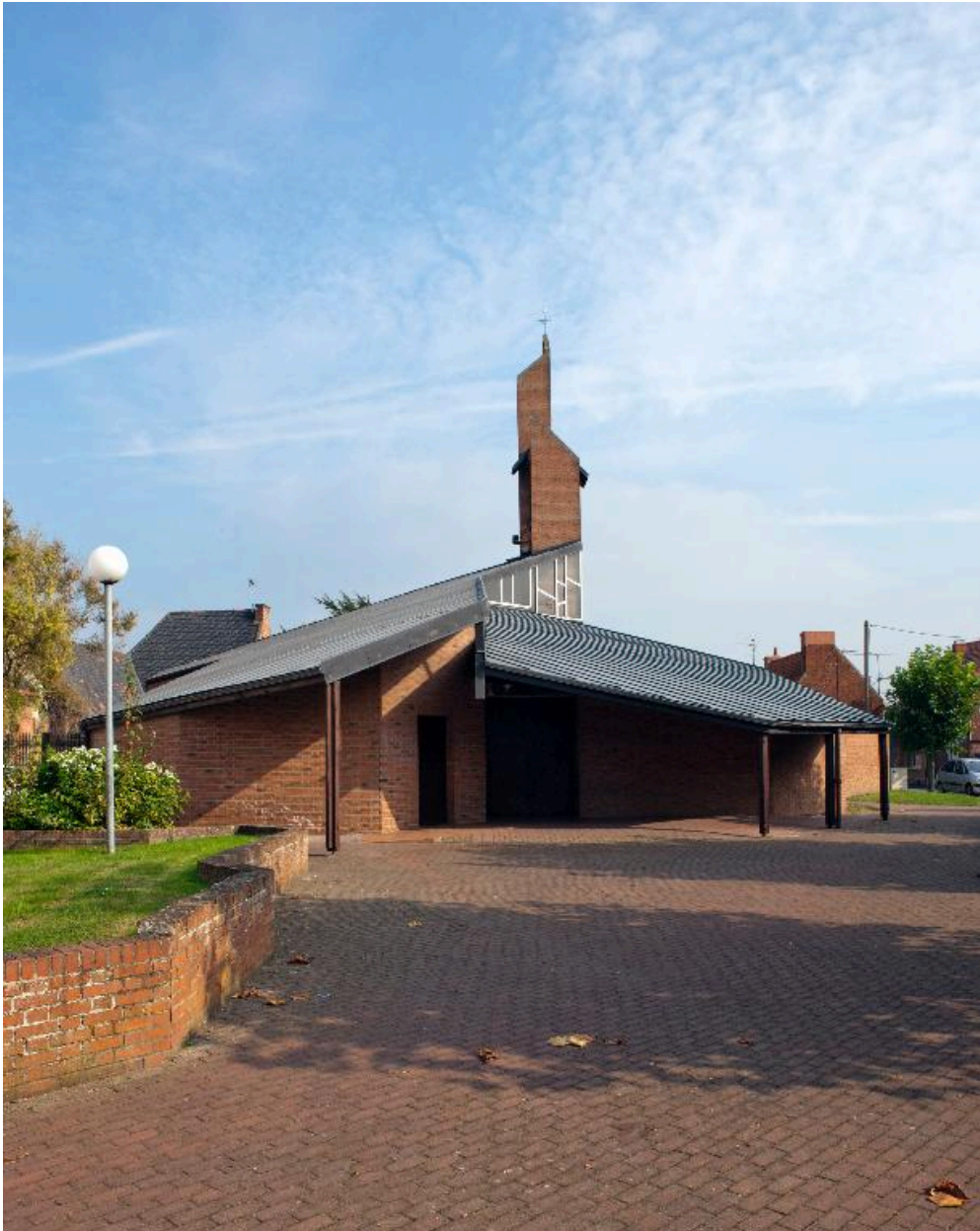
Vue de l'entrée.