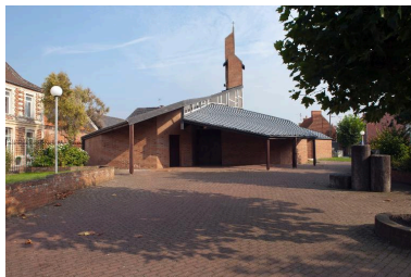
Vue générale. IVR31_20145903211NUCA