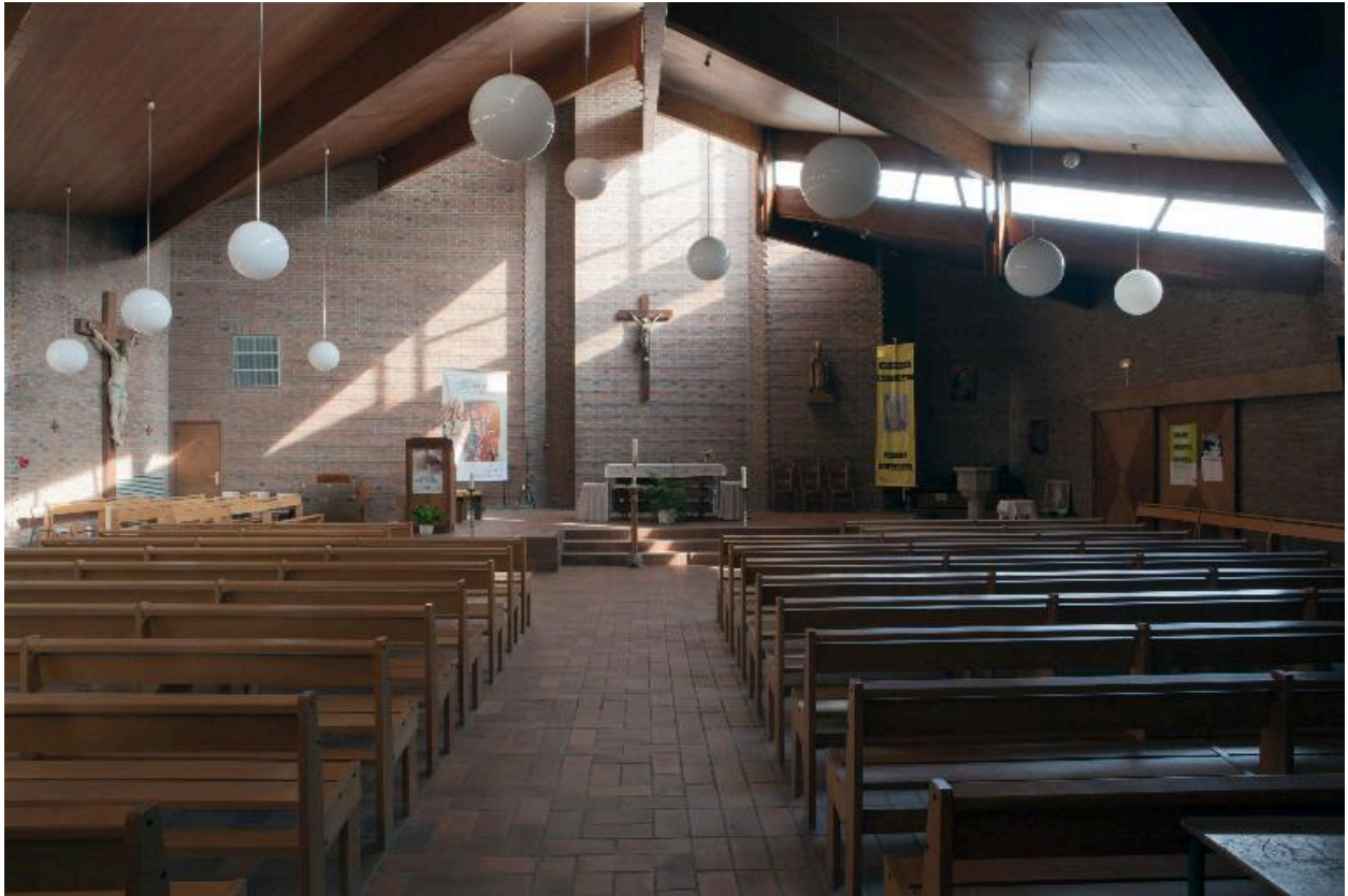
Nef : vue générale vers le chœur.