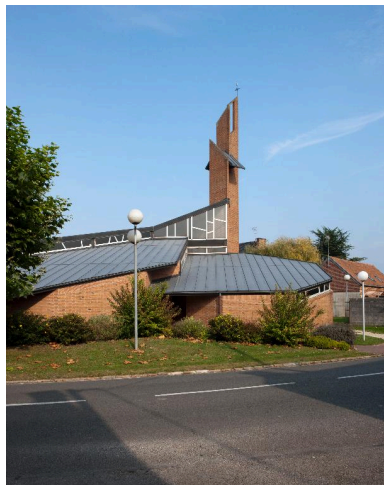
Vue partielle depuis la rue Colodomir-Bécar. IVR31_20145903209NUCA