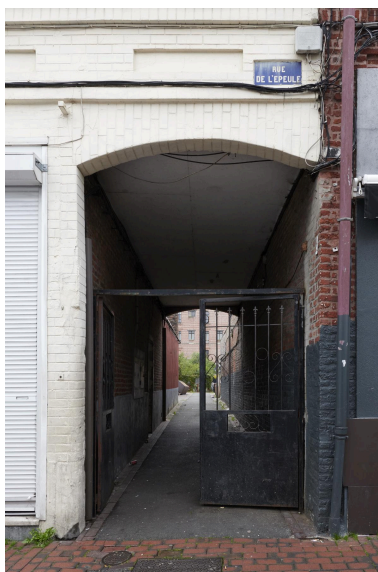
Cour Heuls, entrée. IVR32_20265900127NUCA