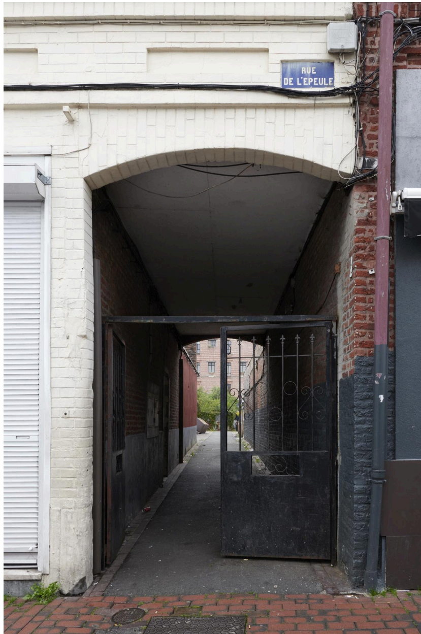
Cour Heuls, entrée.