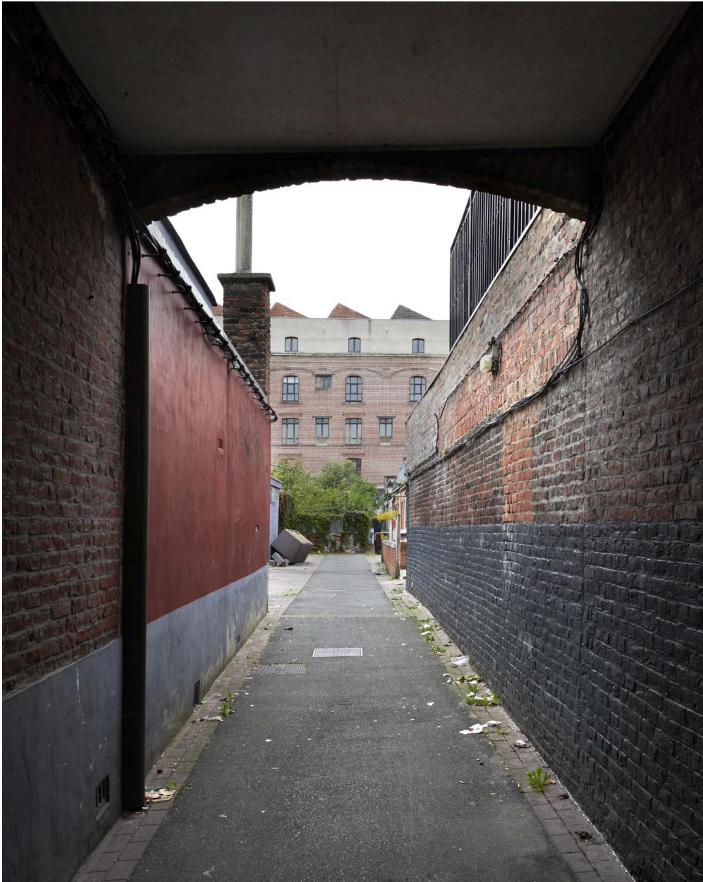
Cour vue depuis le porche, usine Roussel en arrière-plan.