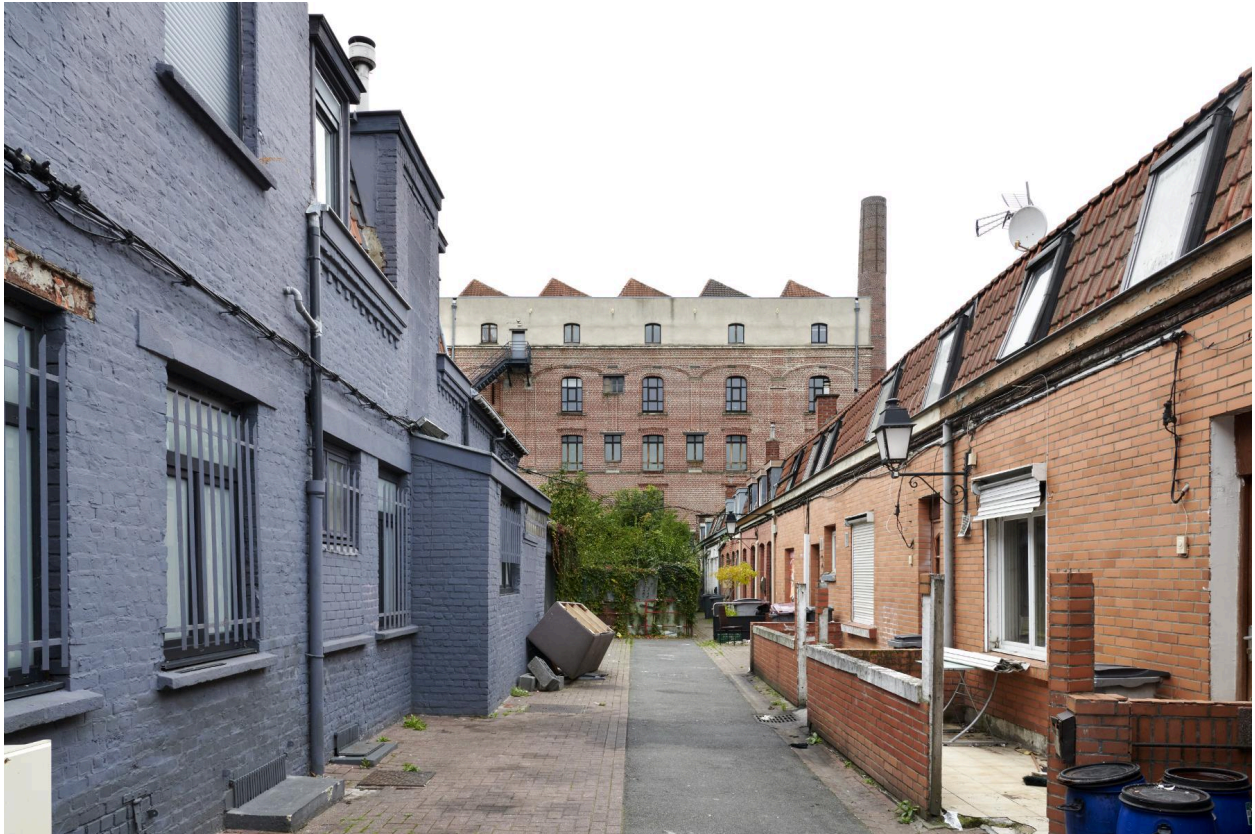
Cour vue de l'entrée, usine Roussel en arrière-plan.