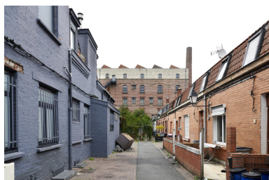
Cour vue de l'entrée, usine Roussel en arrière-plan. IVR32_20265900129NUCA