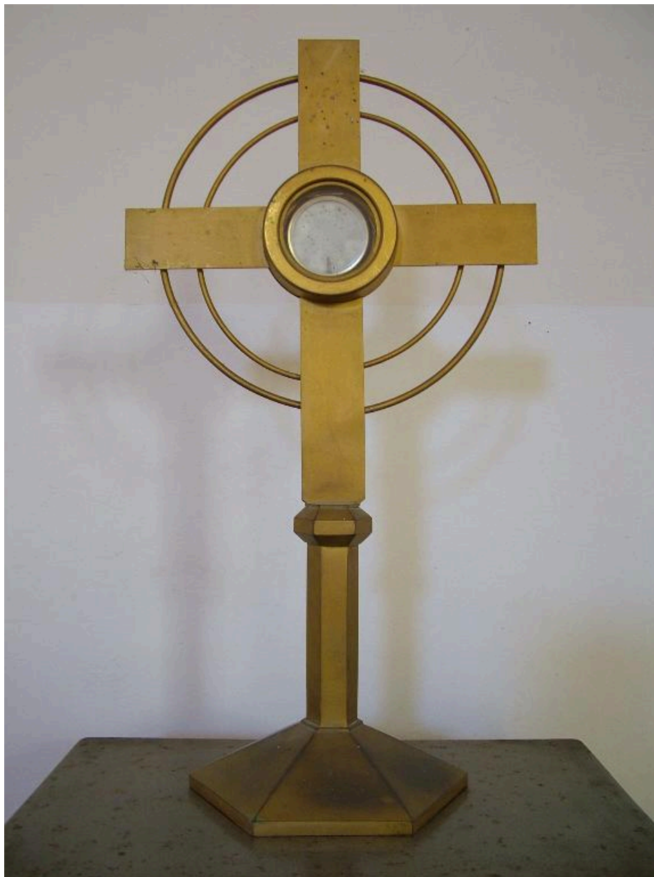
Croix d'autel, laiton, 2e quart 20e siècle.