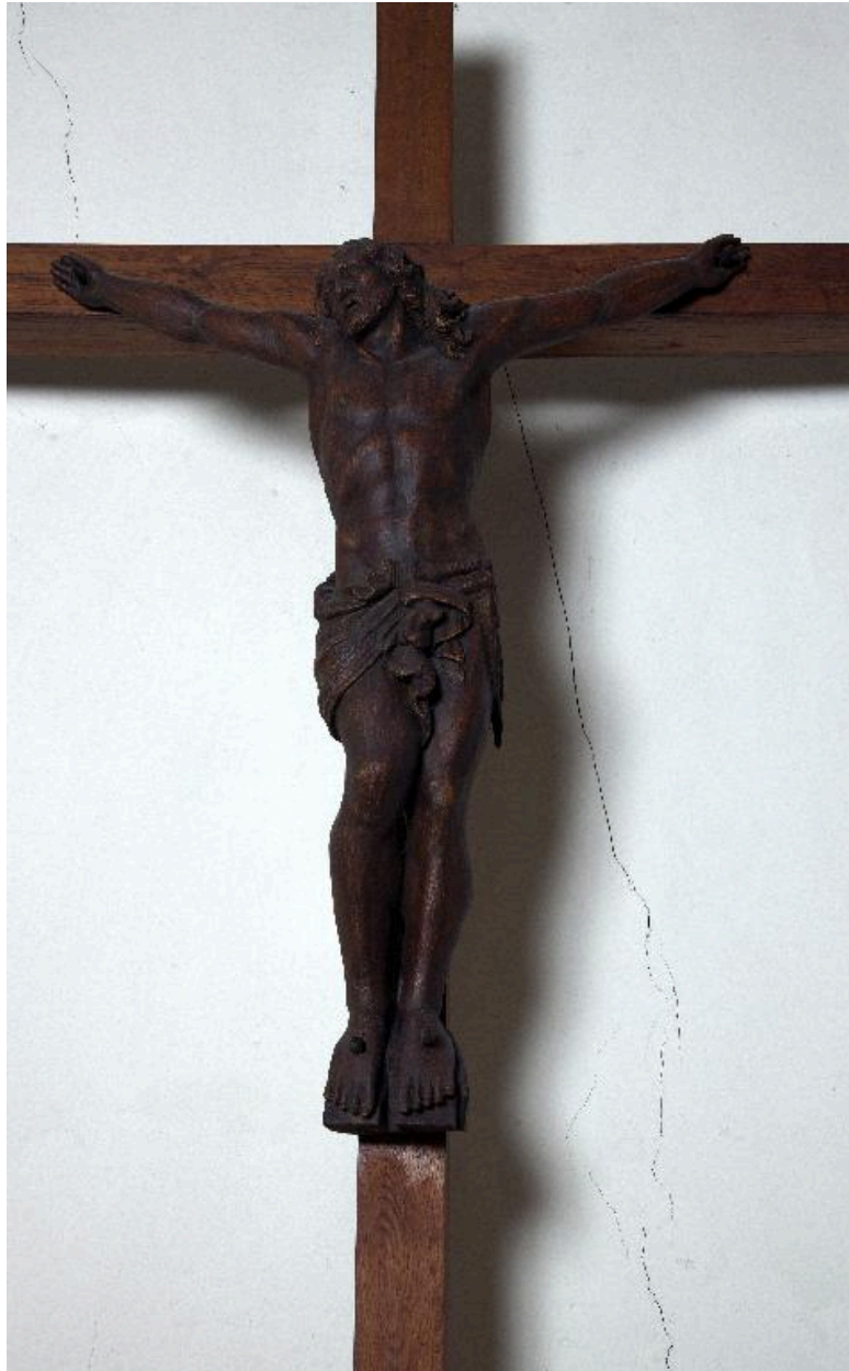
Christ en croix, chêne, 2e moitié 19e siècle, sur croix moderne.