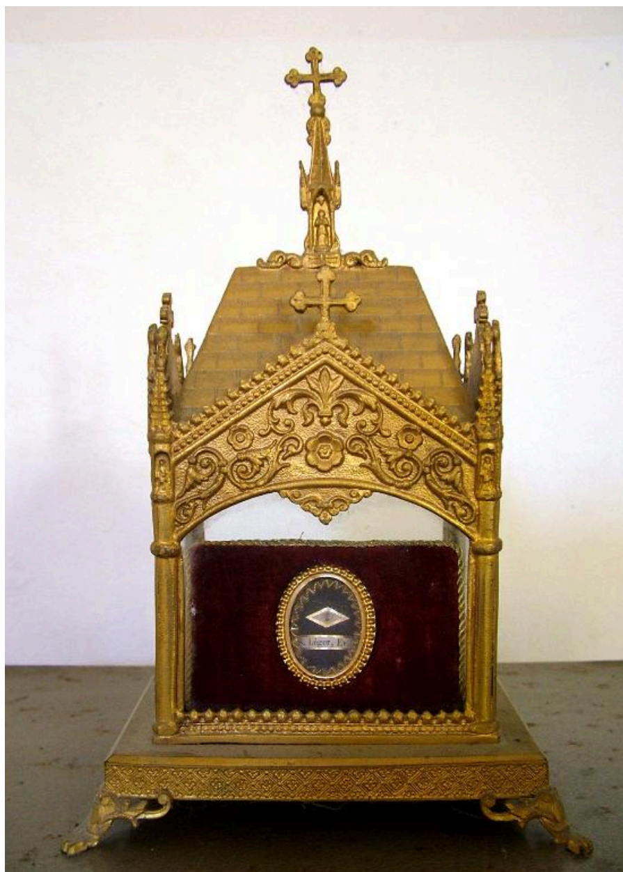
Châsse, laiton, limite 19e siècle 20e siècle.