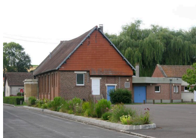
Vue arrière. IVR22_20088015063NUCA