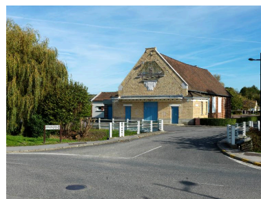
Vue générale. IVR22_20128001028NUC2A