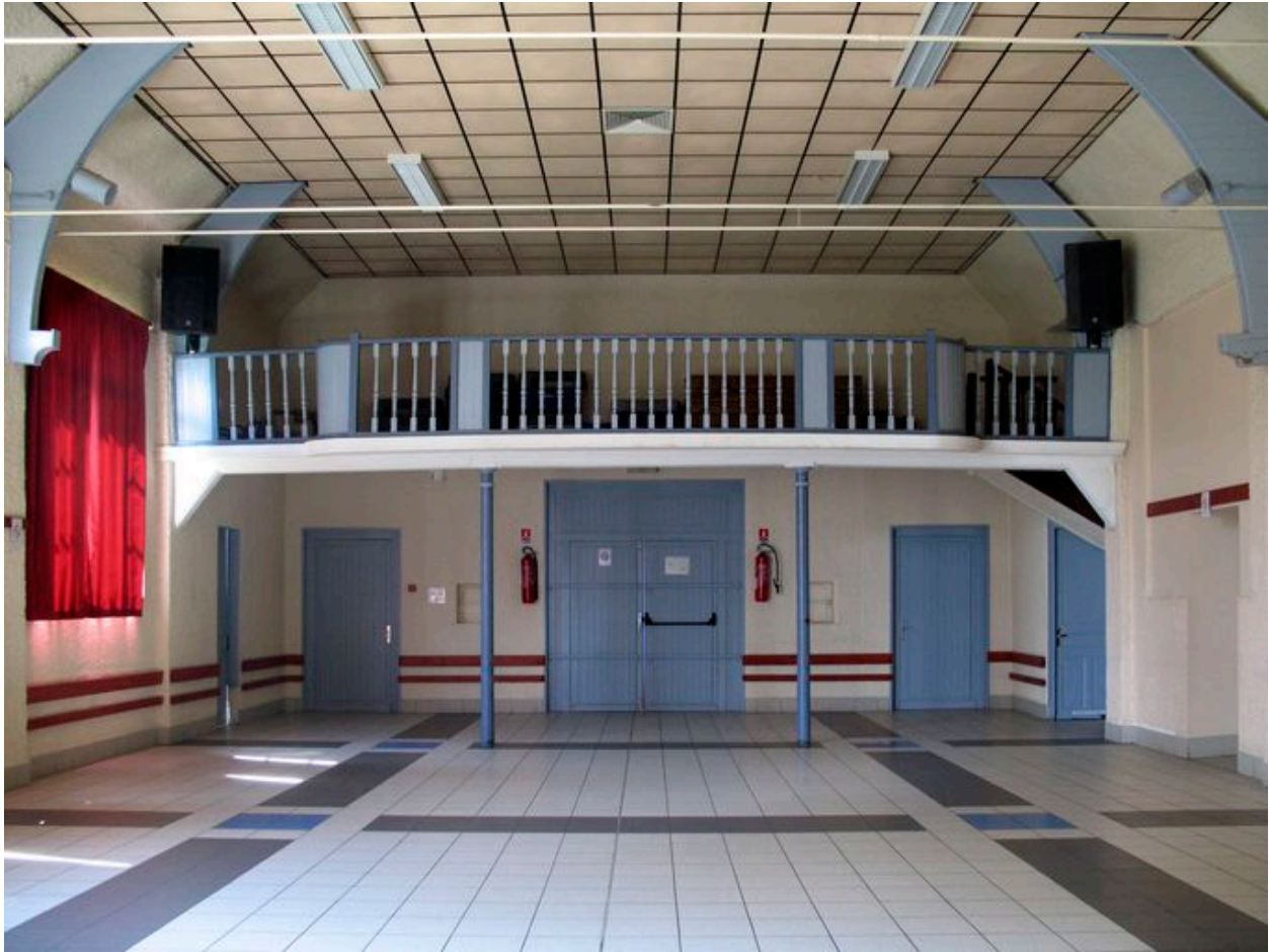
Vue intérieure vers la tribune.