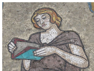
Détail du décor de mosaïque et de sgraffite du pignon : Allégorie des arts et de la culture.