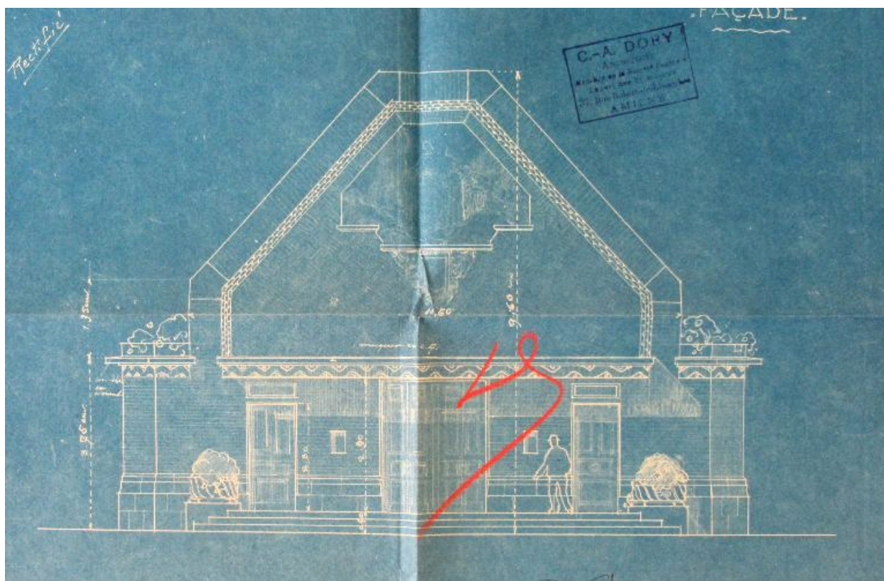
Élévation de la façade principale, par Dory, 1927 (AD Somme ; 99 O 3387).