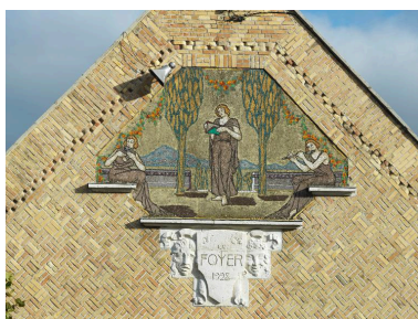
Détail du décor de mosaïque et sgraffite sur le pignon. IVR22_20128001029NUC2A