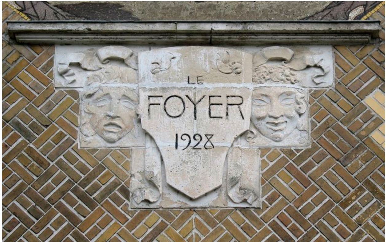
Détail de la date de 1928.