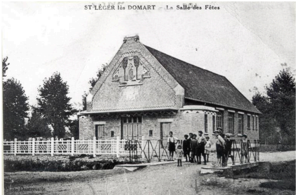
Vue générale, vers 1930.