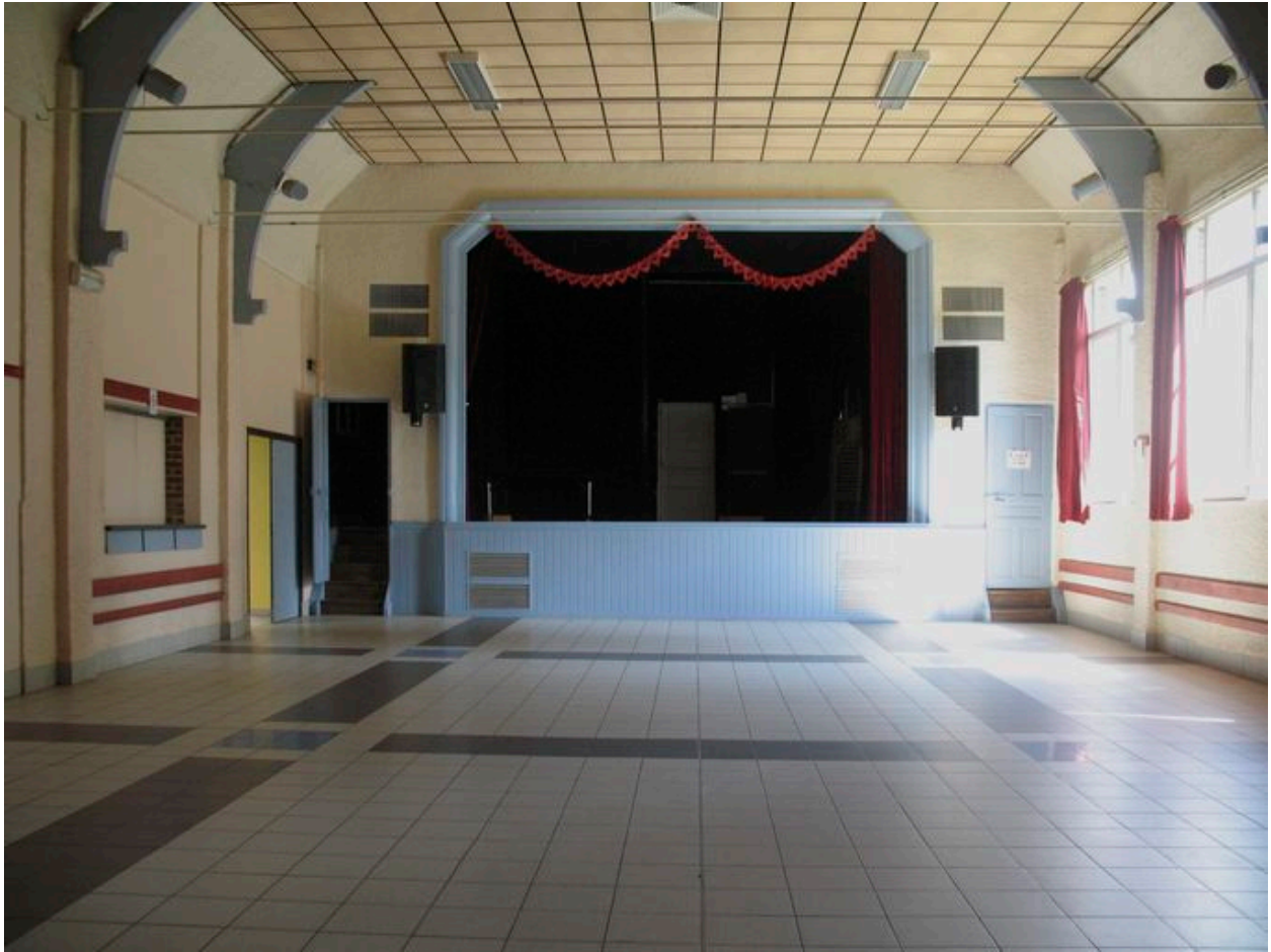
Vue intérieure vers la scène.