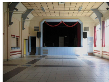
Vue intérieure vers la scène. IVR22_20088015068NUCA