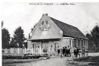
Vue générale, vers 1930 (coll. part.). IVR22_20088015497NUCA