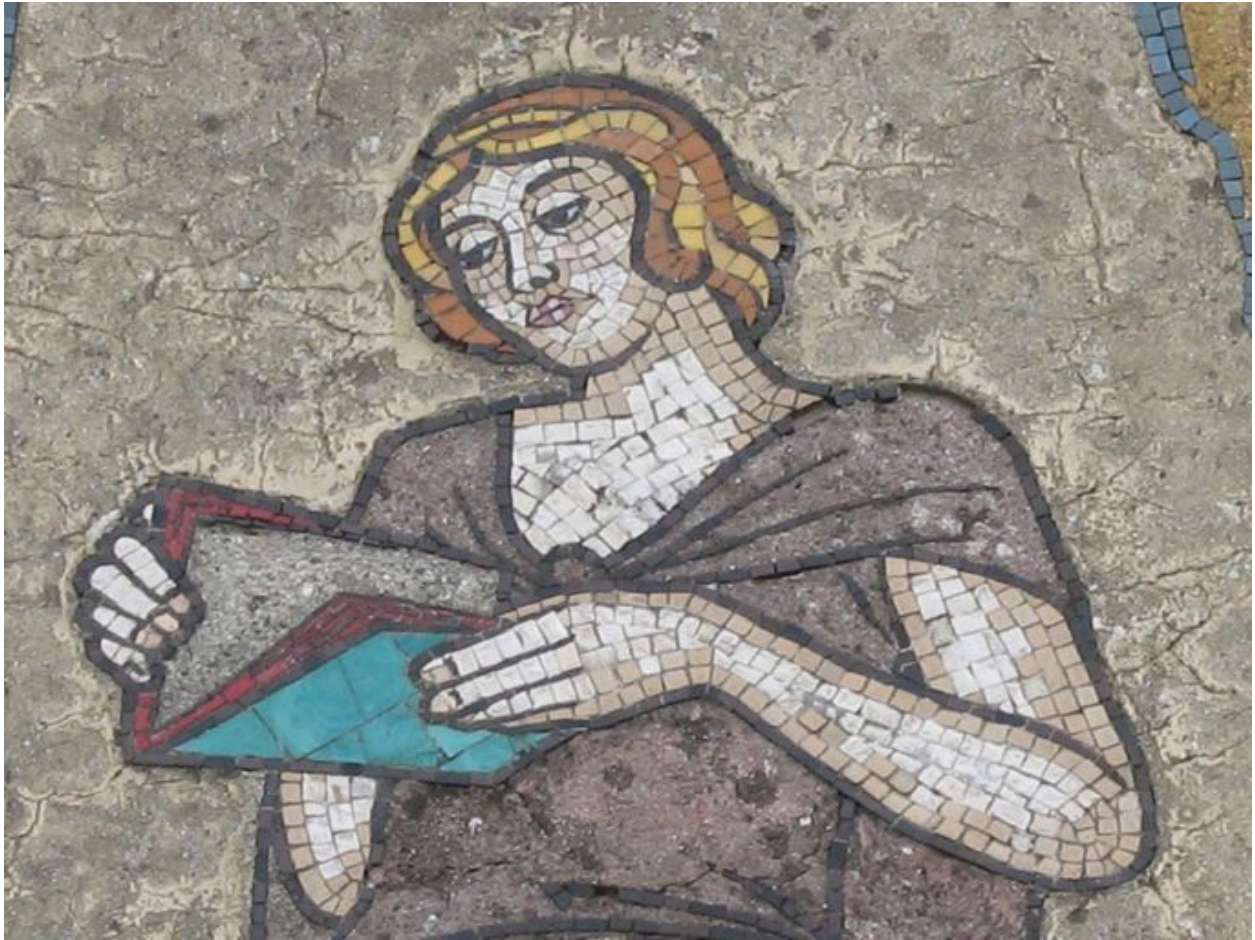
Détail du décor de mosaïque et de sgraffite du pignon : Allégorie des arts et de la culture.