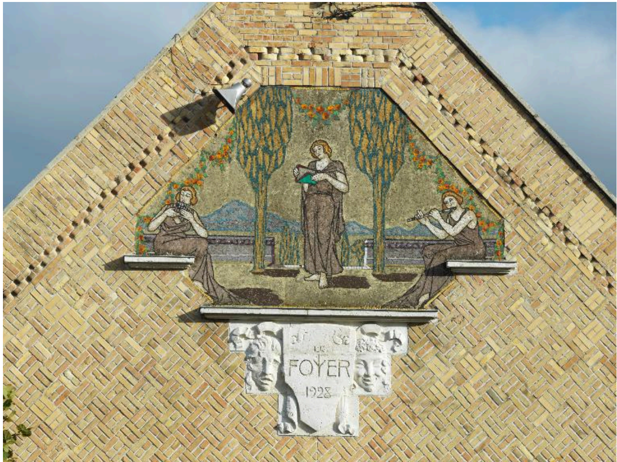
Détail du décor de mosaïque et sgraffite sur le pignon.