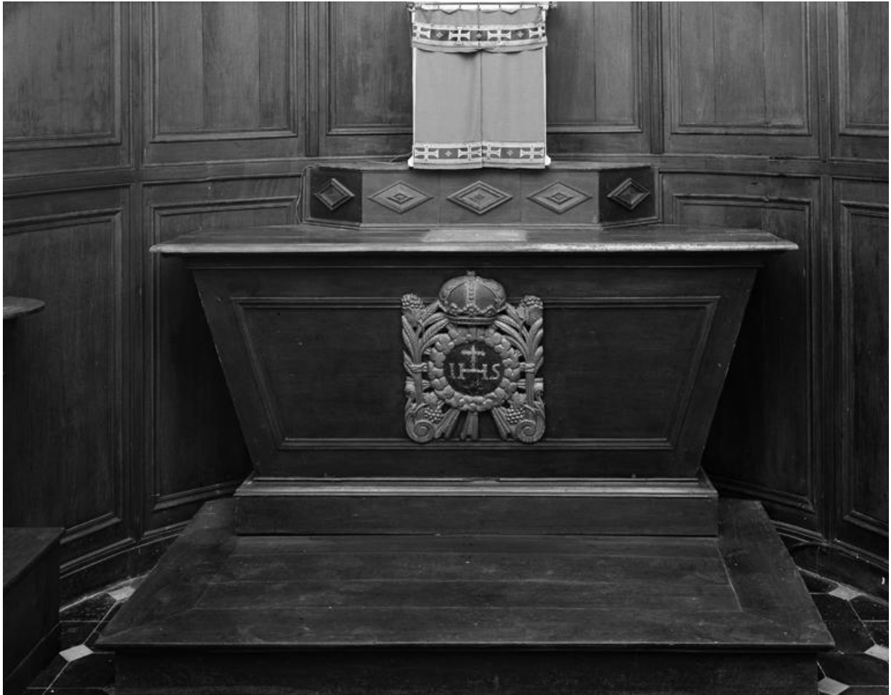
Vue de l'autel latéral nord.