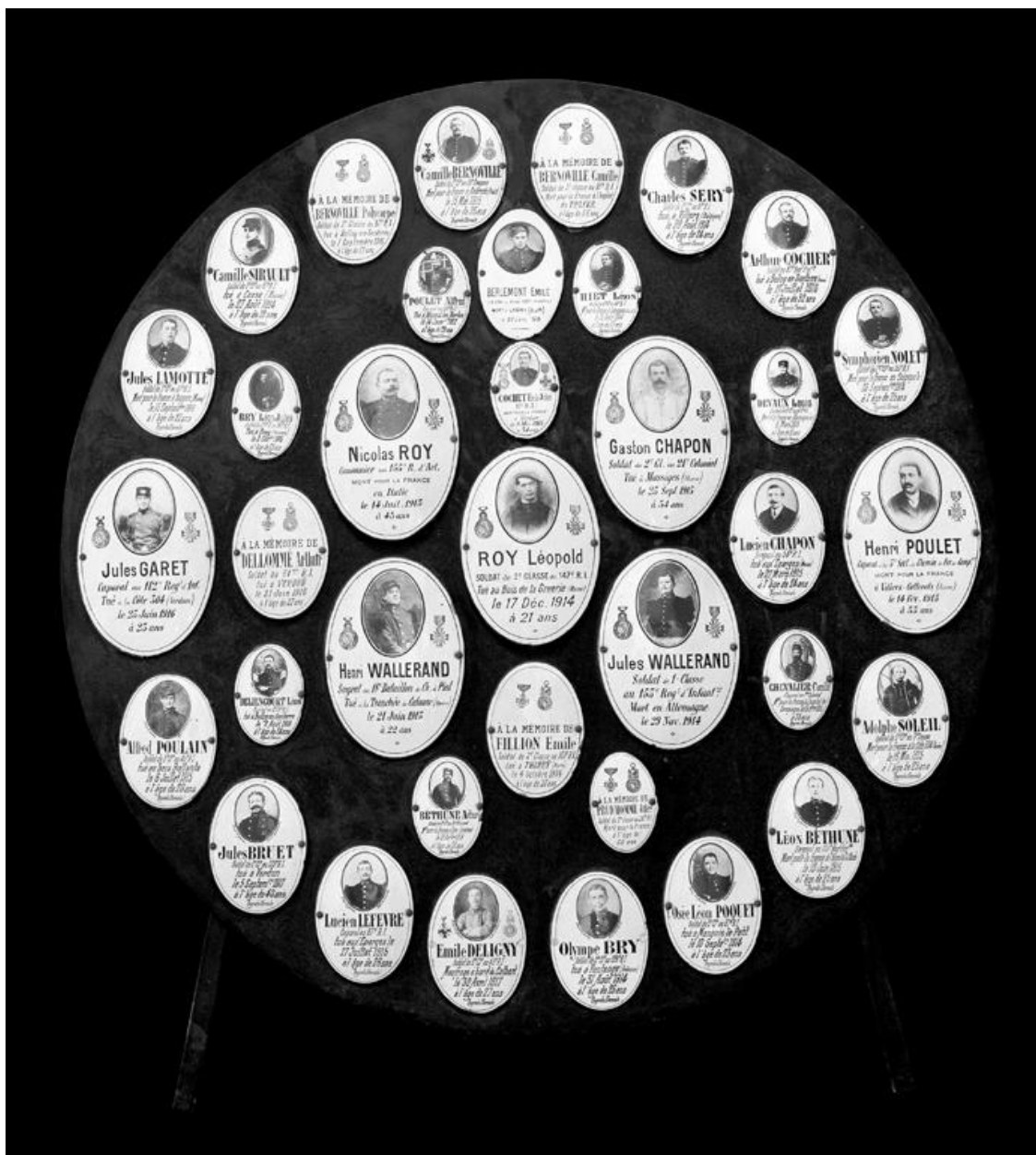
Vue d'une plaque commémorative des morts de la commune.