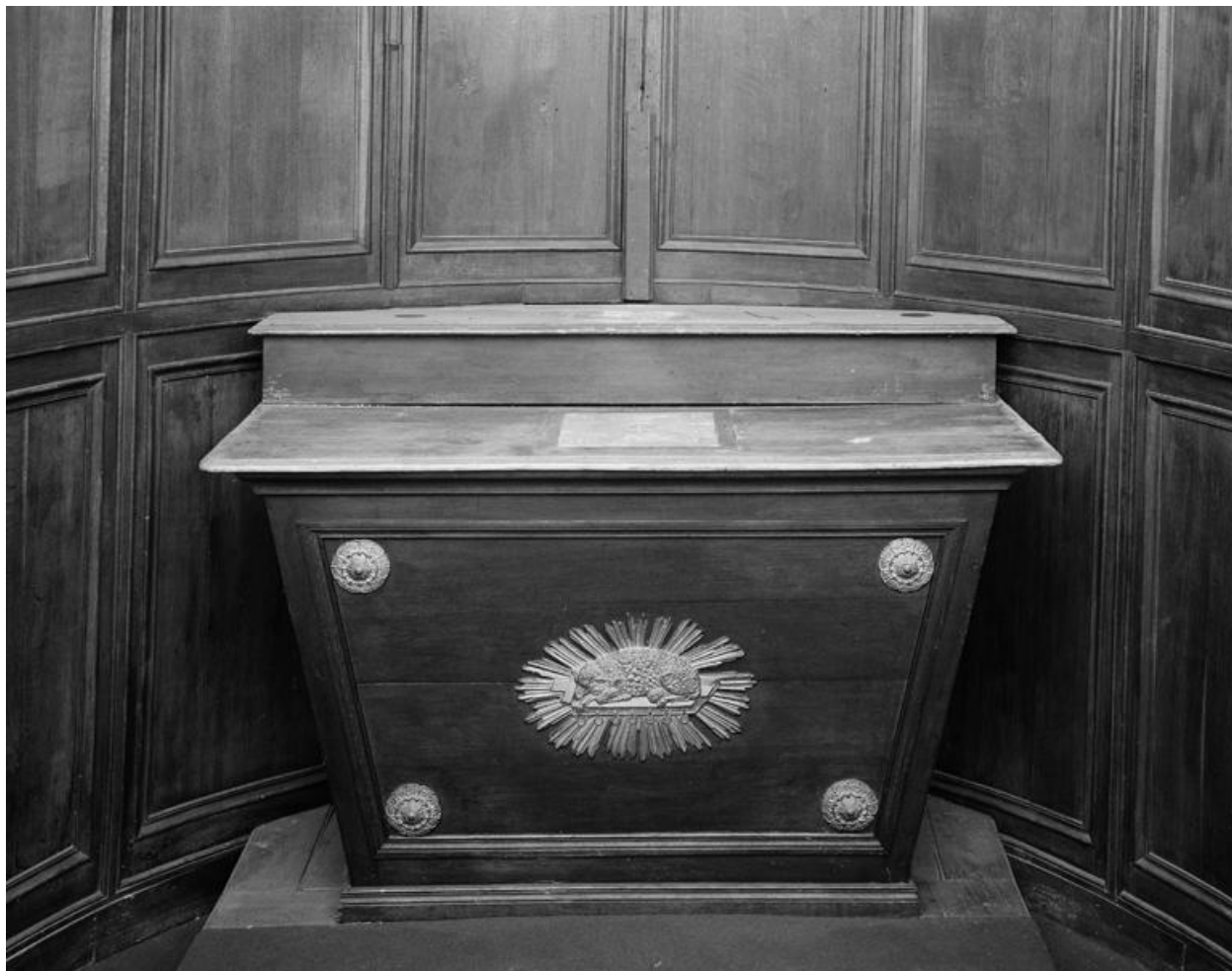
Vue de l'autel latéral sud.