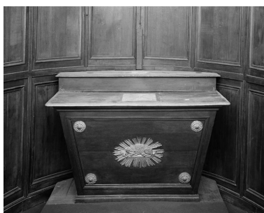
Vue de l'autel latéral sud.