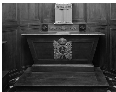
Vue de l'autel latéral nord.