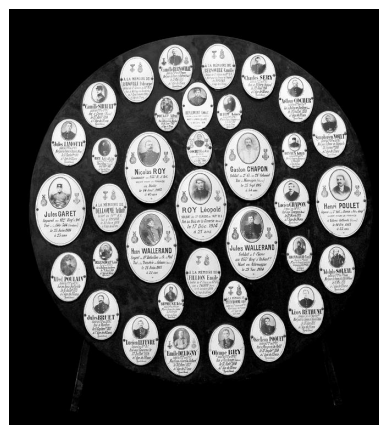
Vue d'une plaque commémorative des morts de la commune. IVR22_19910201302X