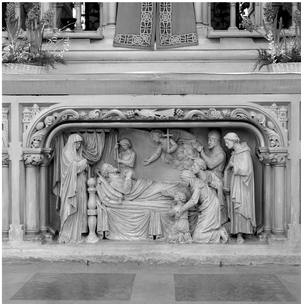
Haut relief : la mort de Saint François de Sales.