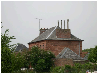
Vue de situation depuis le nord-est. IVR22_20038010419NUCA