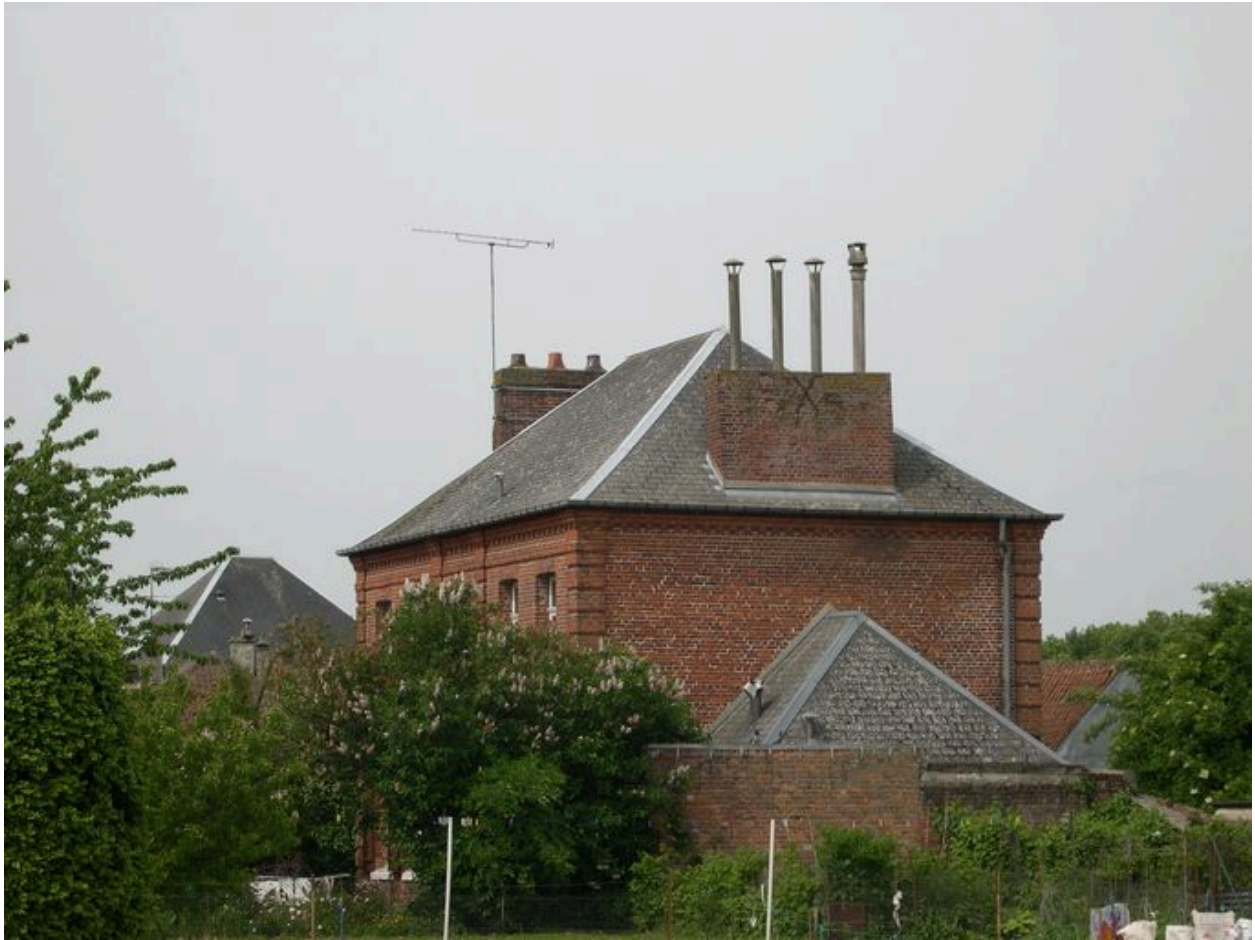
Vue de situation depuis le nord-est.