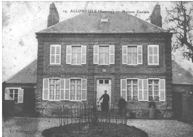
Allonville (Somme). Maison curiale, carte postale, 1er quart 20e siècle IVR22_20038010296NUCA