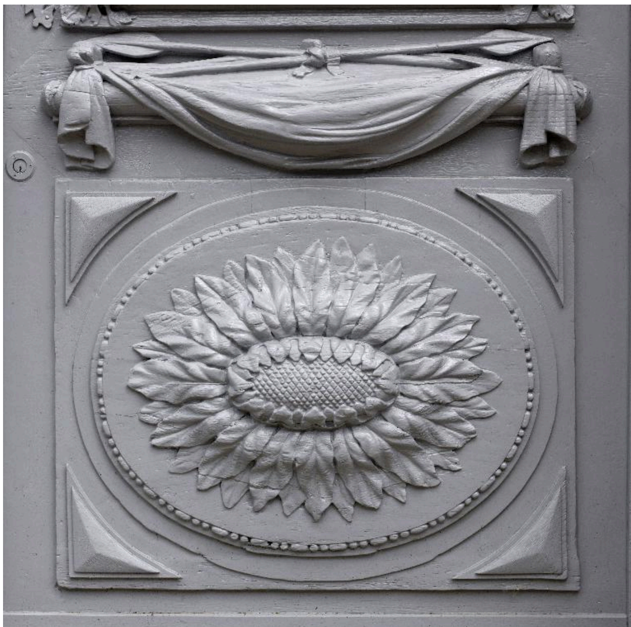
Détail des ornements de la partie basse des vantaux de la porte cochère.