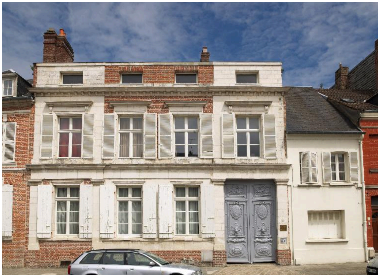
Façade principale donnant sur la rue Saint-Gilles.