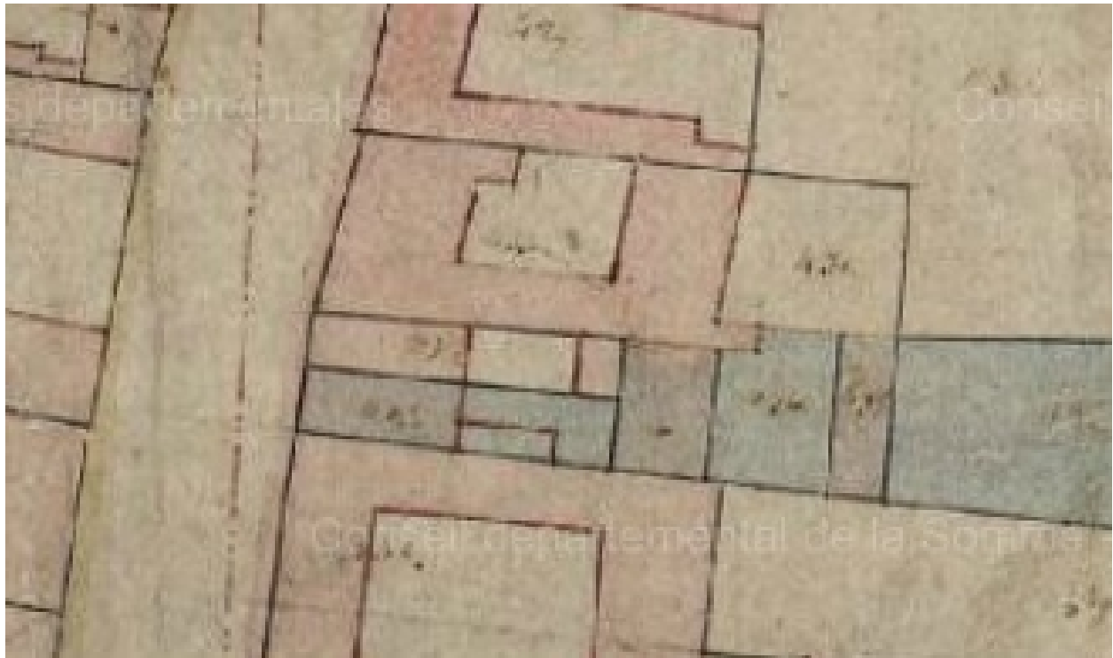
Plan cadastral de 1822, section B, parcelles 331-332 (AD Somme).