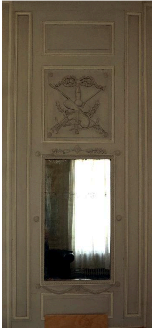
Trumeau de la cheminée du salon.