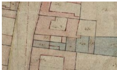
Plan cadastral de 1822, section B, parcelles 331-332 (AD Somme).