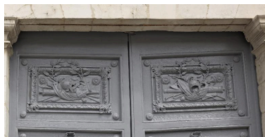
Détail des ornements – casques, carquois, flèches, etc. – de la partie supérieure des vantaux de la porte cochère. IVR32_20178000393NUC2A