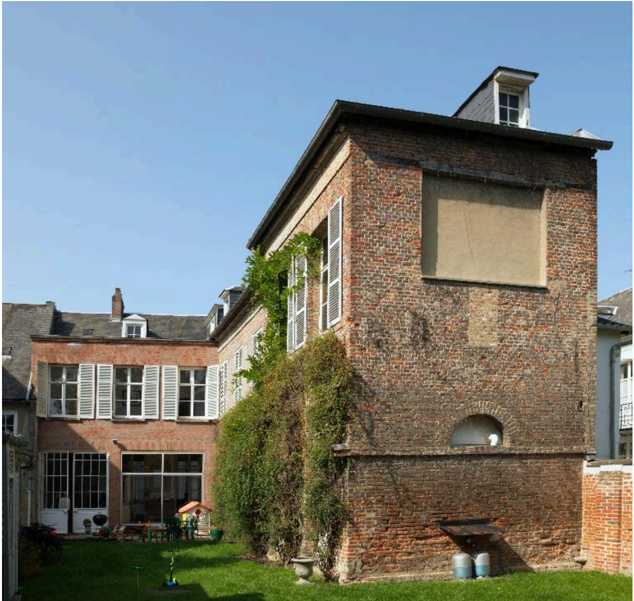
Façades sur jardin.