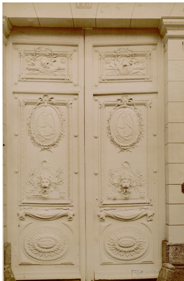
Porte de l'hôtel de Gaillon