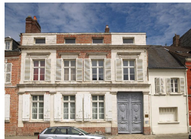
Façade principale donnant sur la rue Saint-Gilles. IVR32_20178000391NUC2A