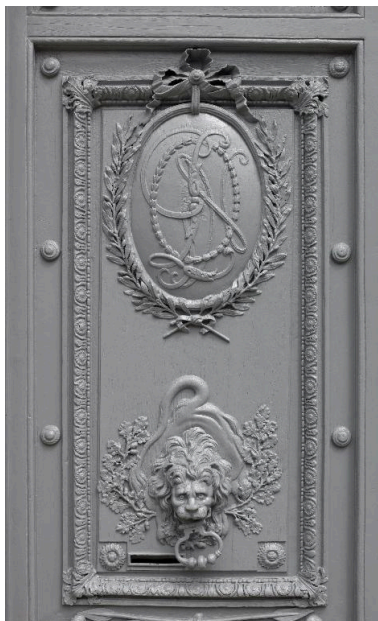
Détail des ornements – chiffre de Gaillon et heurtoir surmonté d'un mufle de lion – de la partie centrale des vantaux de la porte cochère.