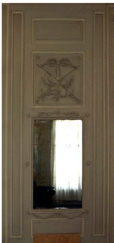
Trumeau de la cheminée du salon. IVR32_20178000517NUC2A