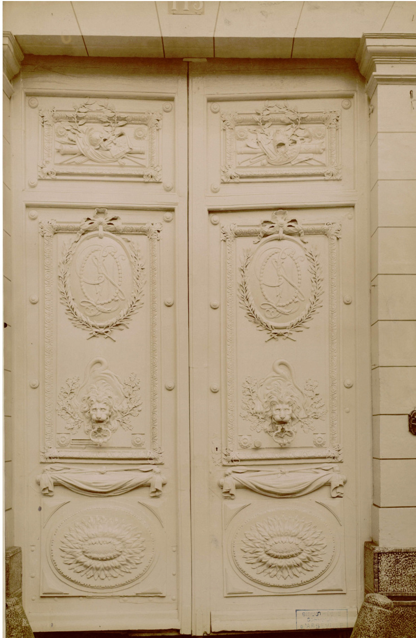
Porte de l'hôtel de Gaillon, photographie de M. Mieusement, 1887 (BM Abbeville ; Ab.U241).