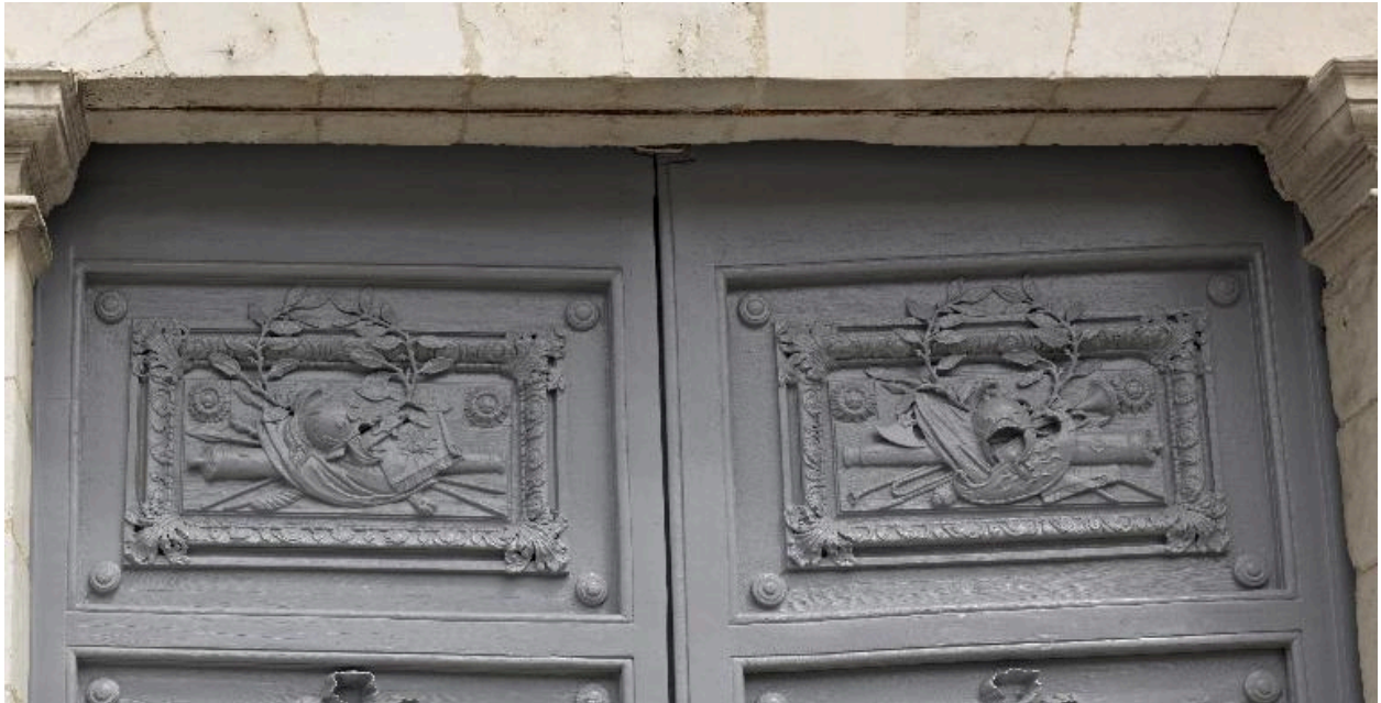
Détail des ornements – casques, carquois, flèches, etc. – de la partie supérieure des vantaux de la porte cochère.