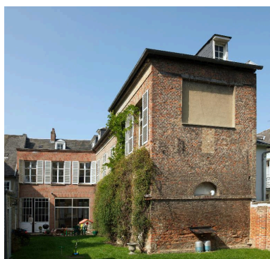
Façades sur jardin. IVR32_20178000515NUC2A