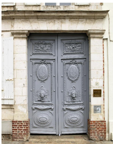
Porte cochère.