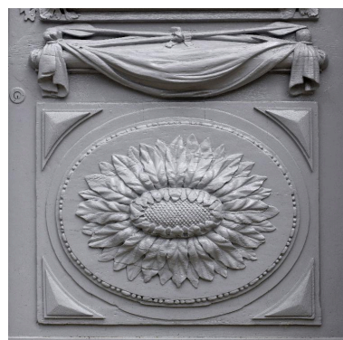
Détail des ornements de la partie basse des vantaux de la porte cochère.