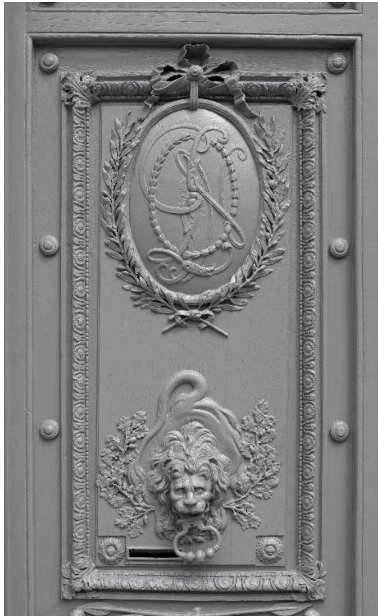
Détail des ornements – chiffre de Gaillon et heurtoir surmonté d'un mufle de lion – de la partie centrale des vantaux de la porte cochère.