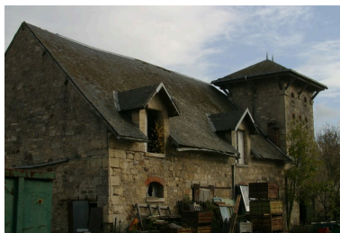
Vue d'un des bâtiments agricoles accolé au pigeonier.