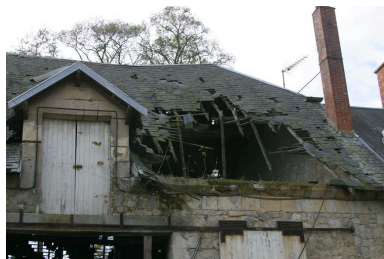
Etat actuel du bâtiment accolé au logis. IVR22_20030202919NUCA