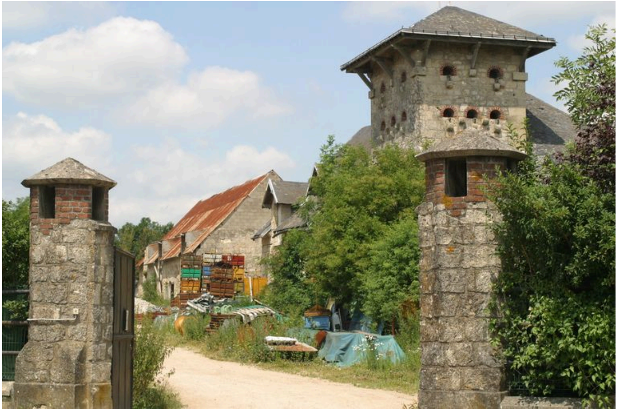
Entrée de la propriété.