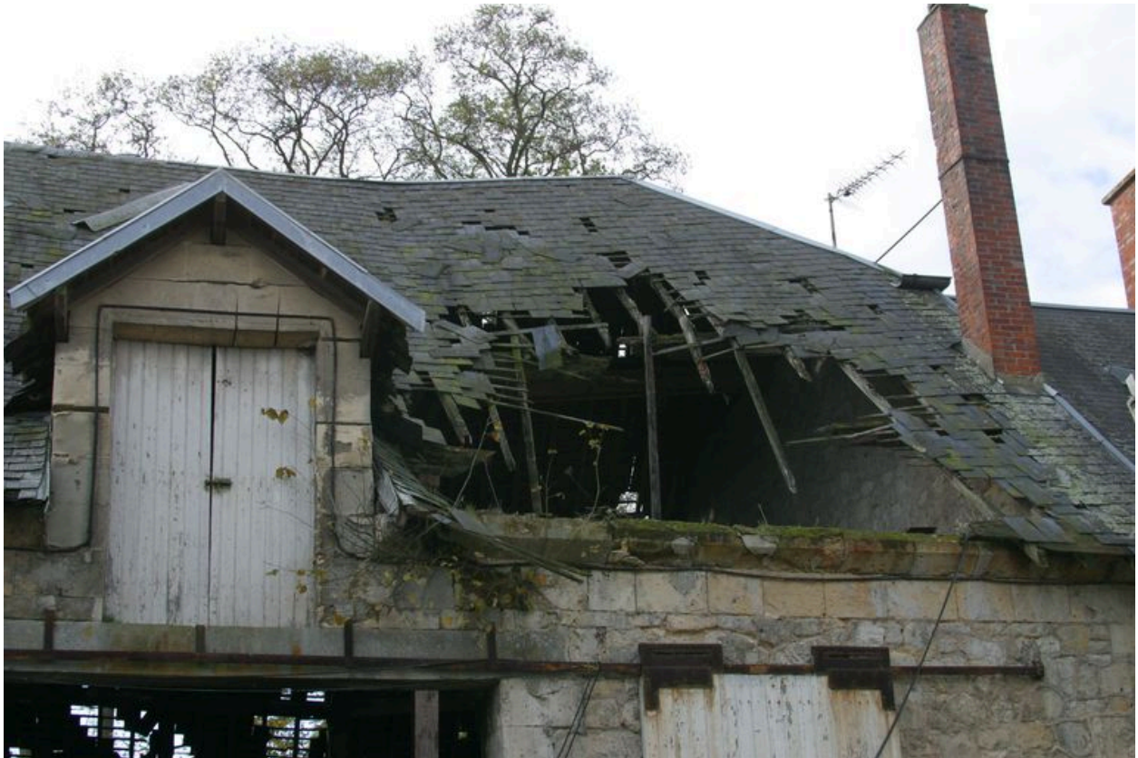
Etat actuel du bâtiment accolé au logis.