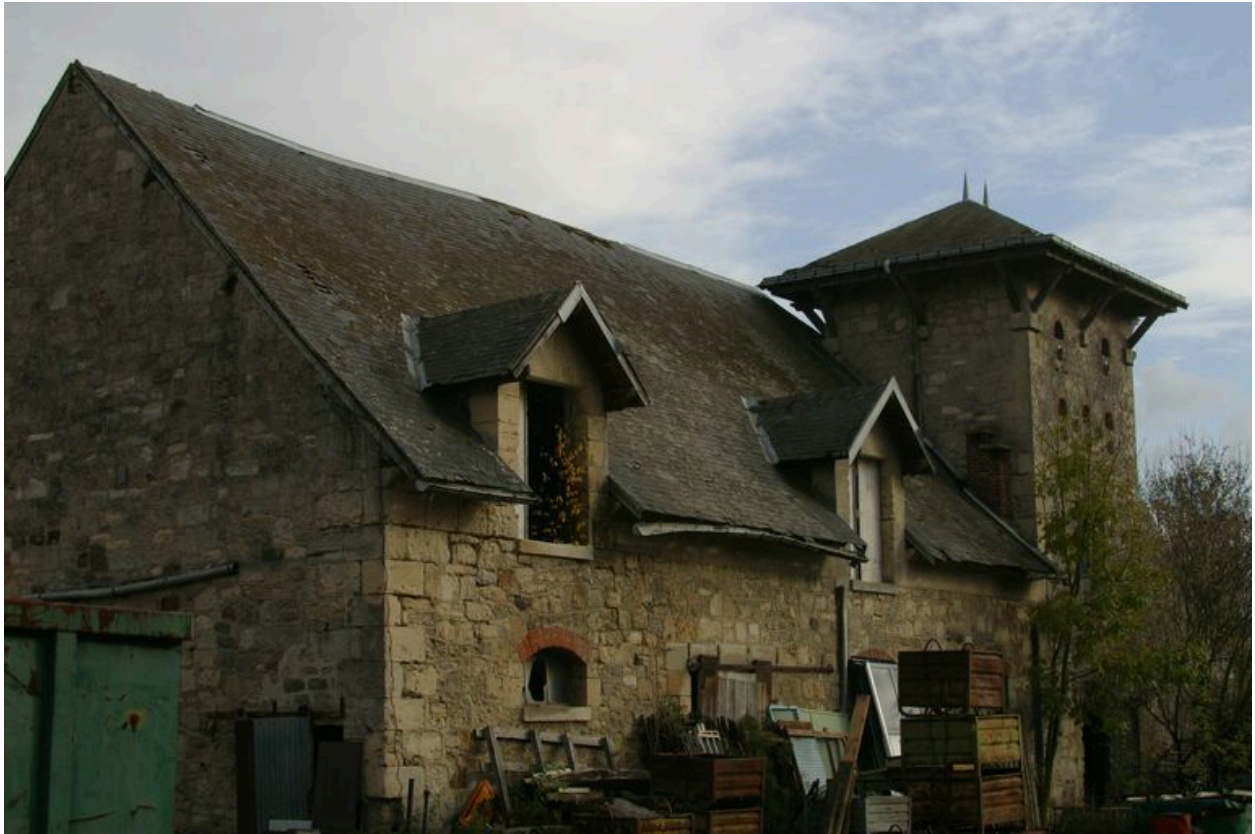
Vue d'un des bâtiments agricoles accolé au pigeonnier.