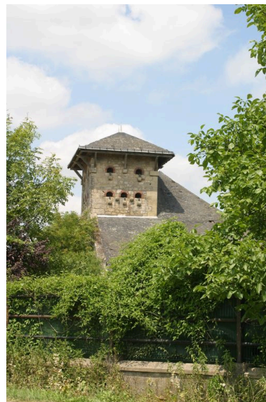
Vue du pigeonier. IVR22_20030202302NUCA