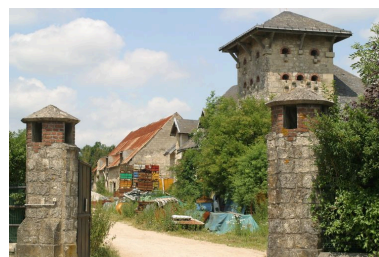
Entrée de la propriété.