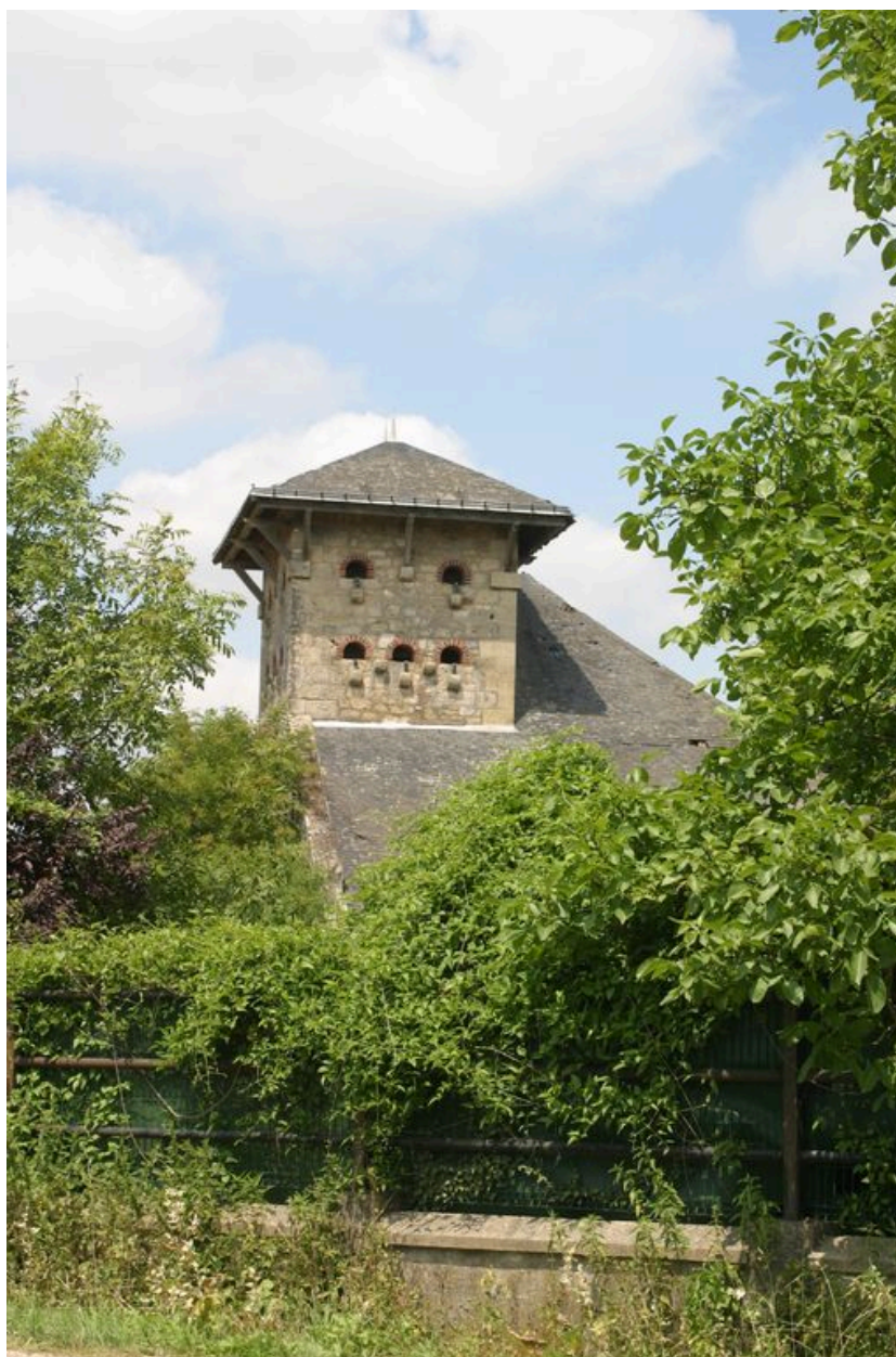
Vue du pigeonnier.