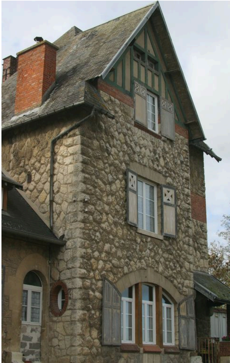
Vue du logis depuis la cour.