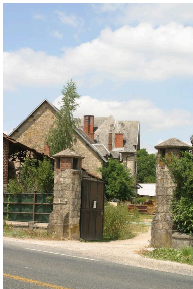
Vue de l'entrée. IVR22_20030202303NUCA