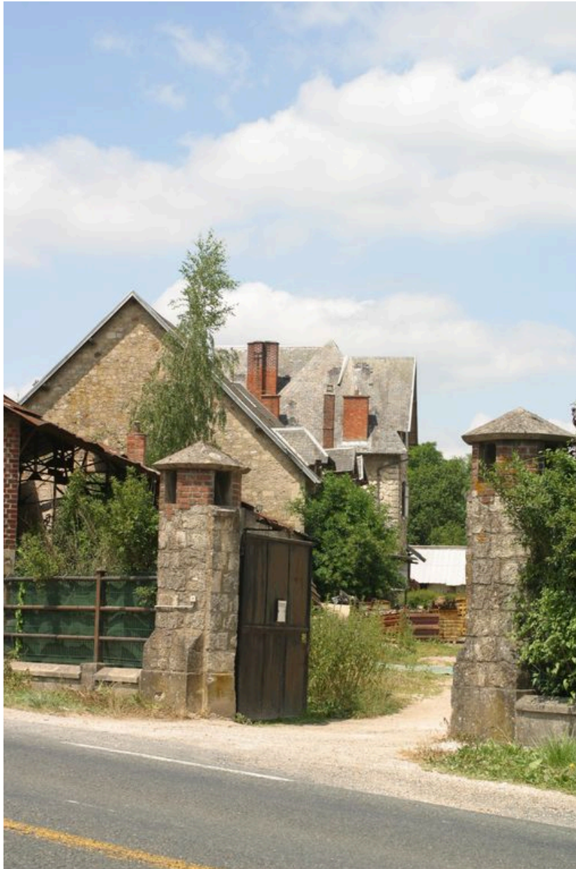
Vue de l'entrée.