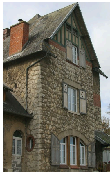
Vue du logis depuis la cour.