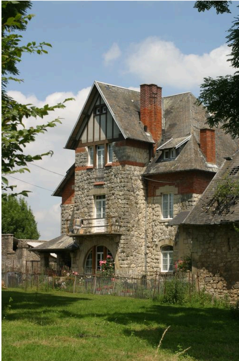
Vue du logis.