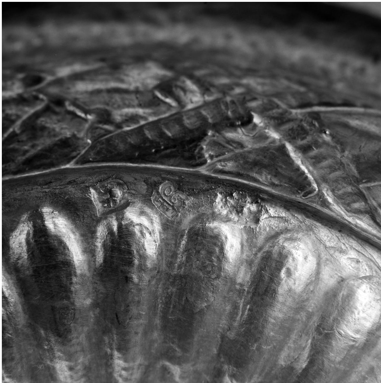
Détail : poinçon de la date (1790) et poinçon d' un maître-orfèvre tournaisien (non identifié), insculpés sur le talon.