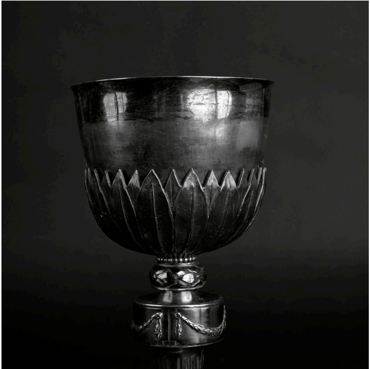
Détail : vue de la coupe.