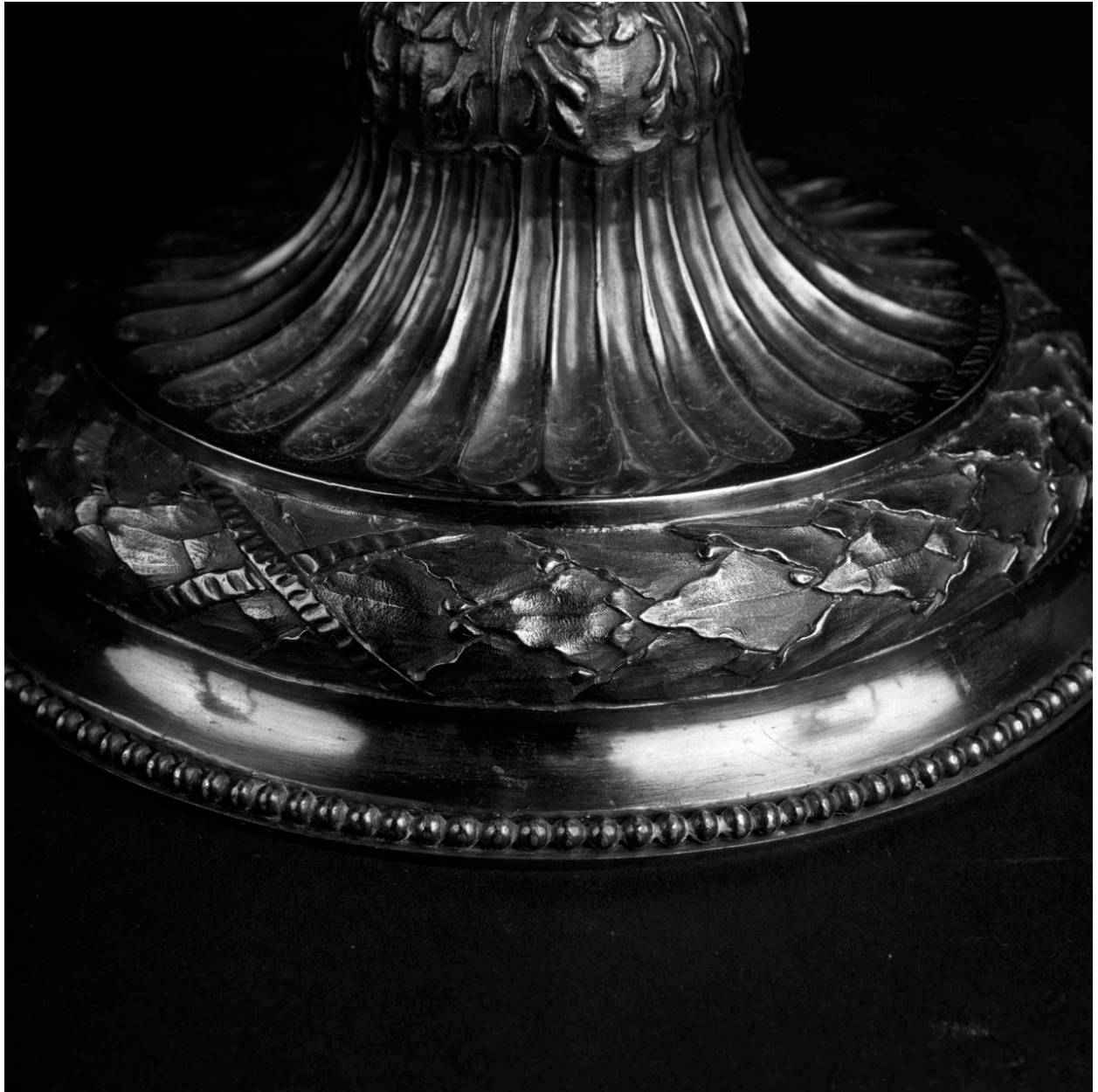
Détail : vue du pied.