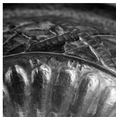
Détail : poinçon de la date (1790) et poinçon d'un maître-