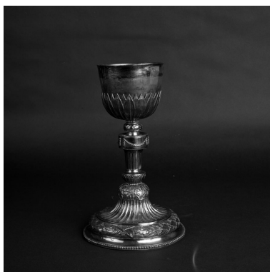
Vue générale. IVR31_19985900501X