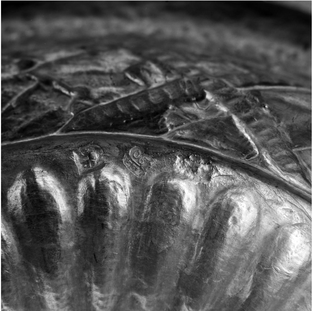
Détail : poinçon de la date (1790) et poinçon d' un maître-orfèvre tournaisien (non identifié), insculpés sur le talon.