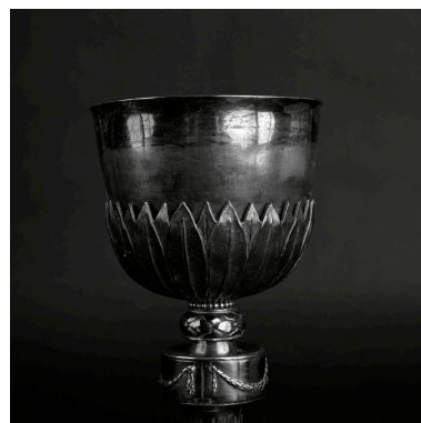
Détail : vue de la coupe. IVR31_19985900497X