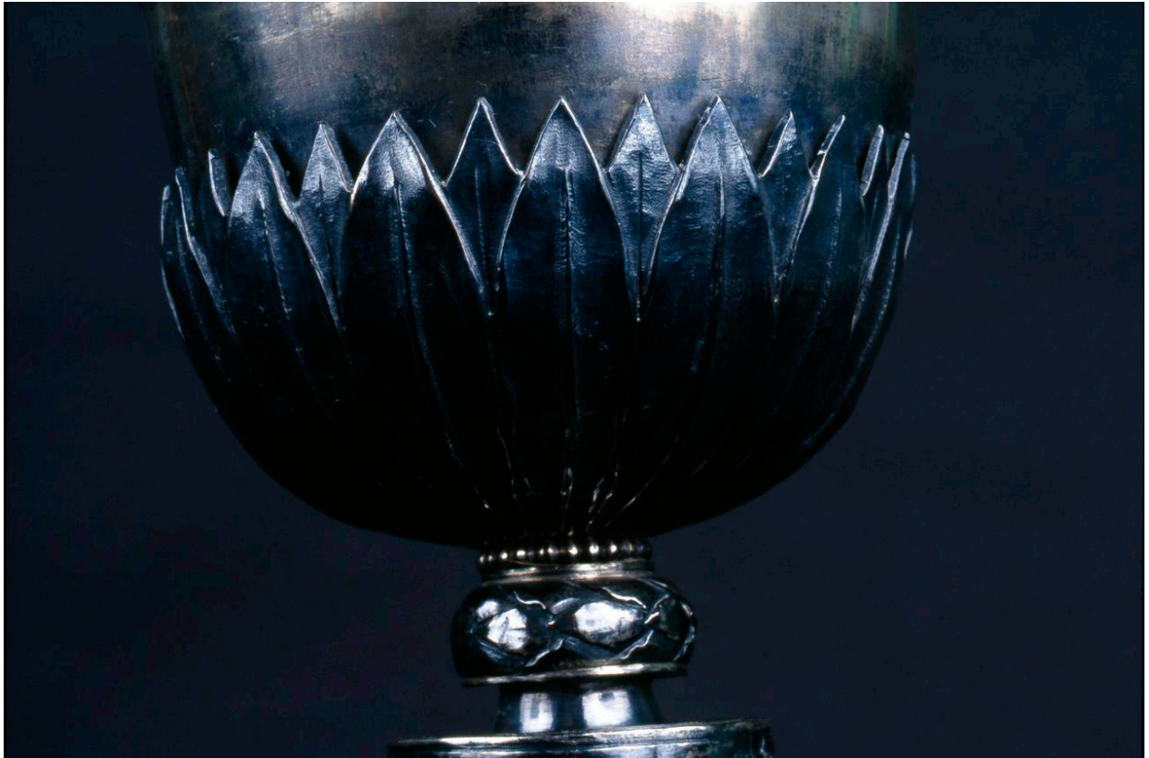
Détail : vue de la coupe en gros plan.