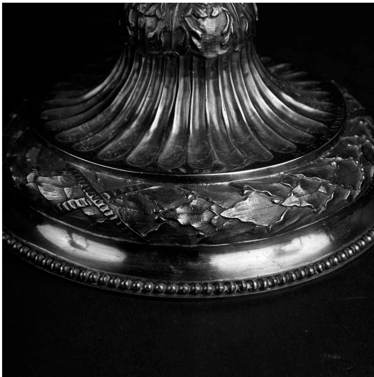
Détail : vue du pied.