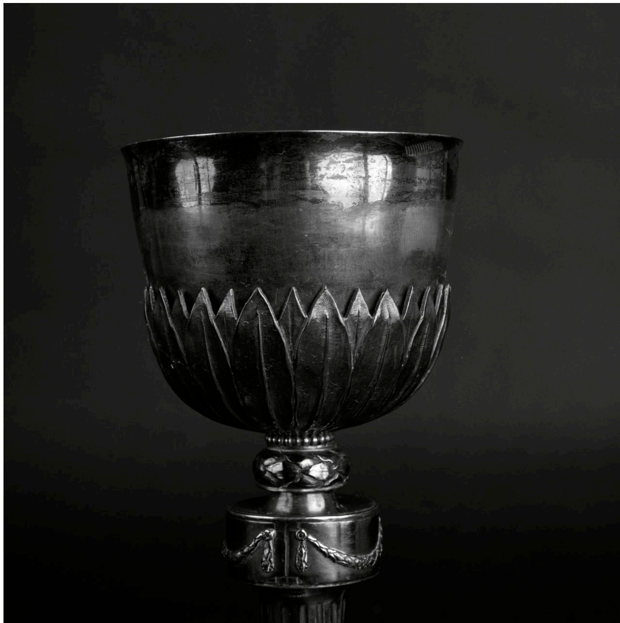
Détail : vue de la coupe.