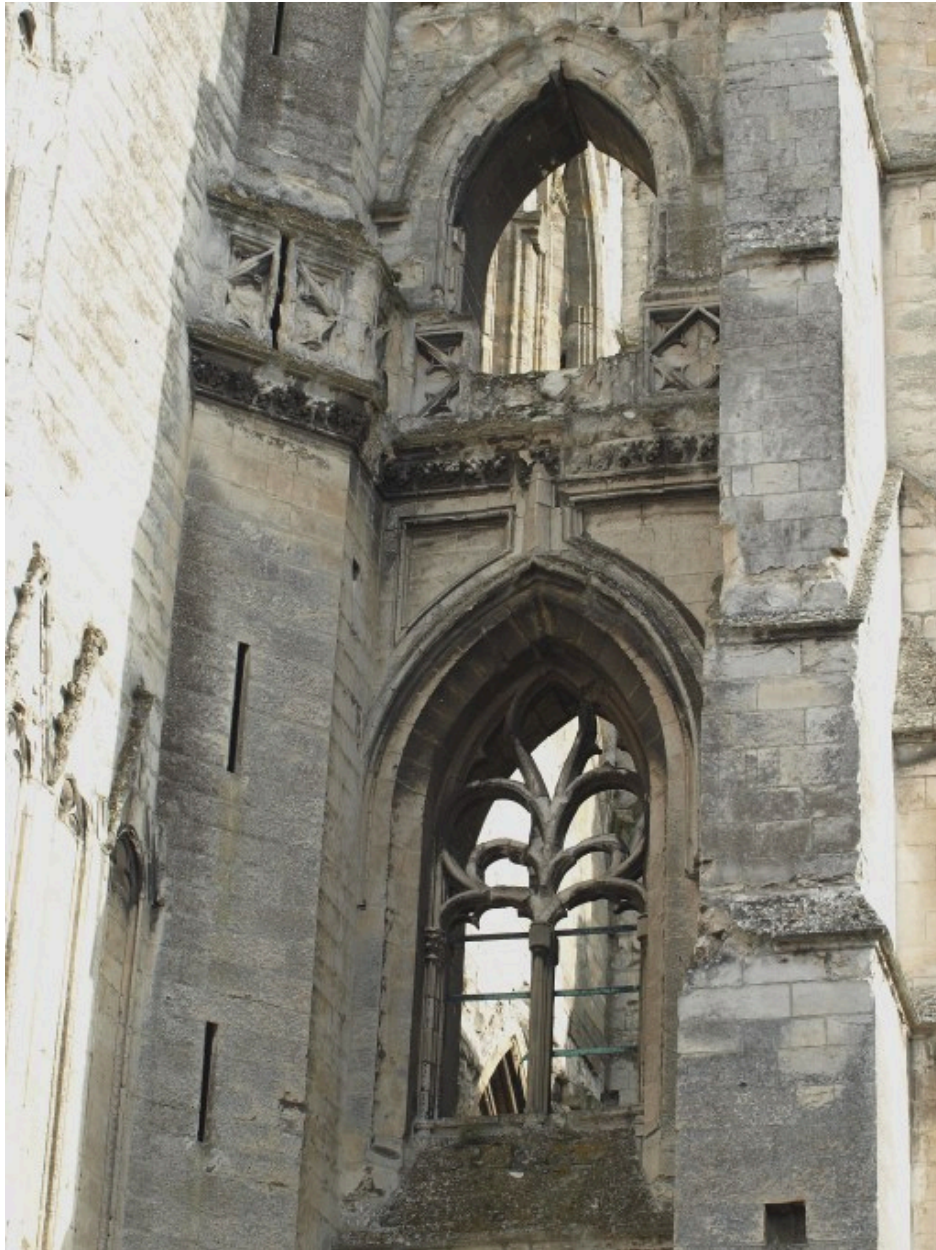
Baies ouest du bas-côté sud