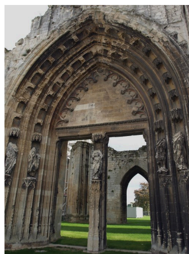
Vue d'ensemble du portail ouest IVR31_20106202259NUCA