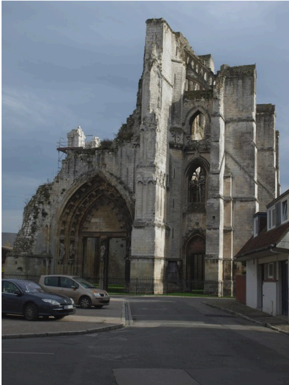
Vue générale de la façade ouest