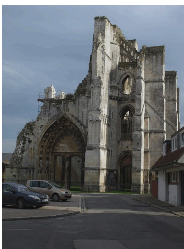
Vue générale de la façade ouest IVR31_20106202261NUCA