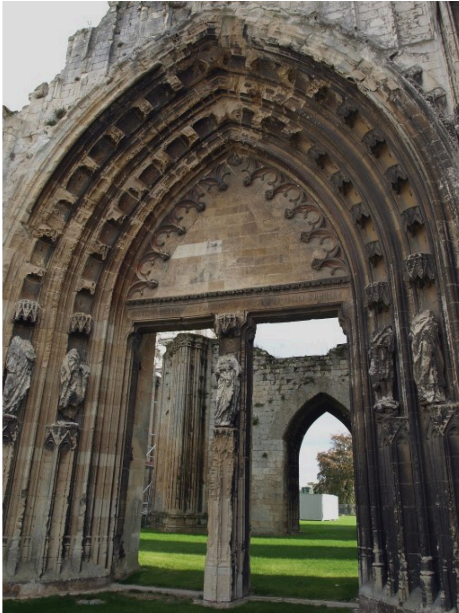
Vue d'ensemble du portail ouest