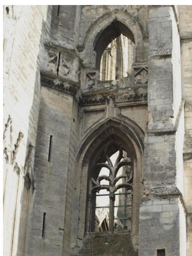
Baies ouest du bas-côté sud IVR31_20106202260NUCA