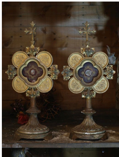
Vue générale IVR31_20106202233NUCA