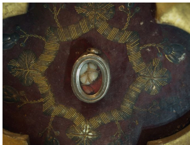
Vue de détail IVR31_20106202234NUCA