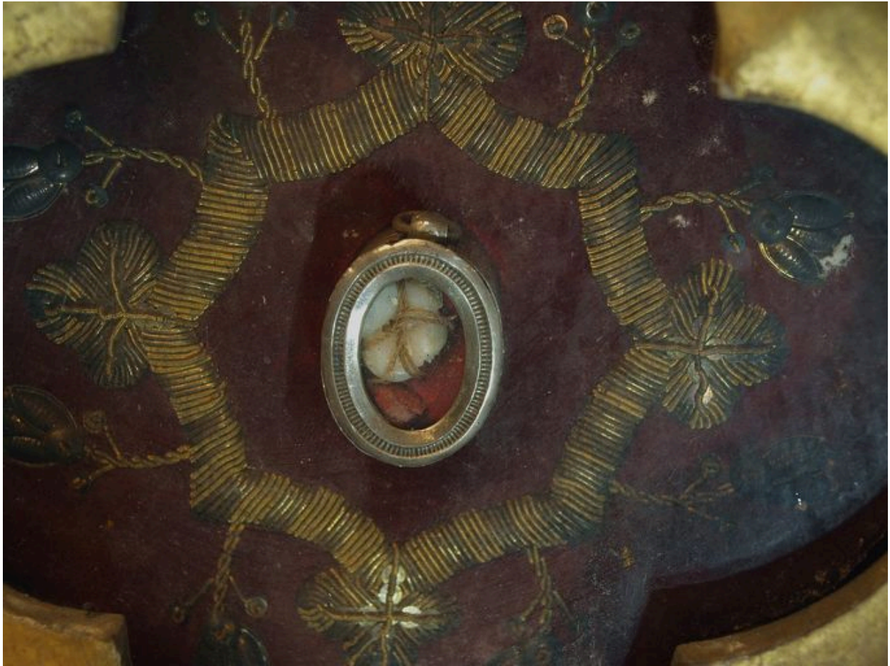
Vue de détail