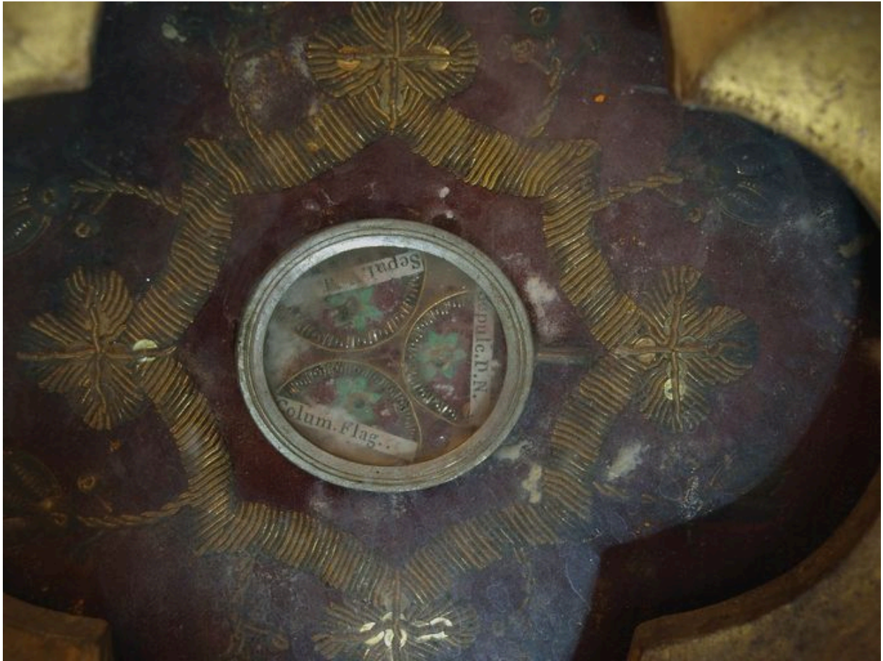
Vue de détail