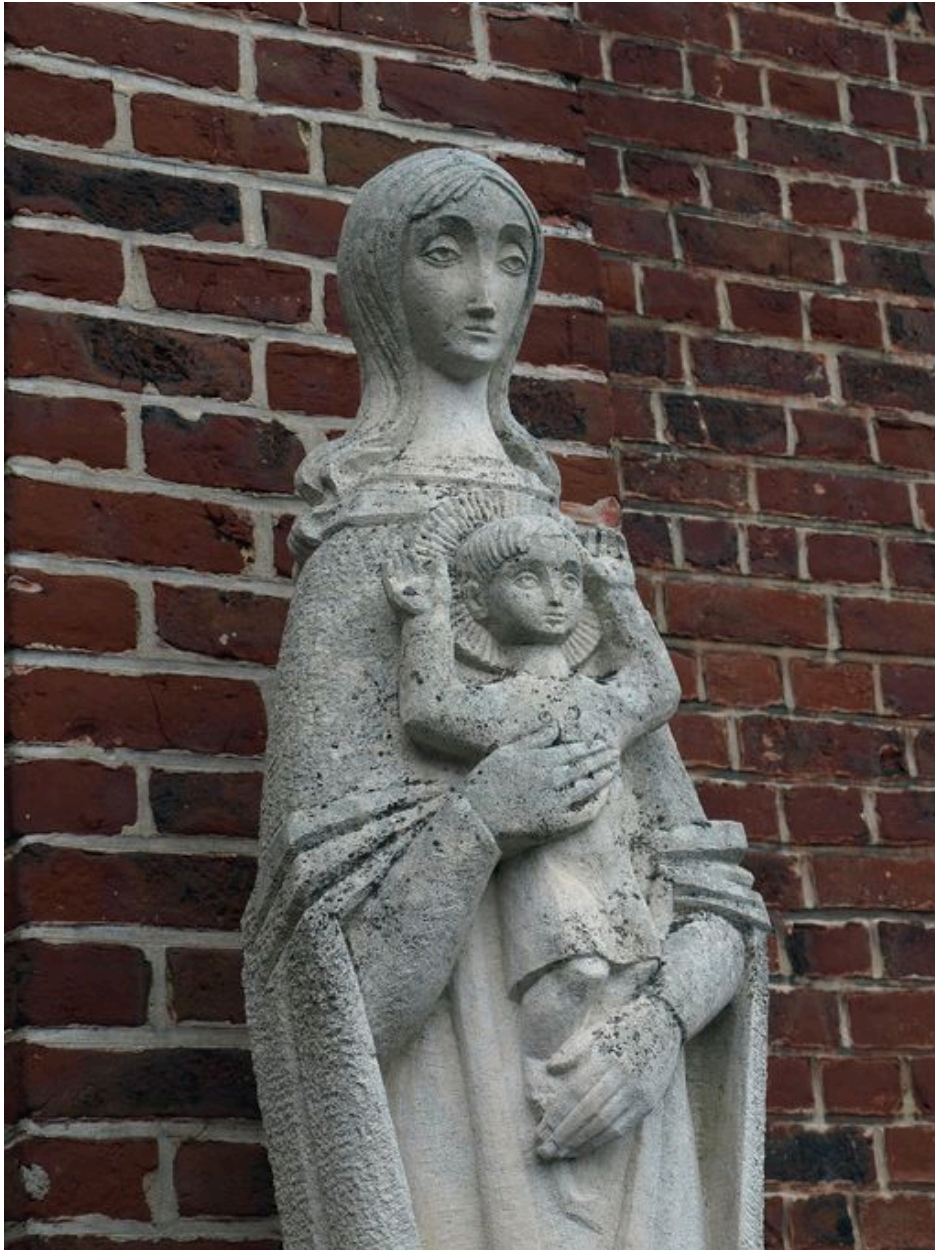
Vue partielle : Vierge à l'Enfant