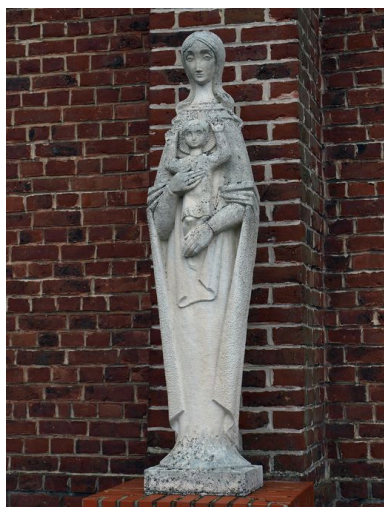
Vue générale : Vierge à l'Enfant IVR31_20106204017NUCA