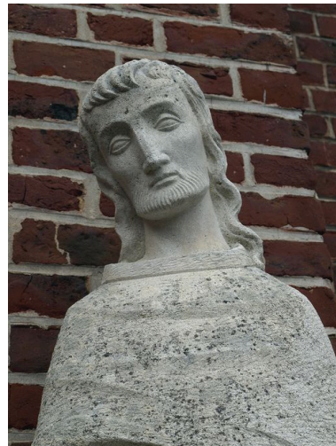
Vue partielle : saint Joseph, buste IVR31_20106204016NUCA