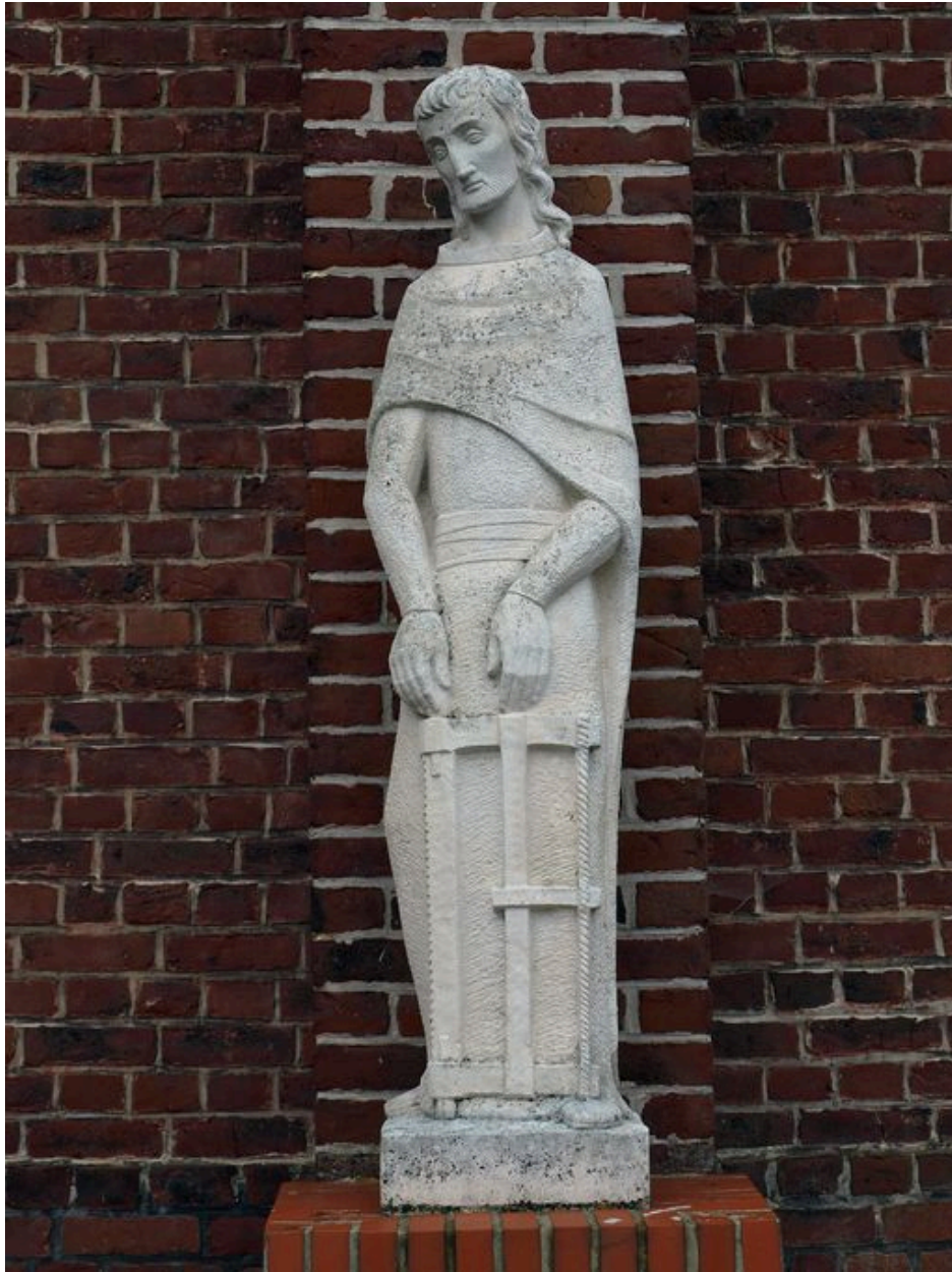
Vue générale : saint Joseph