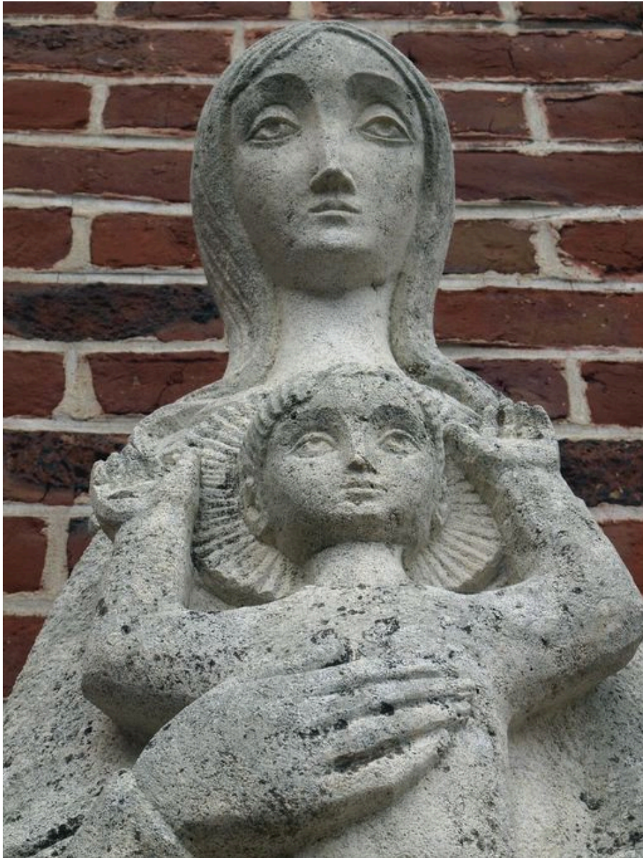
Vue de détail : Vierge à l'Enfant, buste