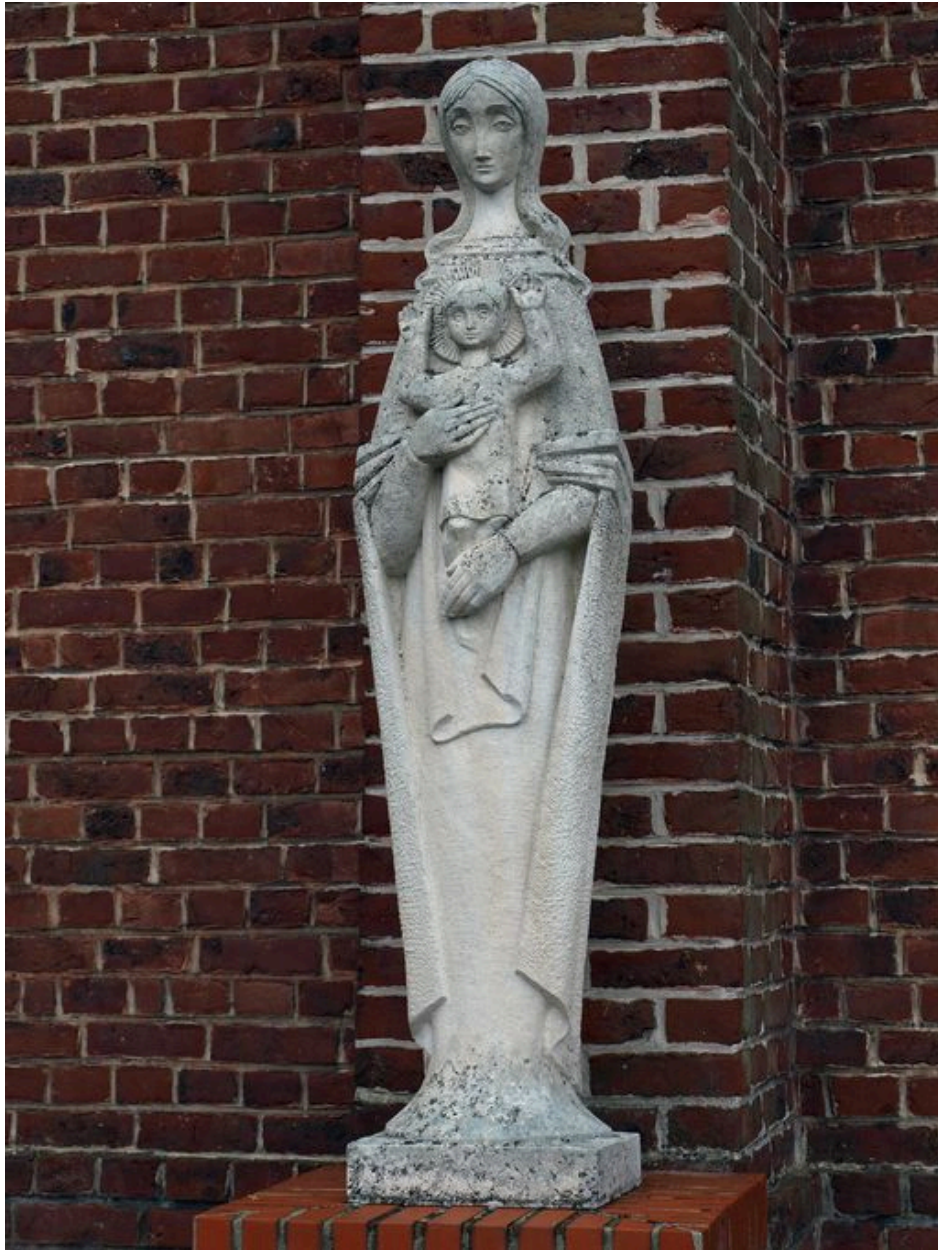
Vue générale : Vierge à l'Enfant