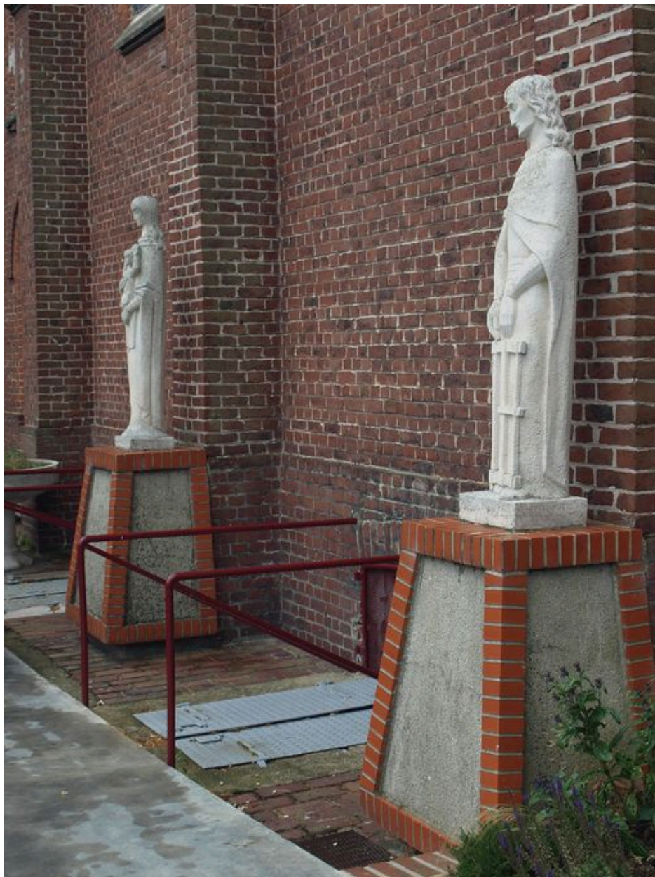
Vue générale : vue d'ensemble des deux statues