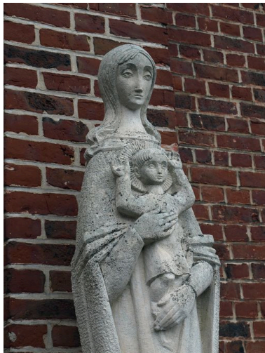
Vue partielle : Vierge à l'Enfant IVR31_20106204018NUCA