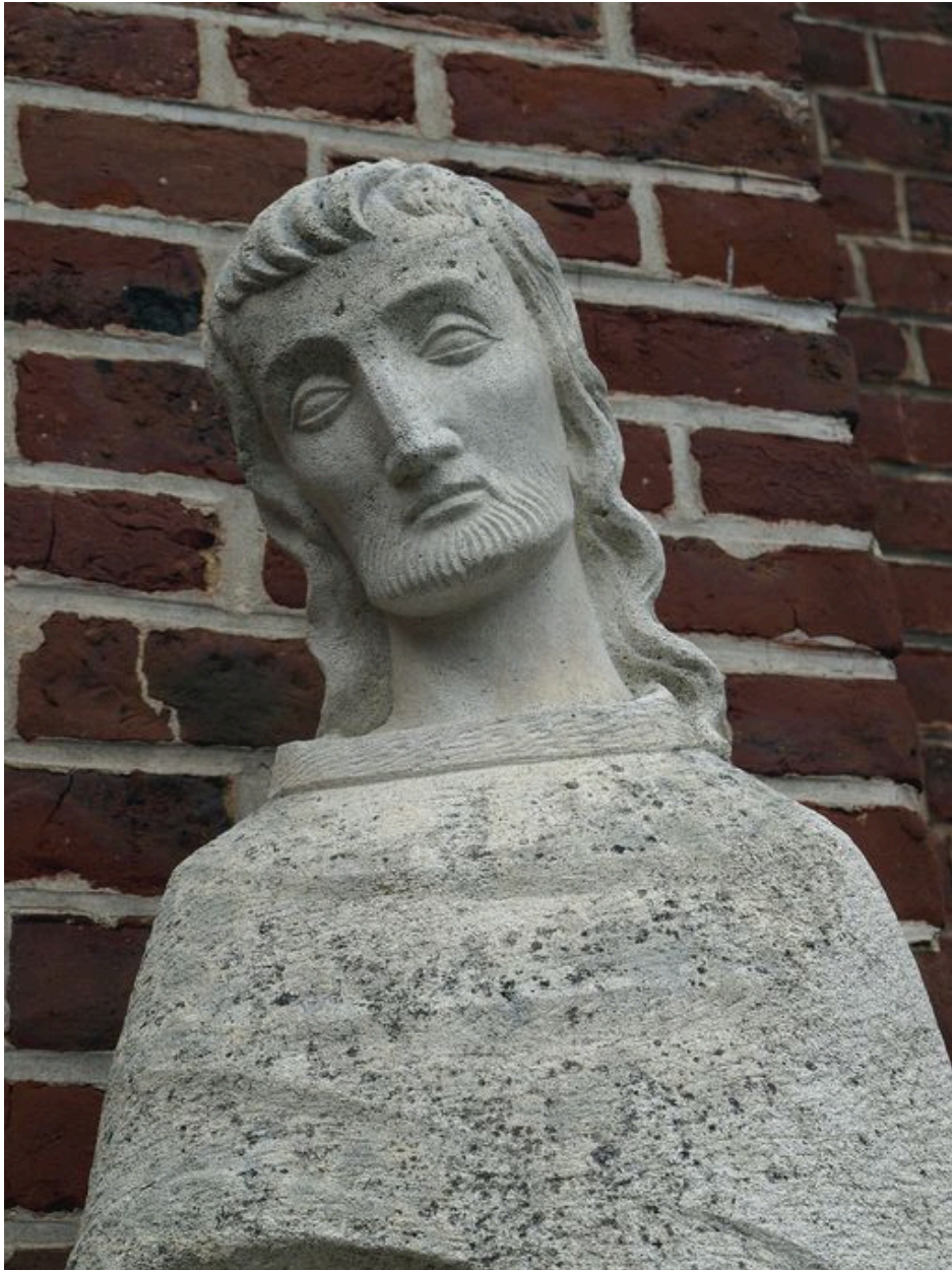
Vue partielle : saint Joseph, buste