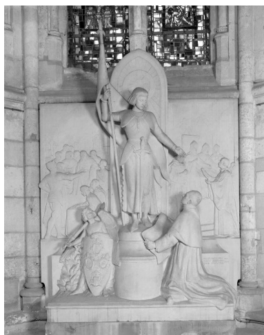
Vue d'ensemble. IVR22_19966003719V