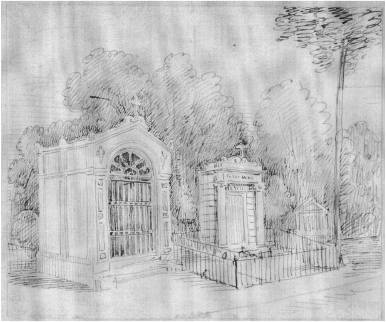
Le tombeau de M. Voclin au cimetière de la Madeleine, dessin des frères Duthoit, vers 1850 (Musée de Picardie, Amiens ; MP Duthoit VI-103).