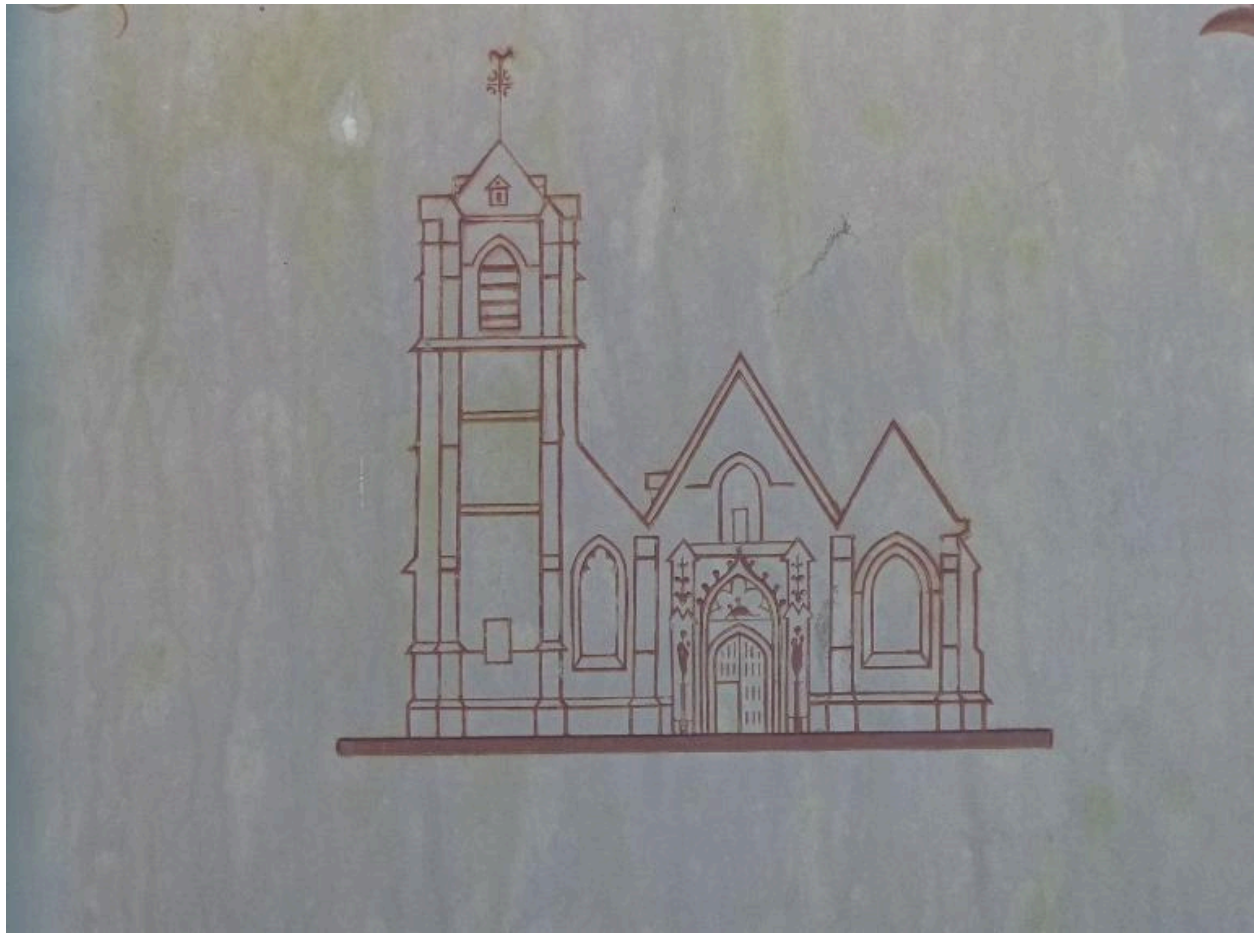
Vue de détail sur la représentation de l'ancienne église Saint-Jacques.