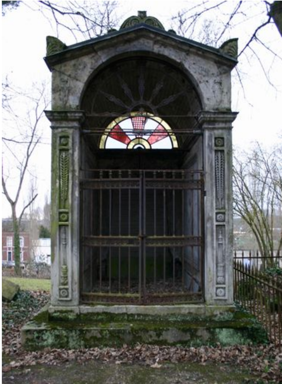
Vue générale, de face.