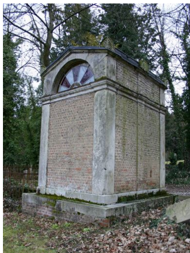
Vue générale postérieure. IVR22_20098000587NUCA