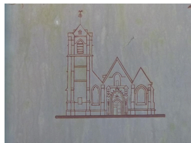
Vue de détail sur la représentation de l'ancienne église Saint-Jacques.