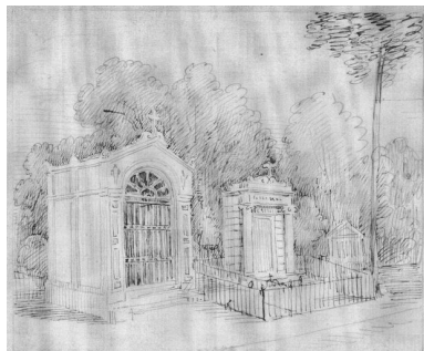
Le tombeau de M. Voclin au cimetière de la Madeleine, dessin des frères Duthoit, vers 1850 (Musée de Picardie, Amiens ; MP Duthoit VI-103).