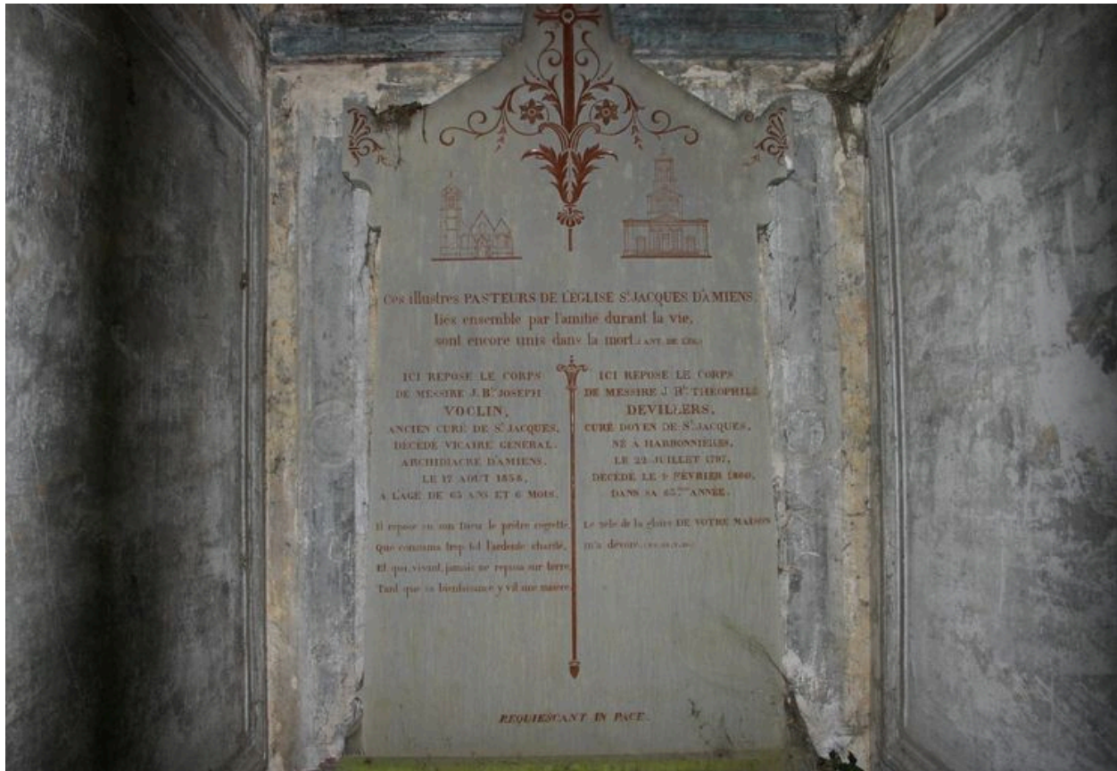
Stèle d'applique à acrotères stylisés.