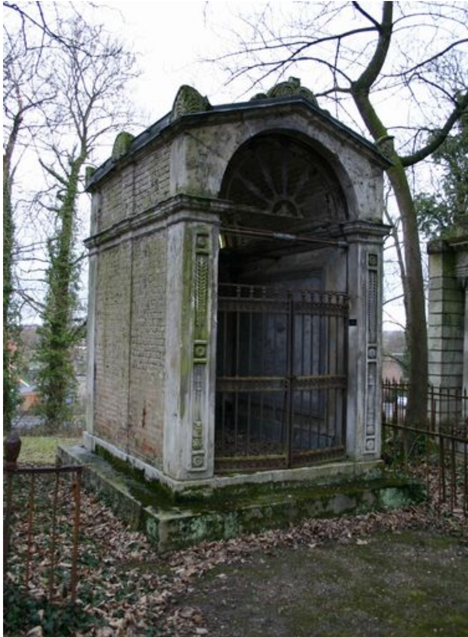
Vue générale, depuis le côté.