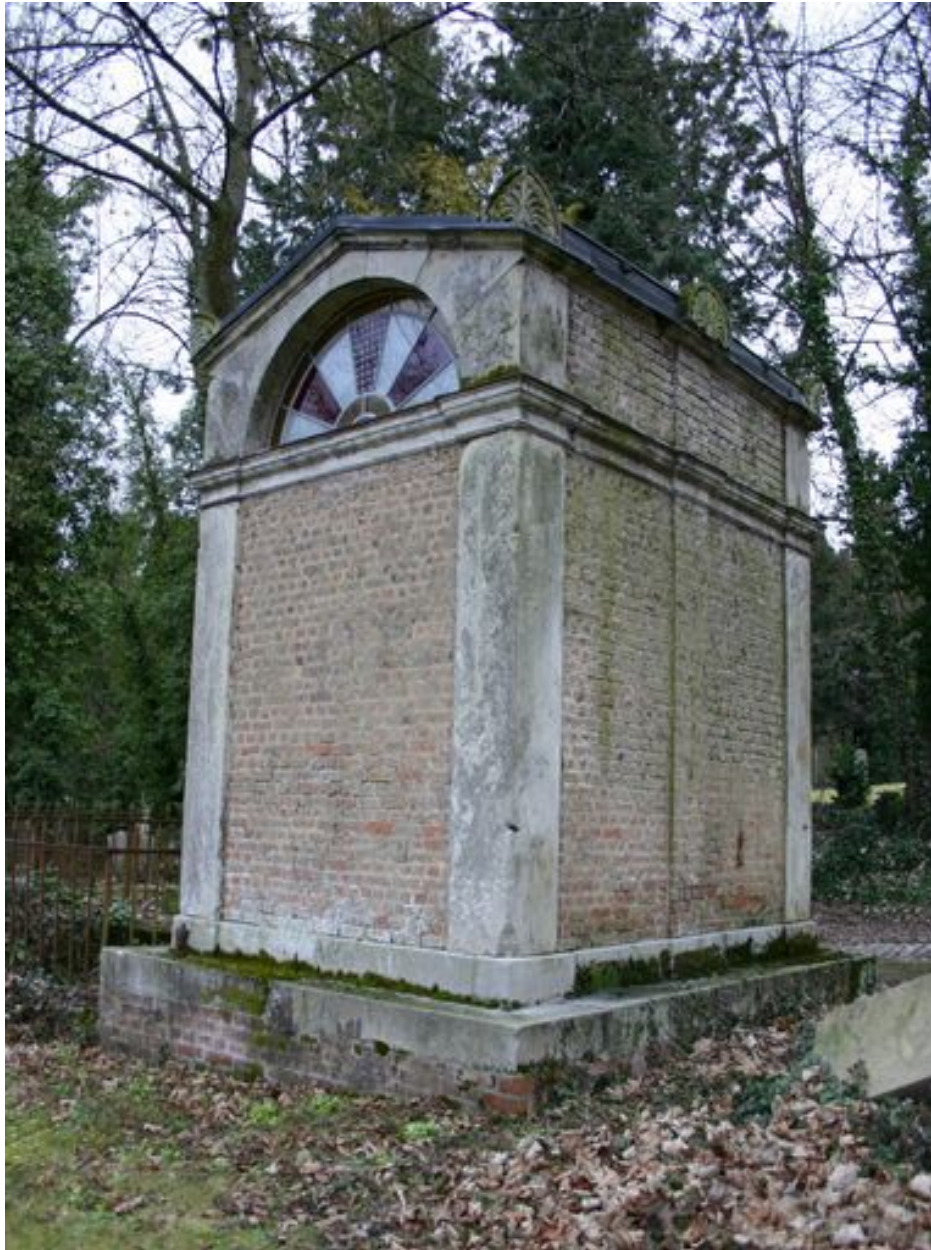
Vue générale postérieure.