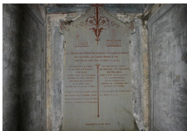
Stèle d'applique à acrotères stylisés. IVR22_20098000715NUCA