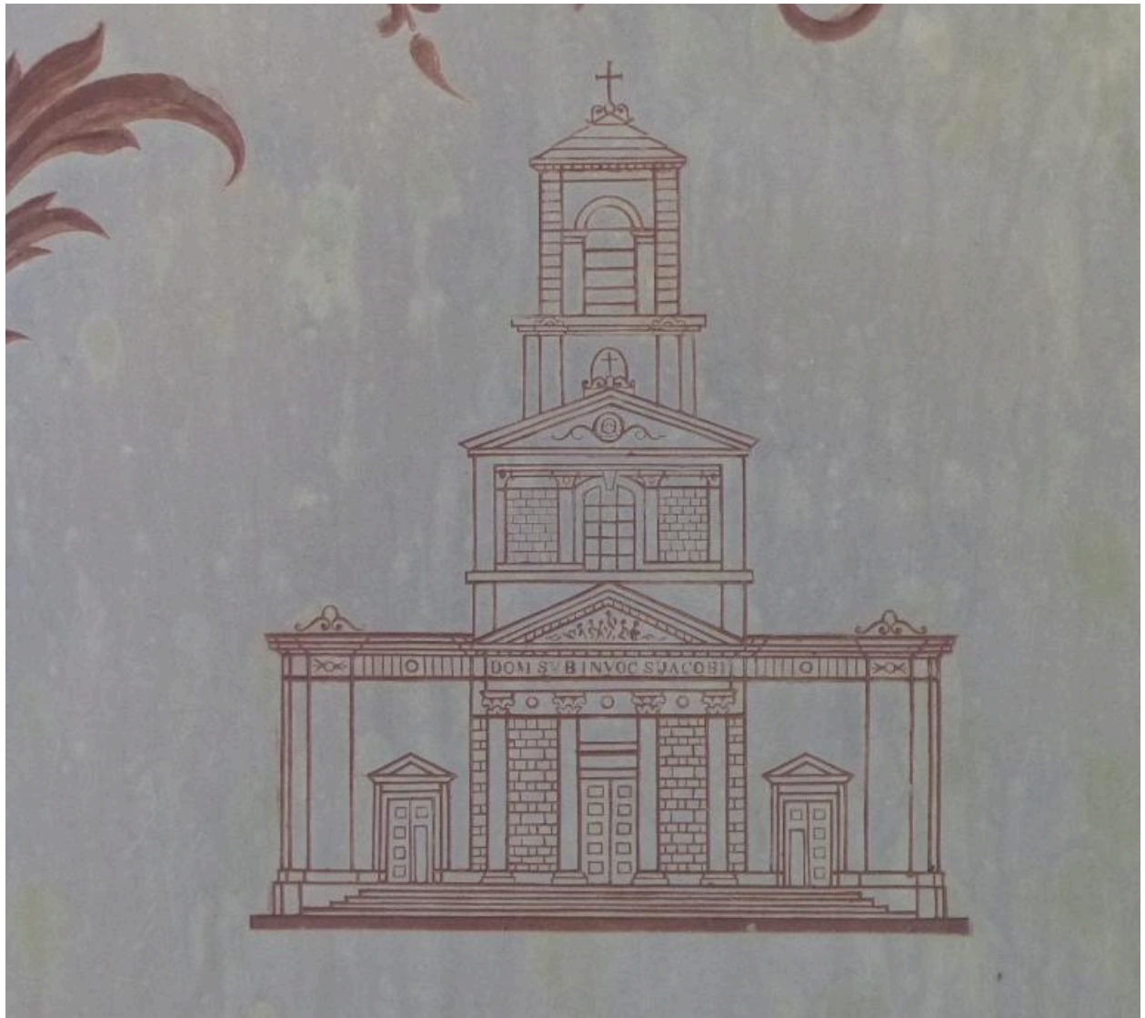
Vue de détail sur la représentation de la nouvelle église Saint-Jacques.