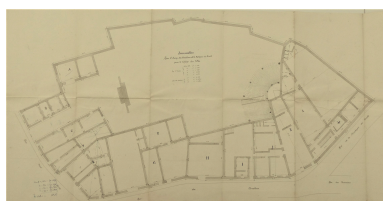
Plan