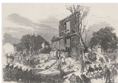
La Fête-Dieu, à Péronne. Un reposoir au milieu des ruines d'une maison de la rue Saint-Furcy, détruite pendant la dernière guerre. Extrait du Monde illustré, 1872.